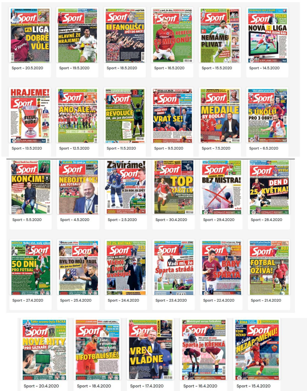
Obr. 1: Titulní strany deníku Sport v období 15. dubna do 20. května. 17