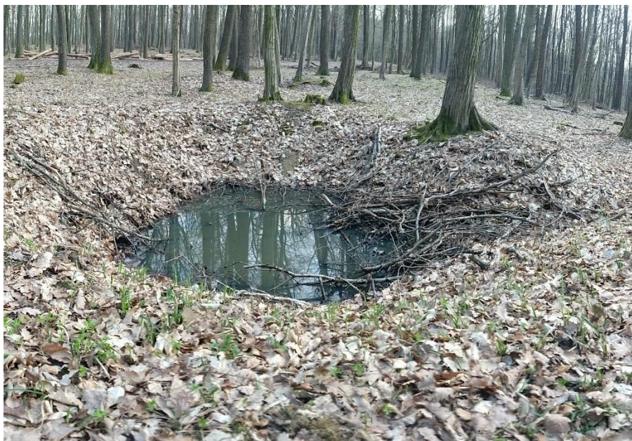
Obrázek 2. Dnešní pohled na vojenské trény z konce dubna 1945.

5. května 1945 přišel do obce mechanizovaný oddíl Rudé armády pod velením plukovníka Volkova a komisaře NKVD Žorky 26 . Ti se zde zdrželi až do 15. června, kdy byli převeleni na Japonskou frontu. 27