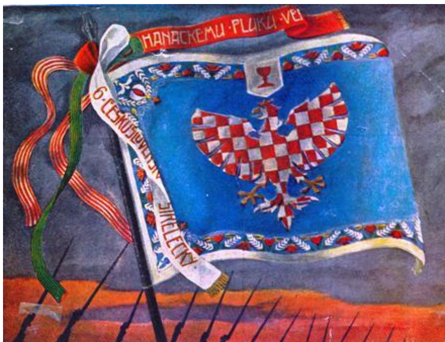
Obrázek 7. Prapor 6. hanáckého pluku.