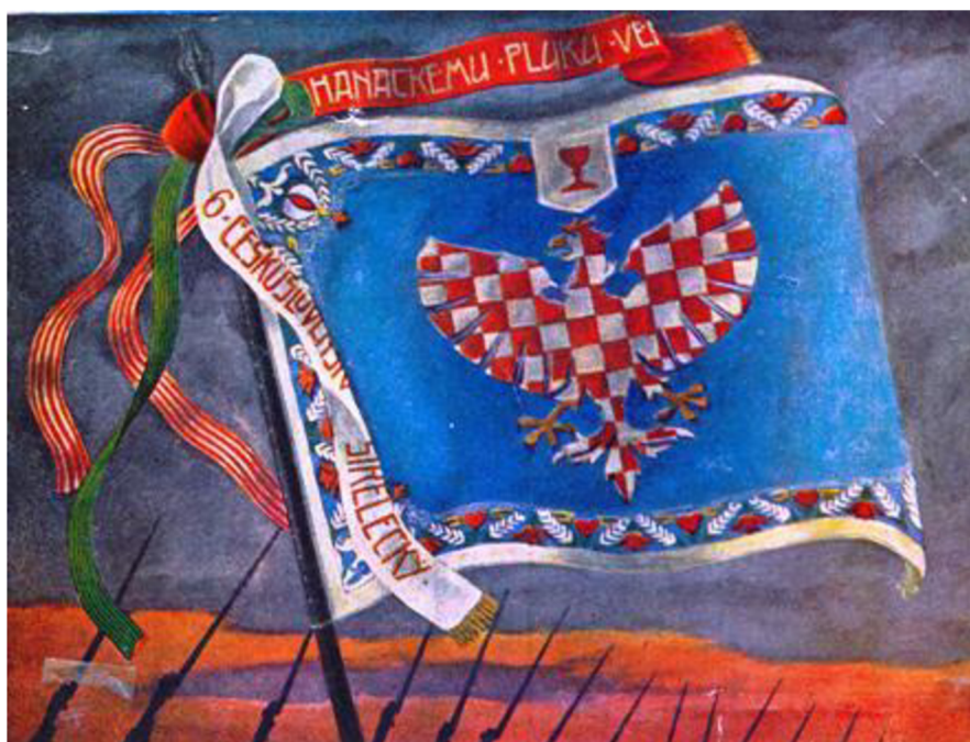
Obrázek 7. Prapor 6. hanáckého pluku.