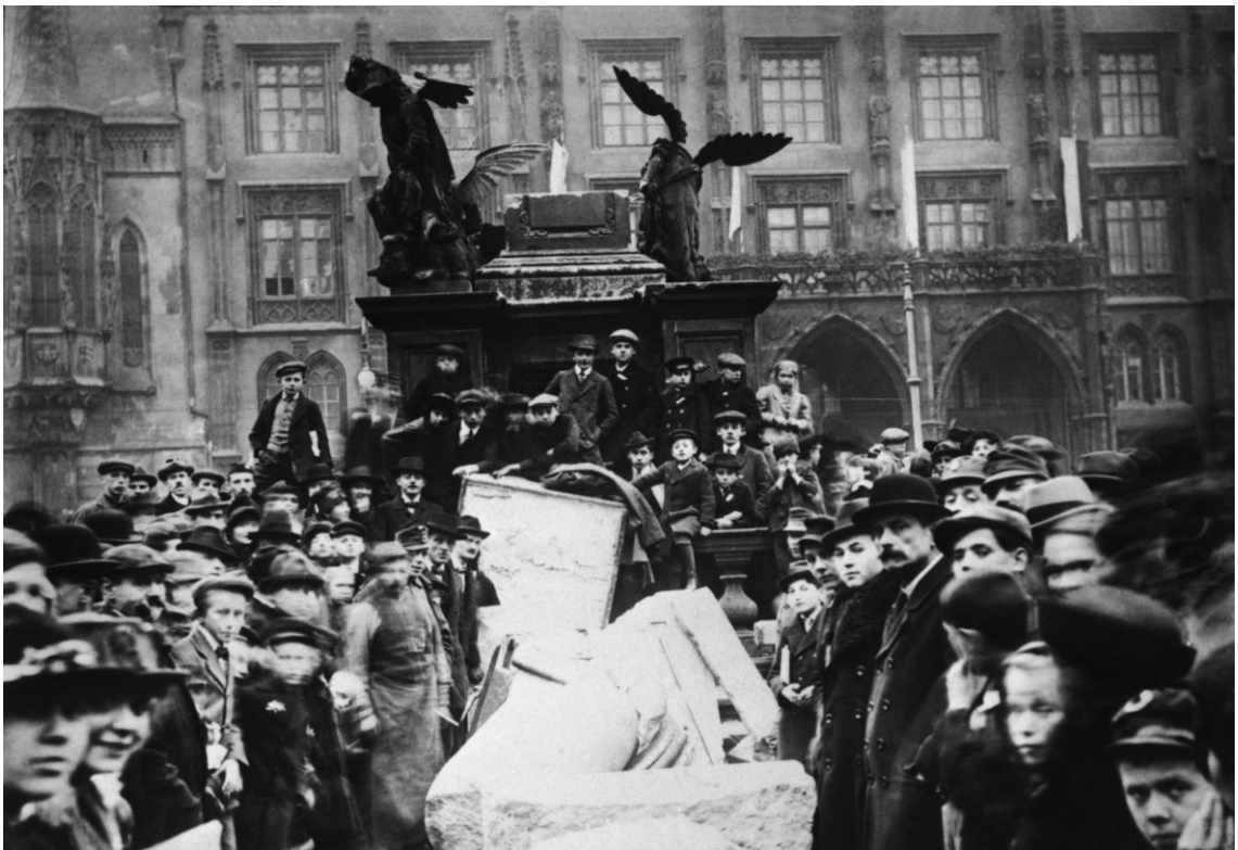
Obrázek 4 - stržení mariánského sloupu na Staroměstském náměstí v Praze, 3.11.1918