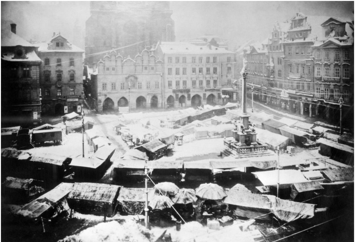
Obrázek 3 – mariánský sloup na Staroměstském náměstí v Praze, Mikulášský trh, konec 19. století