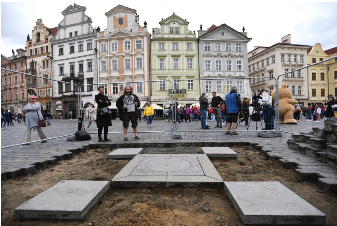
Obrázek 5 – základy mariánského sloupu na Staroměstském náměstí v Praze, 2020