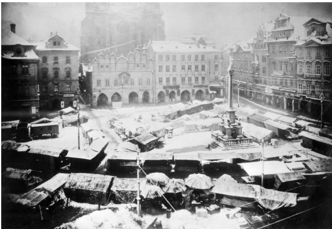
Obrázek 3 – mariánský sloup na Staroměstském náměstí v Praze, Mikulášský trh, konec 19. století