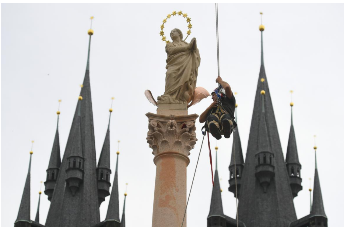
Obrázek 8 - vztyčování mariánského sloupu na Staroměstském náměstí v Praze, 2020