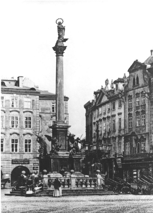
Obrázek 1 – mariánský sloup v roce 1885, zdroj: ČTK

V dnešním pohledu je problematika znovuvztyčení mariánského sloupu na Staroměstském náměstí v Praze stále aktuální. Ve veřejném dění je možné nalézt nemalé množství odpůrců jeho znovuvztyčení, ale i takových, kteří jeho obrodu nadšeně vítají, a dokonce se o ni zasazují. Nešlo by možná ani o tak mediálně sledovanou událost, kdyby mariánský sloup nebyl zbořen za tak podivné situace a kdyby nestál na tak frekventovaném a pro české dějiny tolik důležitém místě, jakým je Staroměstské