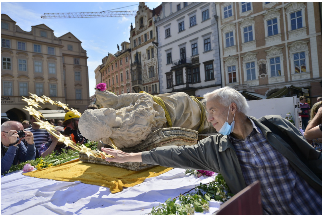
Obrázek 7 - vztyčování mariánského sloupu na Staroměstském náměstí v Praze, 2020