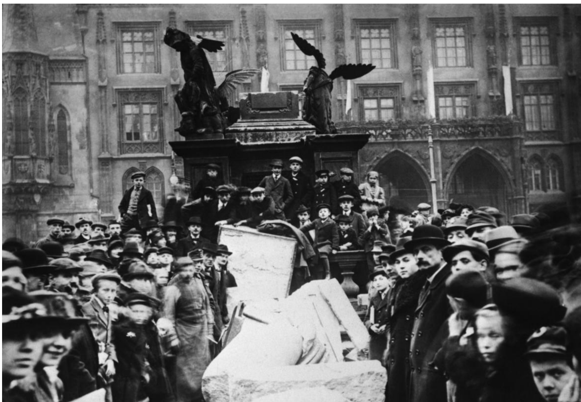
Obrázek 4 - stržení mariánského sloupu na Staroměstském náměstí v Praze, 3.11.1918