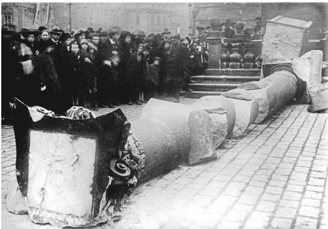
Obrázek 2 – Stržení mariánského sloupu v roce 1918

Existují i další důkazy toho, že mariánský sloup nebyl zcela jednoduše odstranit. Kromě již zmíněných zachráněných artefaktů vzpomínají historické prameny na špatně uvázané lano (to nedosahovalo do požadované výšky), krátký žebřík. Silným výrazem ojedinělého odporu proti zničení sloupu se stala žena, která si klekla do místa, kam měl být symbol Panny Marie zbořen. Byla poslána pryč a po další přibližně hodině se podařilo sloup povalit. (Blažek – Pokorný, 2020) U trosek mariánského sloupu pak jistou dobu řečnili představitelé různých uskupení. Přestože se zdá být akce zničení sloupu jako zásadní, žádný dobový tisk tehdy neinformoval o této akci na titulních stranách svých novin.