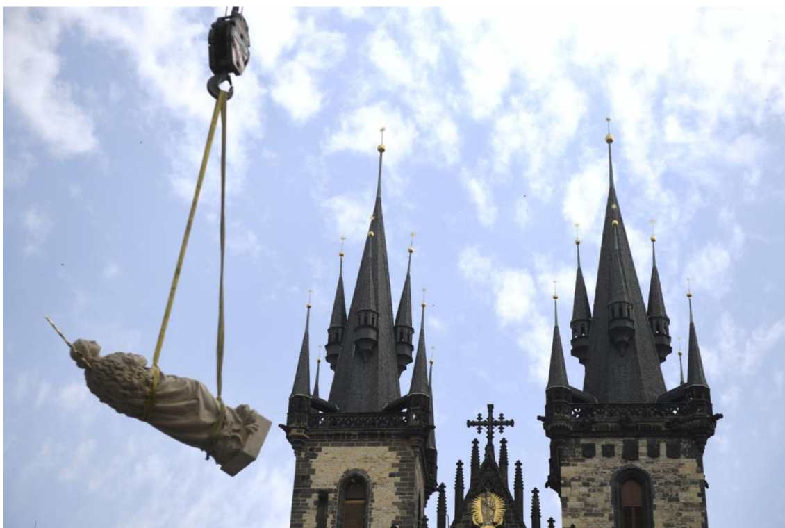
Obrázek 6 – vztýčování mariánského sloupu na Staroměstském náměstí v Praze, 2020