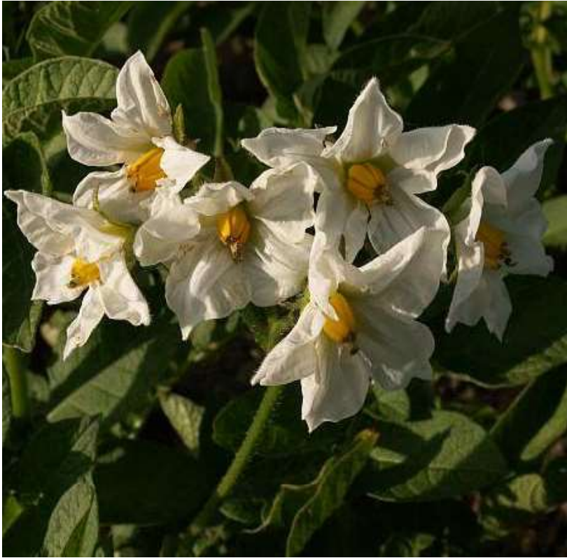
Obrázek č. 6: Vzhled Solanum tuberosum L. (převzato z Dorušková 2008)

Léčba u koní je symptomatická. U přežvýkavců se podávají antidiaroeika, mucilaginózní protektiva, bikarbonát, glukóza intravenózně, stimulancia centrální nervové soustavy a antibiotika (Svobodová et al. 2008).