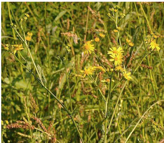
Obrázek č. 20: Vzhled Senecio erraticus Bertol.