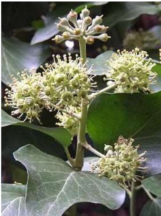
Obrázek č. 36: Květy Hedera helix L. (převzato z Kovář 2007)