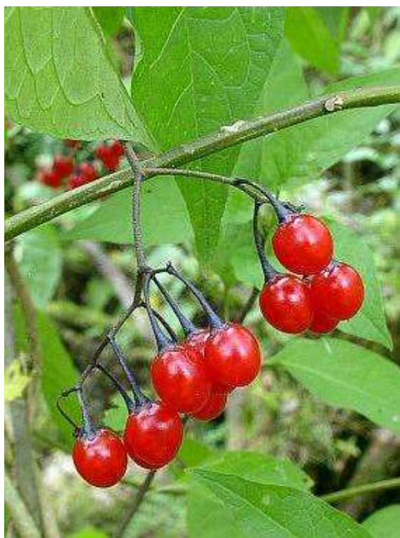
Obrázek č.9: Plody Solanum dulcamara L. (převzato z Krása 2007)