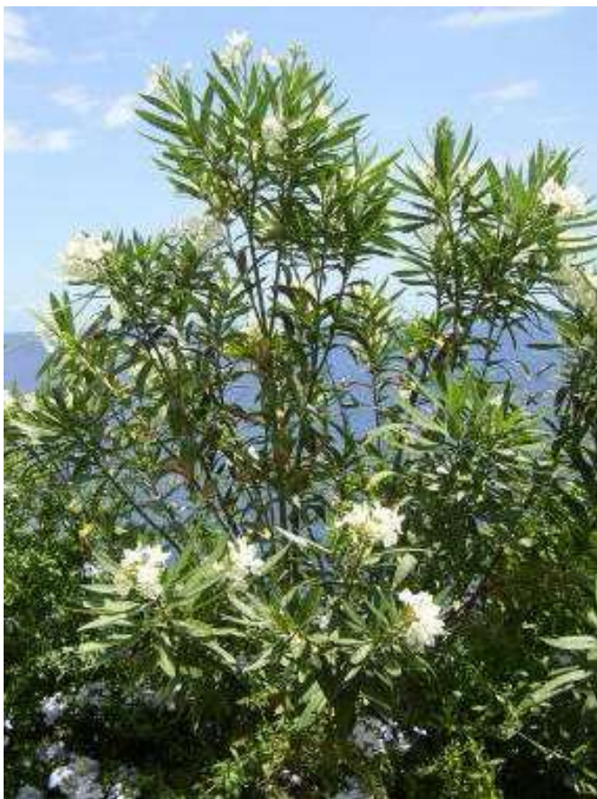
Obrázek č. 28: Vzhled Nerium oleander L.