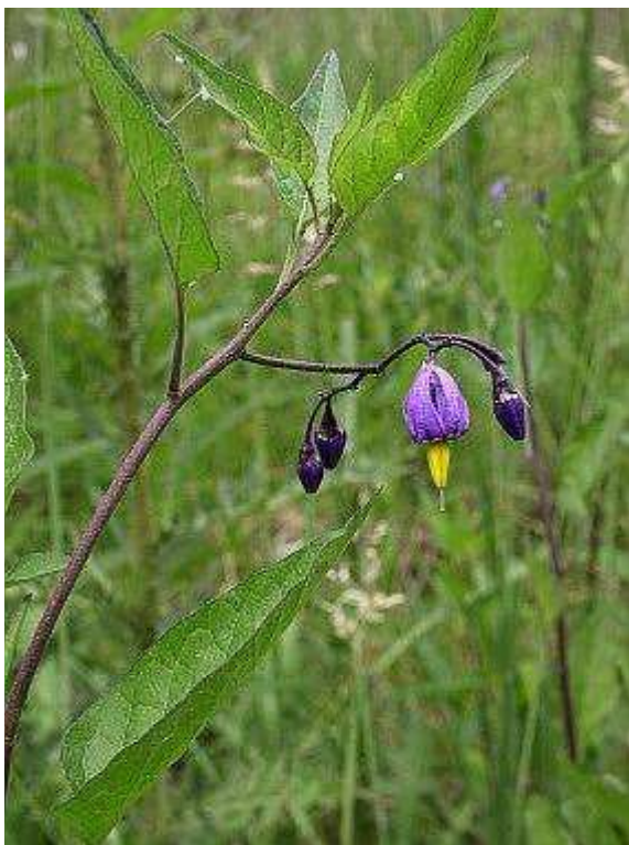
Obrázek č.8: Vzhled Solanum dulcamara L. (převzato z Krása 2007)