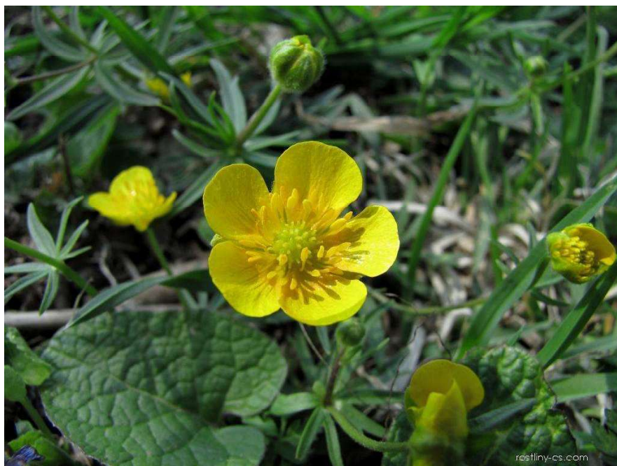
Obrázek č. 14 – Vzhled Ranunculus acris L. (převzato z Pida 2009)

Protoanemonin má silně dráždivý účinek na pokožku a sliznici. Po dotyku (zejména senzibilní jedinci) s rostlinou dochází na pokožce a sliznici k zčervenání, pálení, vytvoření vyrážky, vředů a puchýřů. Po konzumaci následuje: stomatitida (zánět dutiny ústní), zánět gastrointestinálního traktu, vomitus, hematourie, křeče, útlum dechového centra, bezvědomí a v konečné fázi smrt (Therrien et al. 1962; Rudzki & Dajek 1975). U otrávených krav se ještě vyskytuje hořká chuť masa a načervenalá barva mléka (Zapletal et al. 2001; Novák 2007).