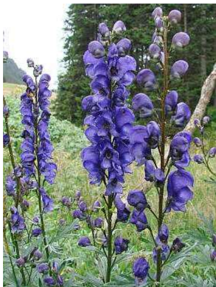
Obrázek č. 15 – Vzhled Aconitum plicatum Rchb. (převzato z Hoskovec 2007)