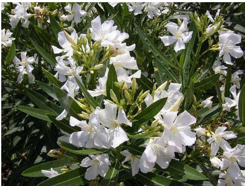
Obrázek č. 29: Květy Nerium oleander L. (převzato z Kovář 2007)