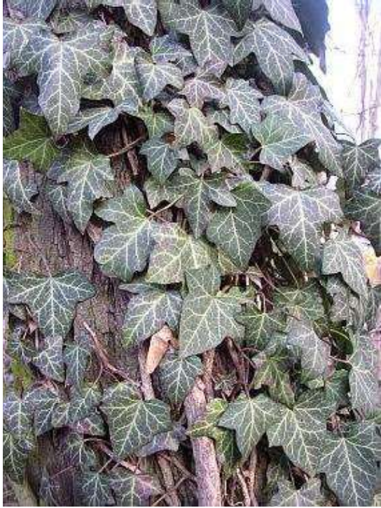
Obrázek č. 35: Vzhled Hedera helix L. (převzato z Kovář 2007)