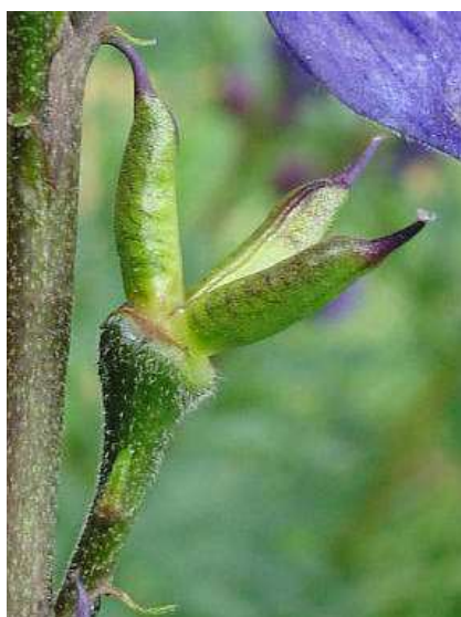
Obrázek č. 16 – Měchýřek Aconitum plicatum Rchb. (převzato z Hoskovec 2007)