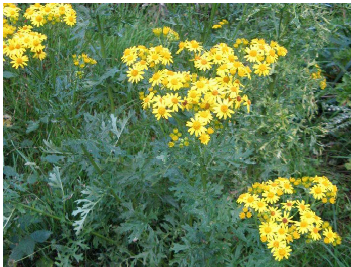
Obrázek č. 19: Vzhled Senecio jacobea L. (převzato z Higgins 2004)

Většinou otravy způsobené Senecio jacobea L. nelze léčit, a to z důvodu ireverzibilní změny tkáně jater (cirhóza, nekróza hepatocytů) (Svobodová et al. 2017). Příznivá prognóza je za předpokladu, že se jedná o precirhotický stav (stav, kdy nedošlo k poškození jaterní tkáně), dále, že je vyloučena toxická noxa a umožněna regenerace jater (Svobodová et al. 2008).