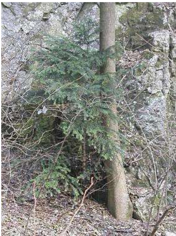
Obrázek č. 12 – Vzhled Taxus baccata L.