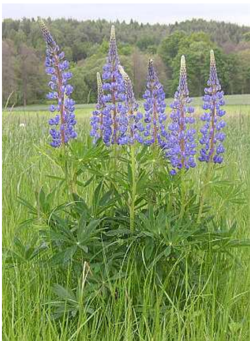
Obrázek č. 24: Vzhled Lupinus polyphyllus Lindl. (převzato z Hoskovec 2007)