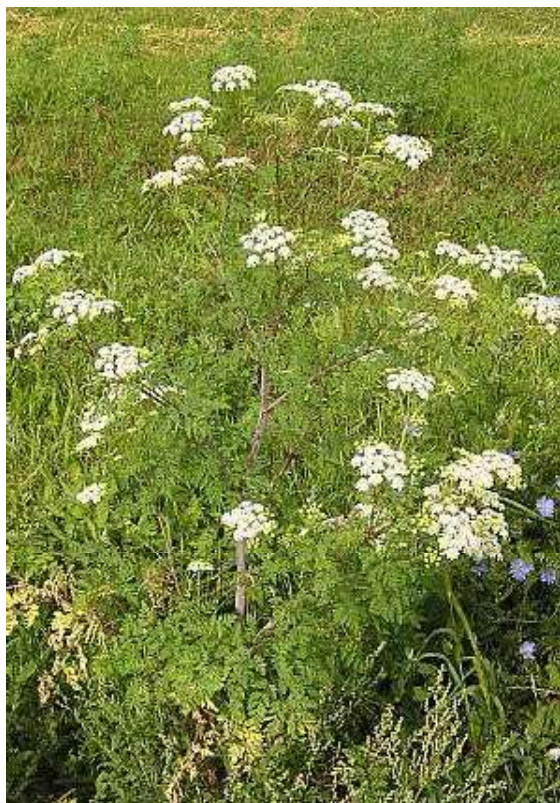
Obrázek č. 26: Vzhled Conium maculatum L.