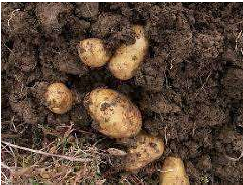
Obrázek č. 7: Hlízy Solanum tuberosum L. (převzato z Dorušková 2008)