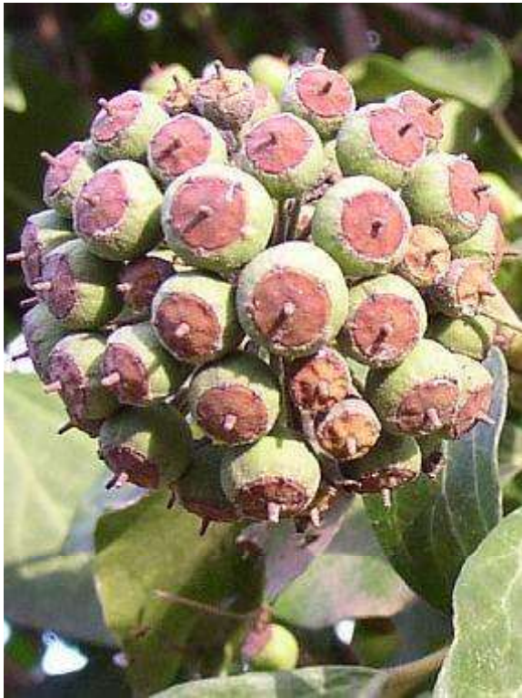
Obrázek č. 37: Plody Hedera helix L. (převzato z Kovář 2007)