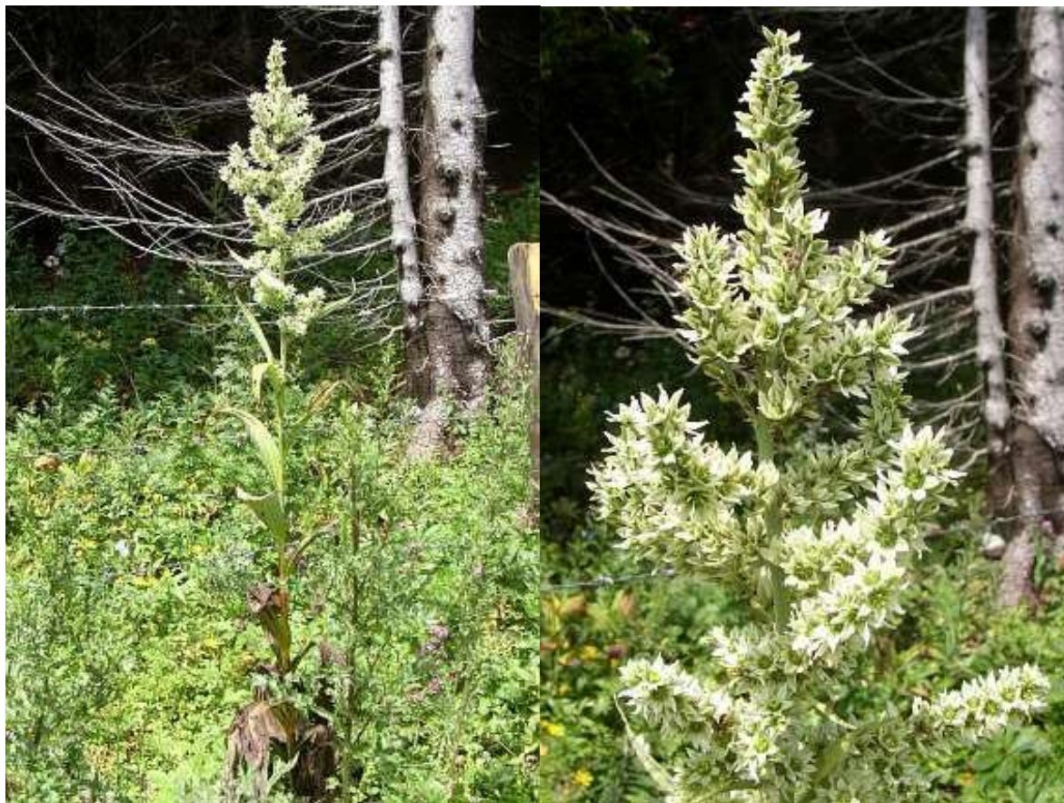
Obrázek č. 23: Vzhled Veratrum album L. (převzato z Hoskovec 2014)

Léčba spočívá v odstranění rostlinného materiálu z gastrointestinálního traktu, podání analeptik, sedativ a analgetik (Zapletal et al. 2001).