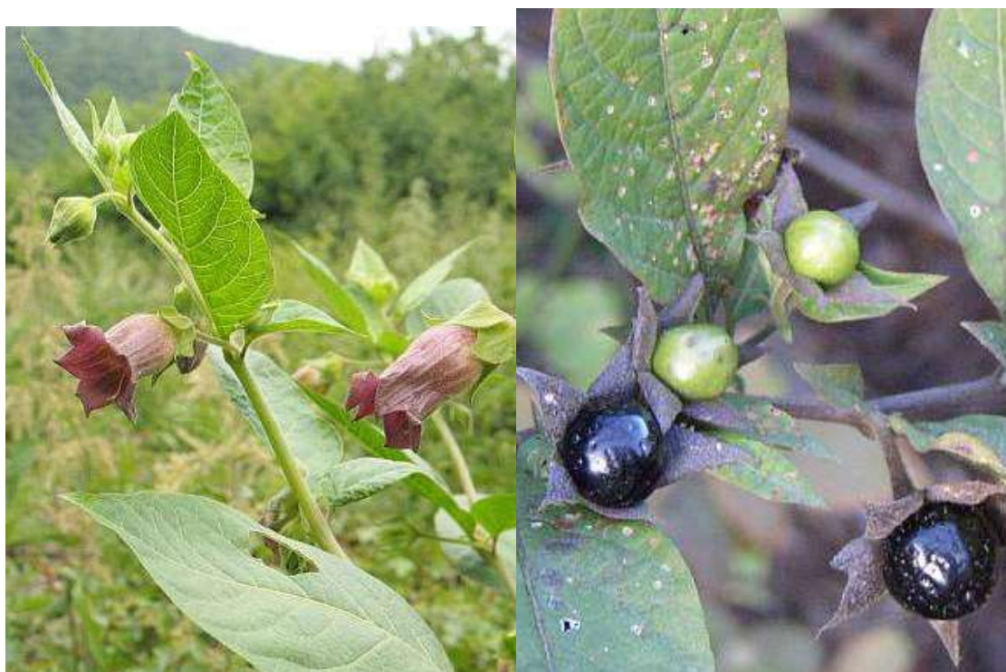
Obrázek č. 1: Vzhled rostliny a plodu Atropa bella – donna L. (převzato z Eliáš 2007)

případech centrální nervovou soustavu. Účinky na periferní nervový systém jsou následující: tachykardie, útlum sekrece bronchiálních žláz, který zapříčiňuje suchost sliznice a žláz žaludeční sliznice, mydriáza a hypotonie až atonie střev (snížená střevní peristaltika), hypertermie. U centrálního systému jsou účinky: motorický neklid, zuřivost, excitace charakteristická netypickými rychlými reakcemi na vrzuchový podnět, psychomotorické poruchy, útlum CNS, kóma a respirační paralýza (celková slabost dýchacích svalů) (Zapletal et al. 2001; Reece 2011).