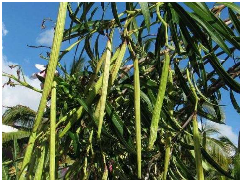
Obrázek č. 30: Plody Nerium oleander L.