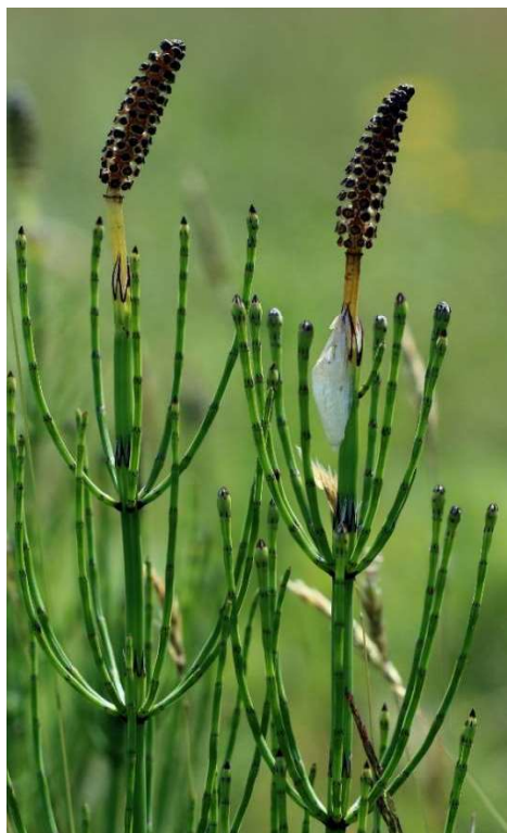
Obrázek č. 17 – Vzhled Equisetum palustre L. (převzato z Knott 2019)

Léčba u skotu spočívá v podání thiaminu parenterálně (intravenózně, subkutánně, nebo intramuskulárně) 10 mg/kg s opakováním po třech až čtyřech hodinách (Zapletal et al. 2001). Postiženým koním se také podává thiamin, a to v dávce 0,25 – 0,5 mg/kg živé hmotnosti jednou denně intravenózně, subkutánně, nebo intramuskulárně po několik dní. Na začátku lze i aplikovat vitamín B1 intravenózně v naředěné formě v dávce 5–10 mg/kg (Svobodová et al. 2008).