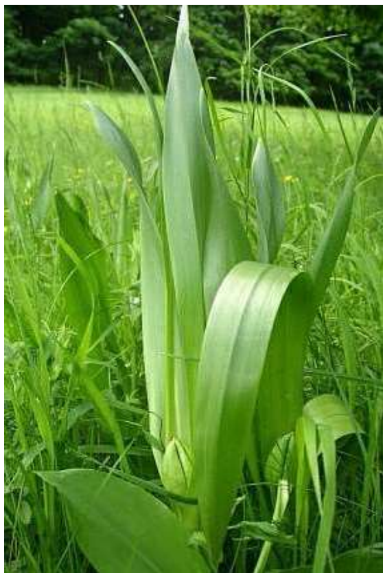
Obrázek č. 22: Listy Colchicum autumnale L. (převzato z Hoskovec 2007)