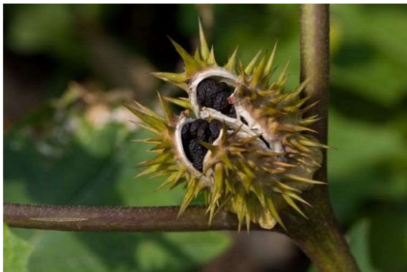
Obrázek č. 4: Plod Datura stramonium L.