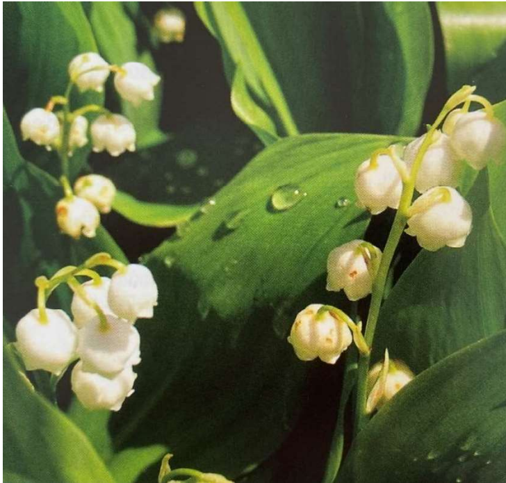
Obrázek č. 31: Vzhled Convallaria majalis L.

První pomoc zahrnuje evakuaci obsahu trávicího traktu, dále v podávání aktivního uhlí a následně použití projímadla (Novák 2007). Dále se podávají antiarytmika, antiemetika, protektiva trávicího traktu, adsorbencia. Podává se i chlorid draselný intravenózně. Při bradykardii se využívá i atropin. Je nutné zmínit, že se nesmí aplikovat kalciové přípravky (Svobodová et al. 2008).