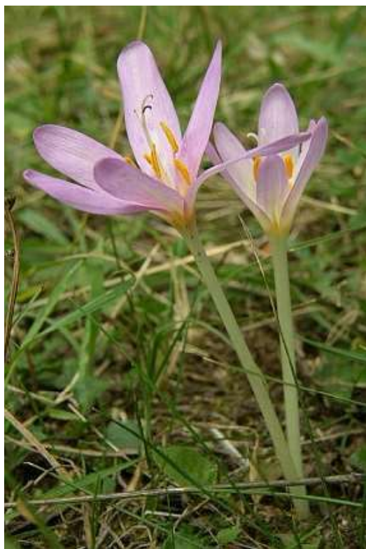
Obrázek č. 21: Květy Colchicum autumnale L.

U koní a přežvýkavců spočívá léčba kolchicinové otravy ve včasné dekontaminaci objemného krmiva, které obsahuje ocún, z trávicího traktu, dále podání léku sukralfátu léčba a podpůrné péči. Využívá se léku sukralfátu (ve světě, v České republice není tento lék doposud registrován), jako protektivum gastrointestinálního traktu, erythropoetinu nebo filgastrimu (Milewski & Khan 2006). Léčba u malých zvířat (kočky, psi) spočívá v hydrataci, podávání protektiv gastrointestinálního traktu, diazepamu při výskytu křečí, erythropoetinu v dávce 100 IU/kg nebo filgastrimu v dávce 0,005 mg/kg při anémii nebo leukopenii (Svobodová et al. 2008).