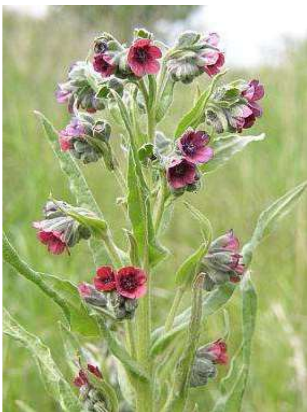
Obrázek č. 25: Horní část Cynoglossum officinale L. (převzato z Kovář 2008)

Ačkoli byly navrženy různé léčebné postupy, popřípadě doplňky stravy, žádný nebyl efektivní u hospodářských zvířat. Jediné řešení je prevence. Je nutné provádět pečlivou kontrolu krmiva, pastvin, výběhů. Kontaminovaná krmiva mohou být zkrmována jiným méně vnímavým druhům (Stegelmeier 2011).