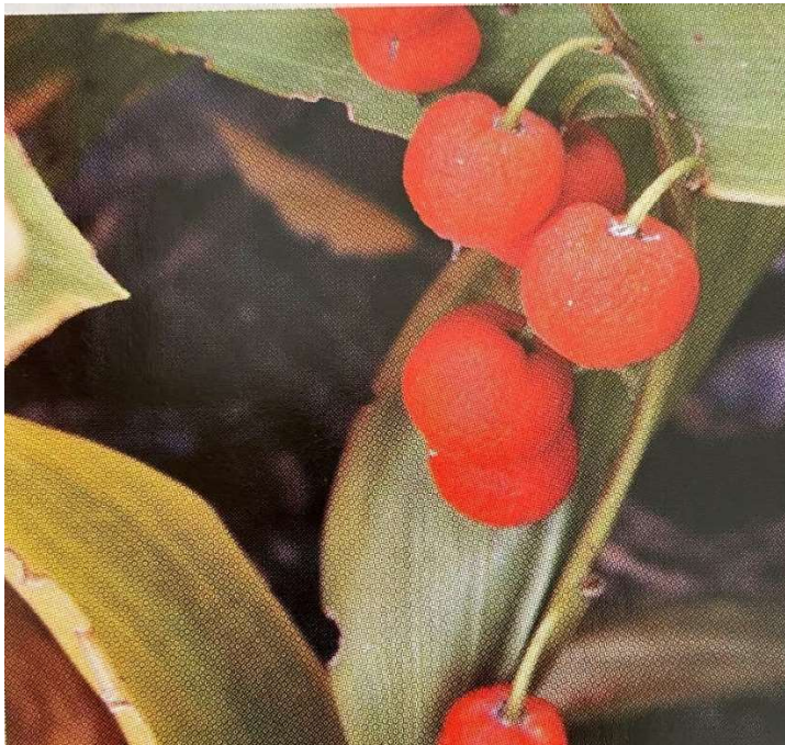
Obrázek č. 32: Plody Convallaria majalis L. (převzato z Novák 2007)