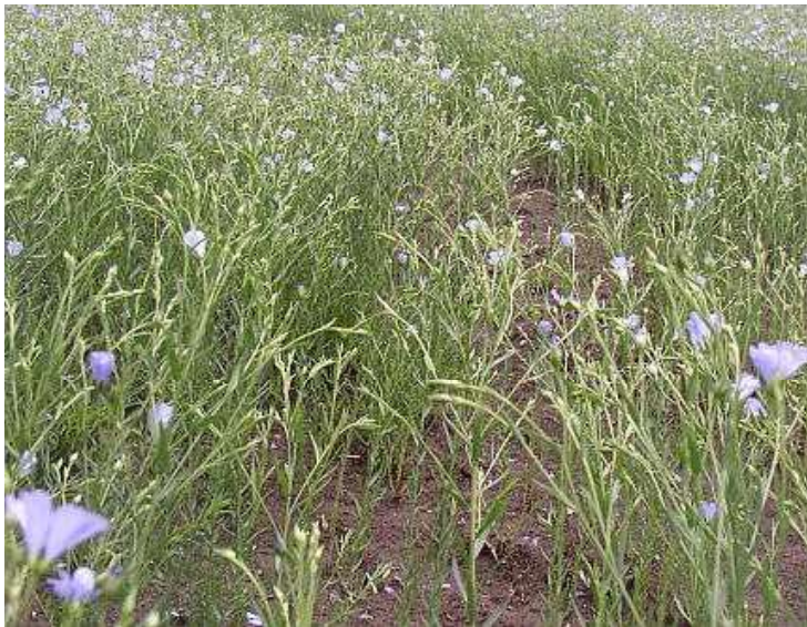
Obrázek č. 35: Vzhled Linum usitatissimum L. (převzato z Hoskovec 2007)