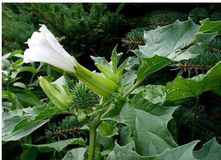
Obrázek č. 3: Vzhled Datura stramonium L. (Krása 2007)

rehydratován. Je vhodné využít i sedativa (dizepam nebo fenobarbital) pro zklidnění. Mohou se i aplikovat parasymptomimetika jako například fyzostigmin, který se používá i při otravě rulíkem zlomocným. Podává se v dávce 0,02 mg/kg živé hmotnosti intravenózně po pěti minutách. Silnější propranolol se využívá jen v situaci, kdy tachykardie přetrvává, i přes podání fyzostigminu. V terapii lze použít i pilokarpin (parasymptomimetikum) stimulující tonus, zejména při atoniích, ale je však nutné dávat pozor, aby nedošlo ke zhoršenému dýchání (Svobodová et al. 2017).