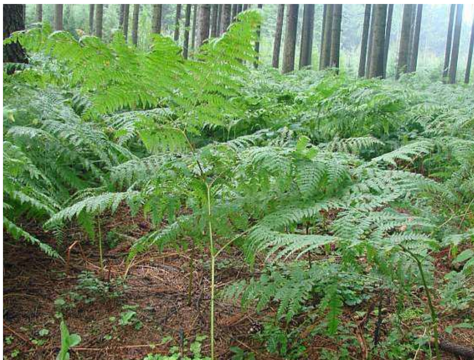
Obrázek č. 18 – Vzhled Pteridium aquilinum (L.) Kuhn

Počáteční léčba u všech druhů představuje odstranění hasivky orličí z blízkosti zvířat (Aiello & Moses 2016). Postiženým koním se podává thiamin v dávce 0,25 – 0,5 mg/ kg jednou denně intravenózně, subkutánně nebo intramuskulárně po dobu několik dní (Svobodová et al. 2008). Stejným způsobem se to provádí i u přežvýkavců. U těchto druhů se využívá i transfúze krve, dokonce i trombocytů, ale je nutné si uvědomit, že u skotu je potřeba velký objem krve (Aiello & Moses 2016). U prasat dochází k efektivní léčbě při perorálním podávání thiaminu perorálně v dávce 9 mg na 1 kg živé hmotnosti a pyridoxinu 0,66 mg na 1 kg živé hmotnosti pyridoxinu (Waret – Szkuta 2021).