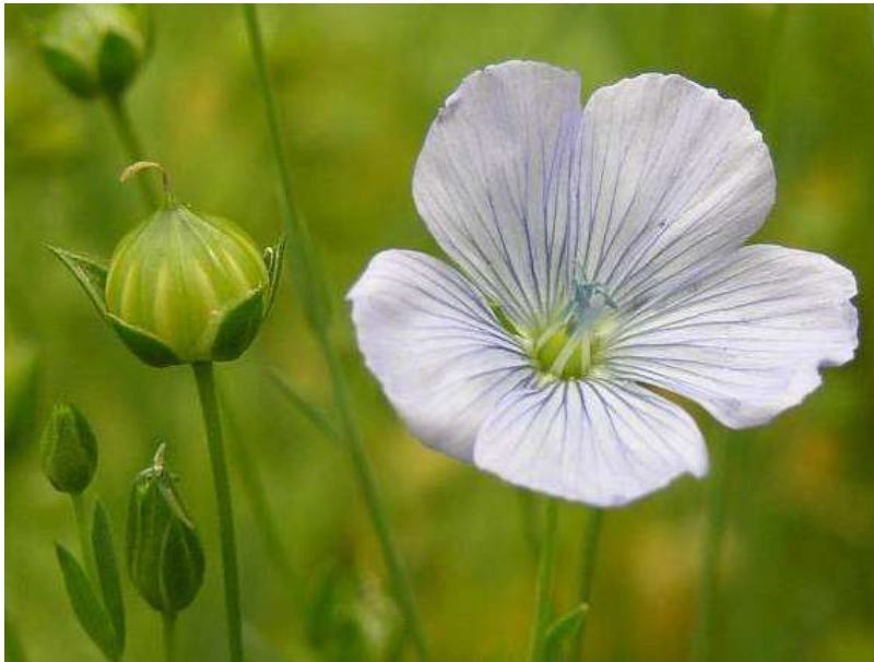
Obrázek č. 34: Vzhled nezralého plodu a květu Linum usitatissimum L. (převzato z Hoskovec 2007)