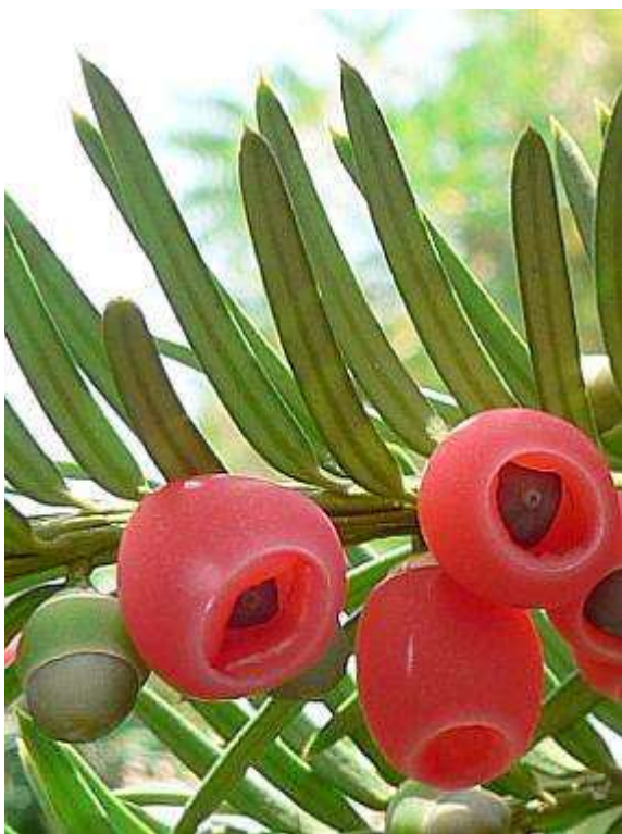
Obrázek č. 13 – Míšky a jehličí Taxus baccata L. (převzato z Leugnerová 2007)