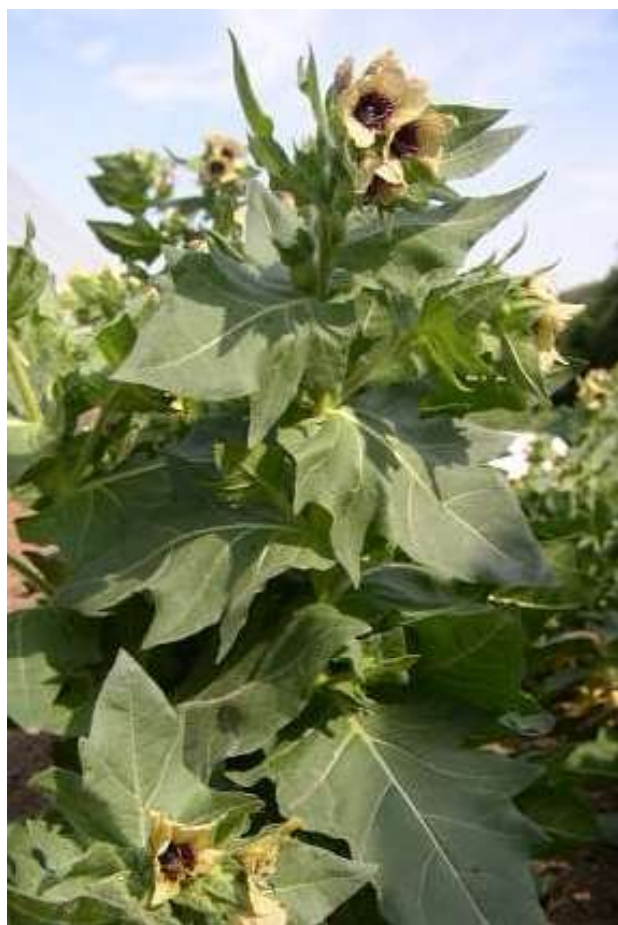
Obrázek č. 2: Vzhled Hyoscyamus niger L. (převzato z Hoskovec 2007)

Klinické příznaky intoxikace jsou podobné jako v případě otravy Atropa bella – donna L., to znamená, že při intoxikaci u koně dochází k: hubnutí, tachykardii, snížení dýchací frekvence, cyanóze sliznice, polyurii a s tím související polydipsii, mydriáze, hematourii, páchnoucímu průjmu, gastrointestinální atonii charakterizovanou zácpou a kolikou hypertermií (Delorme & Coudert 2017; Verstraete 2010). Z obecného hlediska intoxikace je klinický projev následující: suchost sliznice v horní části dýchacího a trávicího traktu, mydriáza, změny v srdeční a dýchací frekvenci, změny v centrálním nervovém systému (ataxie, podrážděnost, neklid, křeče atd.) (Verstraete 2010). Princip léčby je u všech intoxikací způsobených tropanovými alkaloidy podobný. Primárně je nutné v co nejkratší dobu provést výplach žaludku, následuje ochlazování zvířete k snížení hypertermie. Využívá se i sedativ pro celkové zklidnění a parasymphatomimetik pro stimulaci atonie (Svobodová et al. 2017).