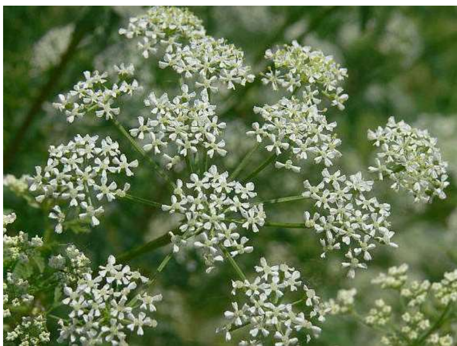
Obrázek č. 27: Květy Conium maculatum L. (převzato z Mižík 2008)