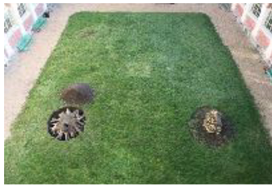
Exhumace ostatků stromů, Rennes (FR), 2016–2017

Stromy, které zde rostly, reprezentují dobu vzniku této historické budovy. Odkazují na specifickou funkci tohoto místa tzv. „Rajského dvora“. Moderní přestavby ze začátku 21. století vytvářela architektonická generace vychovávaná v duchu racionality 20. století. Sémiotická vrstva klášterního dvora a rajské zahrady v této době definitivně vypadla a byla nahrazená kontextem vzdělávací institucí moderní liberální Francie. Stromy se svou historickou symbolikou křesťanského ráje byly odstraněny, takřikajíc zabity modernitou. Je možné, že byly odstraněny z důvodu stáří či nemoci, podstatný je ovšem fakt jejich zmizení bez náhrady. Stavba prošla puristickou očištnou kúrou moderní architektury od sentimentální romantické vrstvy. Zůstala zde pouze účelná travnatá plocha akademické půdy.