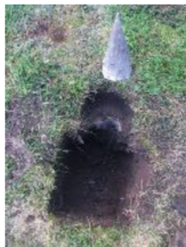
Sběr a lov, 2013—2017

Dalším z mých projektů byl projekt Exhumace ostatků stromů , který jsem vytvářel v roce 2016/2017 ve městě Rennes (Francie), kde jsem byl na půlroční stáži. V tomto případě mé práce vypadává dřívější aspekt ekologického apelu. V případě tohoto projektu je podstatný především historický kontext místa. Jedná se o site-specific instalaci v atriu tamní školy. Budova školy byla postavena původně s funkcí kláštera Navštívení panny Marie, konkrétní datum stavby se mi nepodařilo zjistit. Roku 1911 1 se do této budovy nastěhovala École régionale des beaux-arts de Rennes. Impulsem pro vytvoření díla byla fotografie atria budovy z roku v tomto 1914. V tomto roce byla tato budova zabrána francouzskou armádou pro přeměnu na doplňkovou armádní nemocnici č. 34, která byla využívána v rámci bojů 1. světové války. Z tohoto válečného období pochází i fotografie, na které je zobrazeno atrium postavené pravděpodobně v romantizujícím architektonickém stylu 19. století, jehož základy můžeme hledat v renesanci či baroku, tyto slohy čerpaly z tradic antické kultury.