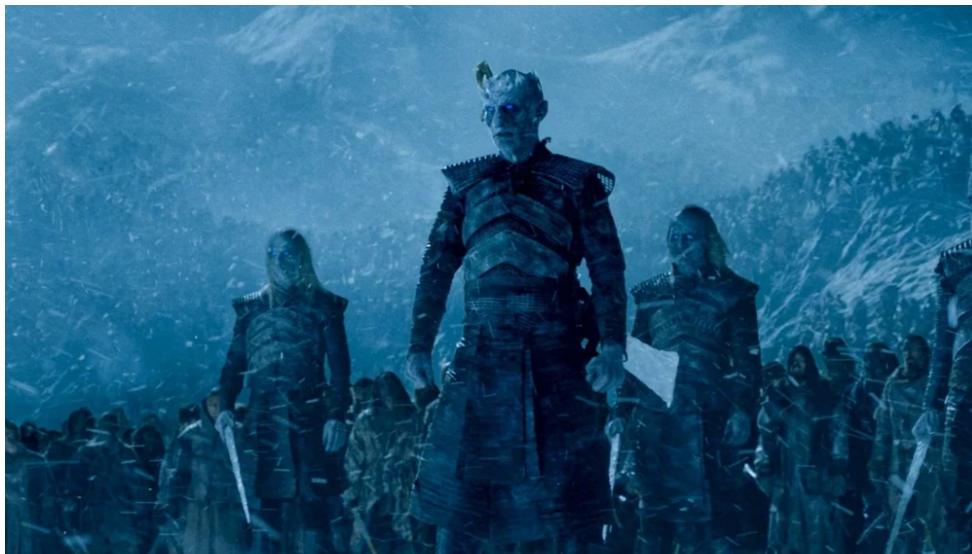
Abbildung 6: Die Weißen Wanderer und ihr Totenheer

Wenn die Weißen Wanderer töten, kehrt ihr Opfer im Grunde als ein Zombie zurück. Auch dies könnte seine Inspiration in den alten nordischen Sagen finden, da die Riesen