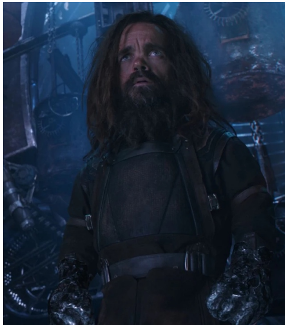
Abbildung 19: Eitri – der Zwergenschmied

Die Götter tragen verschiedene Gegenstände, die meistens ihre Kraft steigern. Jemand musste aber diese magischen v.a. Waffen erzeugen. In den Mythen wird es so erklärt, dass die Gegenstände von den Zwergen hergestellt wurden. 86 So einen Zwerg lernt man in dem Film Avengers: Infinity War kennen. Er heißt Eitri (Sindri) und Thor besucht ihn, um sich eine neue Waffe herstellen zu lassen. Er ist sehr mächtig und macht ihm eine Ersatzwaffe für den Hammer Mjöllnir, der von Hel zerstört wurde. Dieser Zwerg bewohnt Nidavellir 87 . In dem Film geht es um einen Stern, der als Schmiedewerkstatt dient. In der Geschichte sollte Eitri (Sindri) auch den Hammer Mjöllnir erzeugen, was mit dem mythologischen Stoff übereinstimmt. In den eddischen Texten liest man über Gegenstände, die von einem gleichnamigen Zwerg geschaffen worden sind. 88 In den Filmen ist beispielsweise Gungnir (der Speer Odins) zu sehen. Doch wird in den Filmen nicht eindeutig gesagt, ob die bestimmten parallelen Gegenstände von den Zwergen aus Nidavellir stammen.