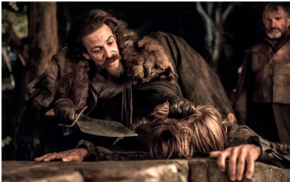
Abbildung 10: Die letzten Sekunden vor dem Handabhauen Lannisters

Jaime Lannister gehört zu einer der mächtigsten und reichsten Familien in Westeros. Seine Geschichte ist eher tragisch. Er stand immer bei seiner Familie und vertritt ihre Ansichten bezüglich der Machtverteilung in dem ganzen Königreich. Seine größte Liebe war seine Schwester Cersei, mit der er auch drei Kinder hat. Er konnte es nie öffentlich zugeben, weil sie die Ehefrau des Königs war. Er hatte sich daher für das Leben eines Soldaten entschieden. Er galt für einen der besten Fechter im Land. Während eines Krieges wurde er gefangen. Obwohl er versuchte, mit seinen Feinden mitzuarbeiten, und alles auf dem guten Weg zur Freilassung war, wurde ihm als Strafe seine dominante Hand abgehauen. Etwas ähnliches ist dem Gott Tyr passiert. Wie es schon in dem Kapitel über die Welt Tolkiens mit Auseinandersetzung Berens mit dem Wolf verglichen worden ist, hatte dem Gott ein Riesenwolf die Hand abgebissen. 73