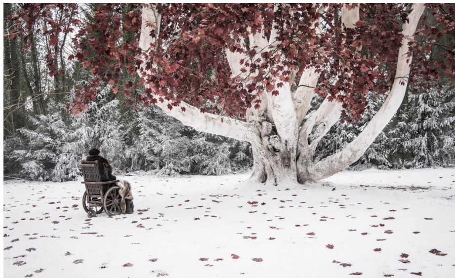
Abbildung 7: Brandon Stark bei dem Zauberbaum

Eine weitere Gottheit heißt Heimdall. Dieser Gott dient als Wächter der magischen Regenbogenbrücke Bifrost . Eine seiner außerordentlichen Fähigkeiten ist, dass er ein sehr gutes Sehvermögen besitzt, er sieht nämlich in alle Winkel der neun Welten. 67 Diese Fähigkeit beherrschte auch Brandon Stark, der von dem Status eines verkrüppelten Edelmanns zum Dreiäugigen Raben wächst. Er ist stark mit der Natur verbunden und mithilfe der magischen Bäume und Raben er kann alles sehen, was er will. Er sieht nicht nur die Gegenwart und Vergangenheit, sondern auch die Zukunft. Diese Fähigkeit bringt ihm noch einen Schritt näher zum Heimdall, der sie auch beherrscht.