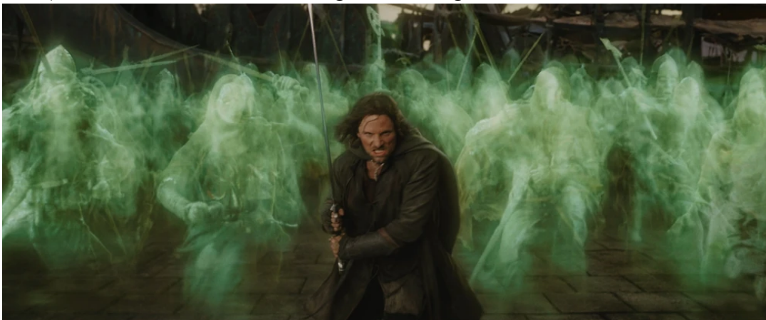
Abbildung 4: Aragorn mit dem Schattenheer

Als mitteleuropäisches Beispiel könnte man Friedrich Barbarossa (bzw. Karl den Großen) erwähnen, der im Untersberg in Salzburg mit seinem Heer abwarten soll. 59