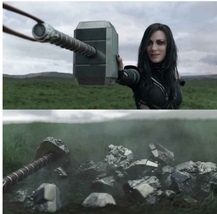
Abbildung 16: Hel zerstört das Hammer Mjöllnir

Eine Hauptrolle spielt die Göttin Hel. Im Gegensatz zu ihrem mythologischen Ursprung wird sie in den Filmen als erstgeborene Tochter Odins vorgestellt. Sie ist dann die Schwester von Thor und Loki. Sie war gefährlich und deswegen hat sie Odin ins Gefängnis gestellt (eigentlich in die Welt Helheim, die die christliche Hölle repräsentiert). Nach dem Tod des Allvaters befreit sie sich und will unbedingt die Herrschaft über das Land der Götter erlangen. Sie ist sehr mächtig und schöpft die Kraft gerade aus Asgard. Ihre unsägliche Kraft wird durch die Zerstörung des Hammers Mjöllnir demonstriert.