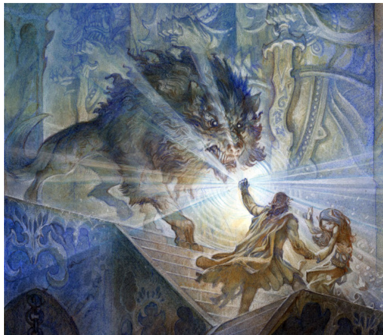
Abbildung 3: Der Kampf zwischen Beren und dem Wolf

Diese Geschichte ähnelt einem Ereignis aus der nordischen Mythologie. Der Gott der Kriege Tyr sollte den riesigen Wolf Fenrir (Fenriswulf) mit einer magischen Kette binden, aber musste dabei seine Hand in das Wolfsmaul stecken, dann hat ihm Fenrir die Hand abgebissen. 55 Die Rache vollzog Tyr aber nicht. Der Wolf wird während der Götterdämmerung Odin ermorden und erst danach von einem der Söhne Odins getötet werden. 56