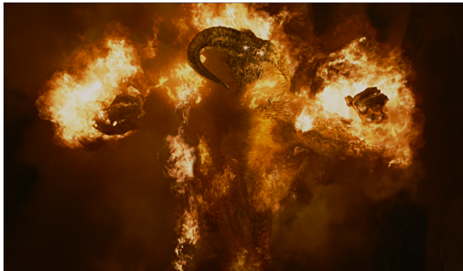
Abbildung 2: Der Feurdämon Balrog aus Moria

Wenn jetzt die Sprache auf den Kampf mit Balrog kommt, wäre es passend, die Konnotation vorzustellen, die mit dieser Figur verbunden ist. Ein Balrog lässt sich als eine riesige, feurige und grausame Gestalt mit einem feurigen Schwert beschreiben. Er könnte auch als ein Feurdämon bezeichnet werden. In der Zeitperiode, in der sich Der Herr der Ringe abspielt, lernt man nur diesen einen Balrog kennen, der das Zwergenkönigsreich Moria besiedelte. 45 Das Königreich Moria wird von Tolkien als ein unterirdisches Gebiet beschrieben und später zeigt sich, dass dies die bösen Orks bewohnen.