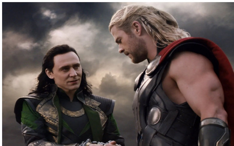
Abbildung 15: Loki (links) und Thor (rechts)

Wie schon bekannt ist, sind diese zwei Figuren einander sehr nah, weil sie zusammen einige Abenteuer erlebt haben. Sie sind aber auf keinen Fall verwandt. Trotzdem werden diese zwei Figuren in den Filmen als Brüder dargestellt. Thor ist der echte Sohn Odins. Loki wurde als Baby von Odin nach einer Schlacht gefangen, damit er eine Art Sicherung hat. Loki ist in der filmischen Wirklichkeit Sohn eines Eisriesen. 82 Sie wurden beide als Asgardians erzogen. Thor ist in dieser Verarbeitung – im Gegensatz zu der mythologischen Vorlage – ein blondhaariger Mann mit athletischer Figur. Die Stellung beider Figuren wird durch die Farben ihrer Kleidung vorgezeichnet. Das Rot bei Thor wirkt positiver als das Dunkelgrün bei Loki. 83