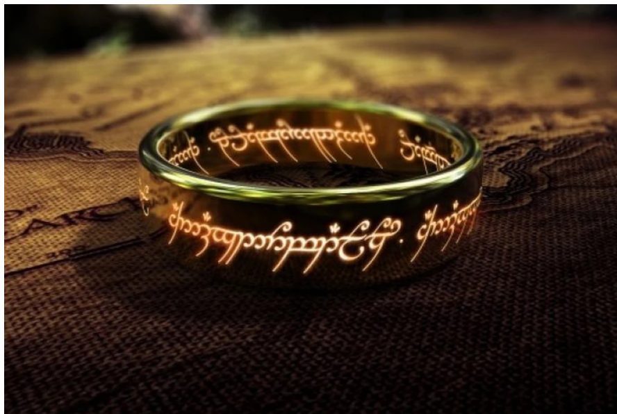
Abbildung 1: Der Eine Ring

Ein wichtiges Symbol sowohl in der nordischen als auch in der Tolkien-Mythologie ist der magische Ring. Solche magischen Gegenstände erscheinen in vielen Legenden der Edda. Zu den bekanntesten zählt man Draupnir (Odins magischer Ring), der von Zwergenschmieden stammt. Der Ring hat die Fähigkeit, dass von ihm jede neunte Nacht acht „Kopien“ tropfen. Laut Simek hat Tolkien nur das Motiv der Unterwerfung der Ringe dem Hauptring Draupnir herausgenommen. 36