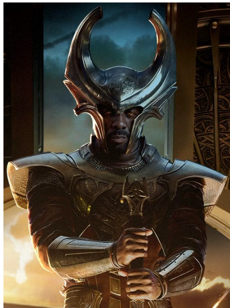
Abbildung 18: Heimdall – der Wächter der Götter

Zwei Nebenfiguren, die aber für die Entwicklung der Geschichte notwendig sind, sind meiner Meinung nach der Gott Heimdall und der Zwerg Eitri. Heimdall ist ein Gott, der die Rolle eines gleichnamigen Gottes aus der Edda spielt. Er wird auch der weiße Ase genannt. 85 Seine Eigenschaften und Fähigkeiten wurden schon in dem Kapitel beschrieben, das sich mit den nordischen Göttern beschäftigt. Gibt es aber irgendwelchen Unterschied zwischen dem literarischen und dem filmischen Heimdall? Es gibt meiner Meinung nach keinen. Heimdall bewacht Bifröst und dadurch auch den Eingang zu Asgard. Als Hel nach Asgard kommt, schützt er die Asgardians und nimmt sie mit in die tiefen Berge, wo seine Burg verborgen ist. Schon in dem ersten Film zeigt er sein Misstrauen gegenüber Loki, das ihm für alle weiteren Filme bleibt. Dies repräsentiert die schon erwähnte Feindschaft mit Loki aus den mythologischen Quellen.