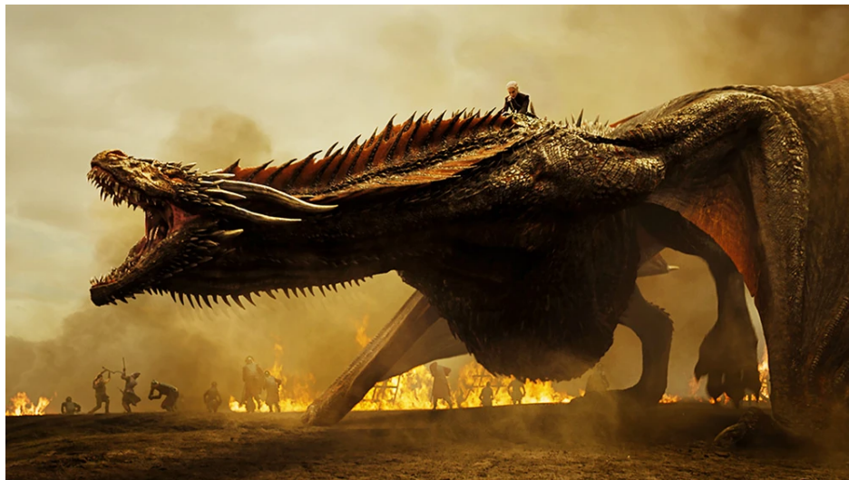
Abbildung 8: Der Drache im Kampf

Eine weitere Menschengruppe, die einige Zusammenhänge mit den nordischen Mythen enthält, ist das Geschlecht Targaryen. In ihrem Wappen tragen sie einen Drachen. Später in der Geschichte tauchen auch lebende Drachen auf, die zu einer der mächtigsten Waffen in Westeros werden.