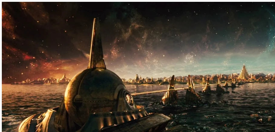
Abbildung 13: Die Regenbogenbrücke Bifröst

Die Asgardians verfügen über fortgeschrittene Technik und manche beherrschen Magie (oder mindestens besitzen einige magische Fähigkeiten). Die Magie wird oft mittels der Zauber-Gegenstände durchgeführt. Eine traditionelle Art und Weise, wie man nach Asgard kommen kann, ist die Regenbogenbrücke Bifröst , die nicht als eine magische Brücke, die den Menschen nur als Regenbogen sichtbar ist, sondern als eine Errungenschaft der Technik scheint. Welche Rolle sie in den Geschichten spielt und was mit ihr passiert, wird noch geklärt.