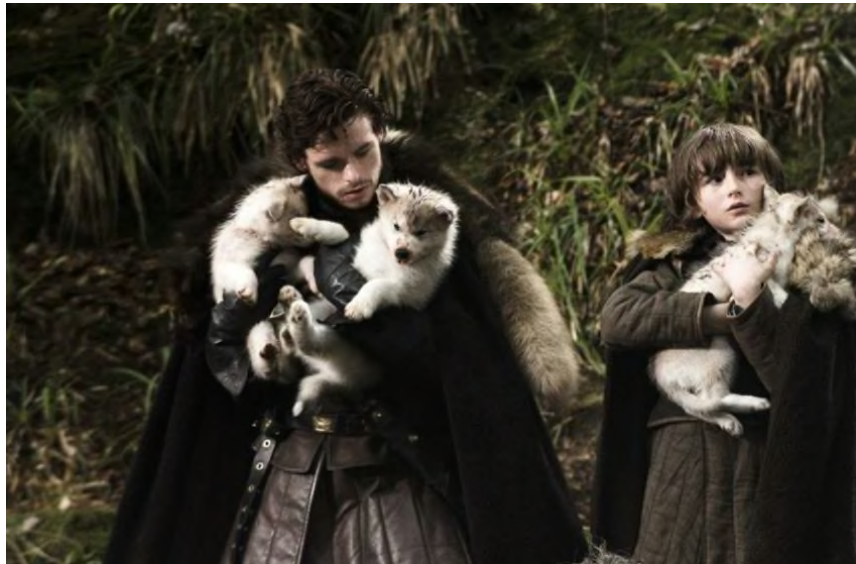
Abbildung 11: Die Wölfe für die Kinder Starks

Wölfe dürfen in der nordischen Mythologie sowohl positiv als auch negativ konnotiert sein. Der böse Riesenwolf Fenrir ist eine der stärksten Kräfte während Ragnarök . 74 Selbst Odin hat jedoch seine beiden Wölfe, Geri und Freki, die ihm in jede Schlacht folgen. 75 Die Starks sind eines der zentralen Geschlechter des Werks, die auf ihrem Wappen den Schattenwolf schildert. Gleich wie Odin haben Angehörige der Familie Stark (die Kinder der Figur Eddard Stark) einen Wolf, der sie begleitet und verteidigt.