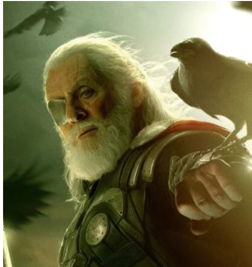
Abbildung 14: Odin mit seinen Raben

In den ersten zwei Filmen wirkt Odin als Verkörperung der Gerechtigkeit. In dem dritten kommt es zu einem plötzlichen Wandel. Nach bestimmten Ereignissen (v.a. ist der Tod Odins wichtig) wird in dem Thronsaal die Deckenmalerei enthüllt, die die Schattenseite Odins zeigt. Es wird erklärt, dass Odin ein grausamer Krieger war, der die neun Welten versklaven wollte. Damit der Film in das ganze Filmuniversum hineinpasste, wurde sein Zug mit der Suche nach 6 magischen Steinen, die man als Machtgier interpretieren kann, eingebaut. Nach einiger Zeit hatte er seine Stellung geändert und wurde zu einem gerechten friedlichen König.