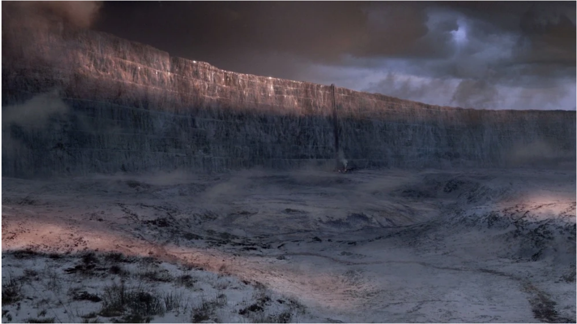
Abbildung 5: Die Mauer im Norden