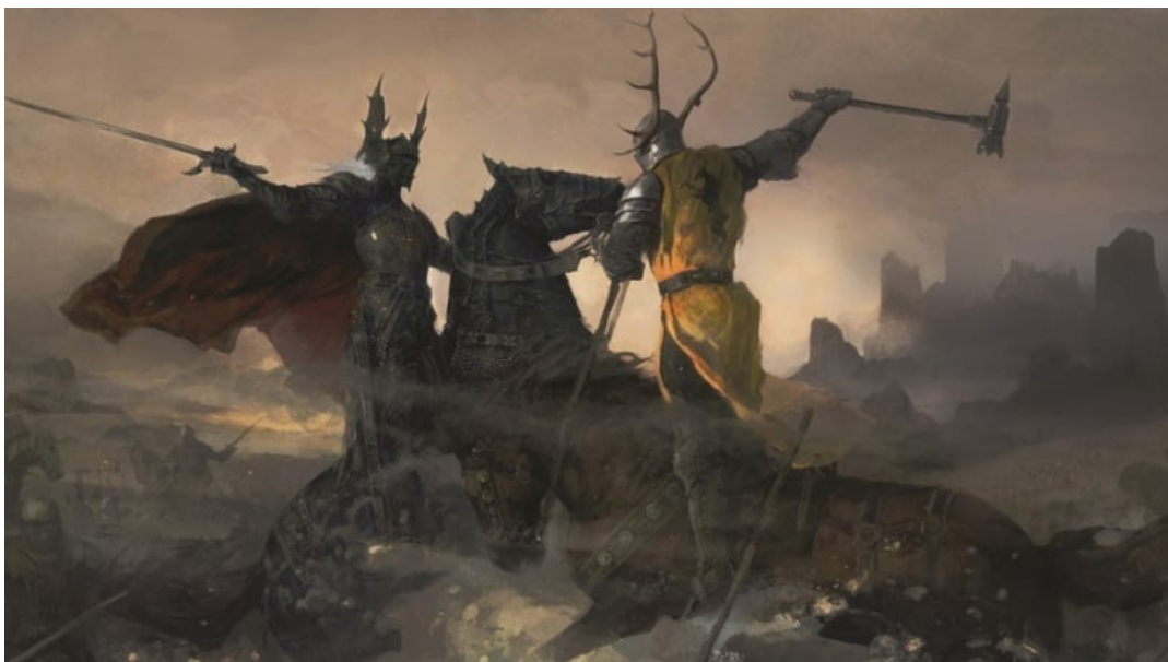
Abbildung 9: Baratheon vs. Targaryan

Diese zwei besprochenen Geschlechter hatten in der Geschichte einander bekämpft. Der Krieg endete mit dem Tod des Targaryen-Prinzen und des Königs. Da die Targaryens in der Vergangenheit die Drachen gesattelt haben, lässt sich sagen, dass sie mit der Natur verbunden wurden. Es erinnert an den Krieg zwischen Asen und Wanen. Die Umstände scheinen gleich zu sein. Eine der Gruppe wollte größere Macht und deswegen hat sie mit dem Krieg angefangen. In diesem Sinne könnte man behaupten, dass die Targaryens die Wanen repräsentieren.