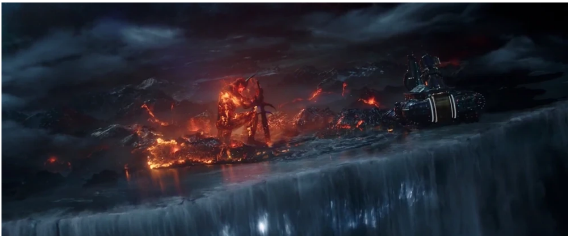
Abbildung 17: Surtur zerstört Asgard

Da es unmöglich scheint, Hel zu besiegen und gleichzeitig die Asgardians zu retten, entscheidet sich Thor zu einem definitiven Zug. Um Hel von Asgard zu trennen, muss Asgard vernichtet werden. Er stellt Hel einen neuen Gegner. Mit Hilfe der magischen Flamme erweckt er den Feuertämon und Herrscher von Muspelsheim Surtur, dessen einziges Ziel ist, Asgard mit Flammen zu zerstören. Es gelingt ihm und Asgard explodiert. Jedoch die Asgardians überleben und sind in der Suche nach einem neuen Asgard, das auch später gegründet wird. Die Filmversion von Surtur ist eigentlich ein notwendiges Übel. Einerseits zerstört er das Heim der Götter, andererseits hilft er ihnen Hel zu besiegen, ohne es bewusst zu machen.