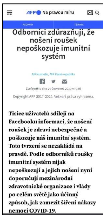
Ukázka č. 1