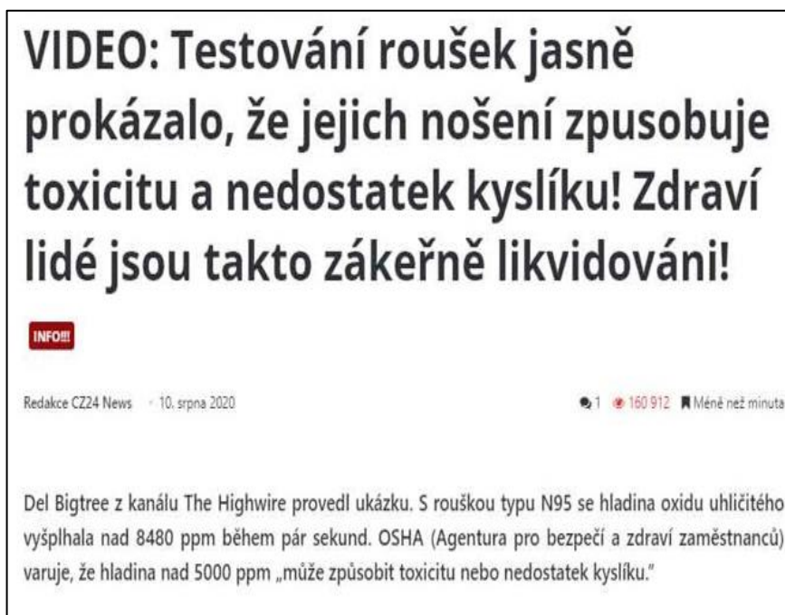
Ukázka č. 2