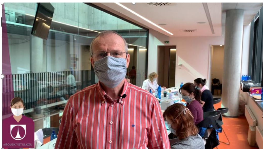
Ukázka č. 3