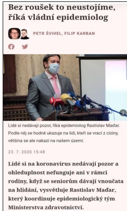
Ukázka č. 8