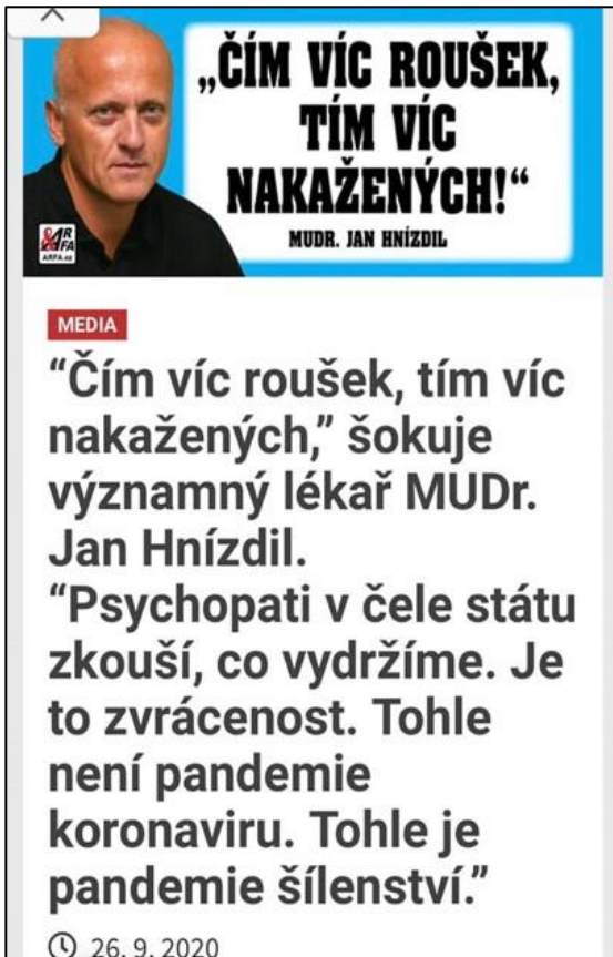
Ukázka č. 7