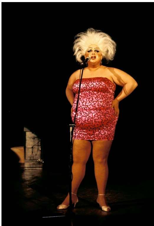
Obrázek 7 – Divine

Americký magazín označil Divine jako „Drag Queen of the Century“ (česky Drag queen století). I desítky let po jejím úmrtí má stále mnoho fanoušků. Byla založena společnost Divine Official Enterprises, LLC, která si klade za cíl udržet dědictví Divine (Divine, cit. 2020-02-18).