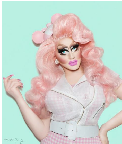
Obrázek 12 – Trixie Mattel

Trixie Mattel je známá především pro svůj bizarní vzhled připomínající panenku Barbie. Rovněž i ona byla účastnicí soutěže RuPaul's Drag Race. Kromě svých show točí také hudební klipy, vystupuje v divadle a má svou kosmetickou značku (Trixie Mattel, cit. 2020-01-18).