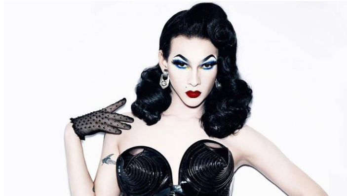
Obrázek 10 – Violet Chachki