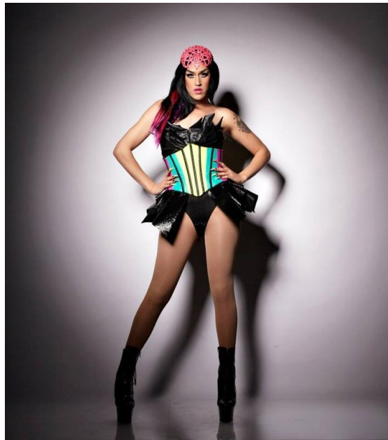
Obrázek 9 – Adore Delano

Adore Delano je Drag queen, která se snaží od ostatních odlišit svou vizáží. Příkladně se především k rockerskému vzhledu. Patřila mezi soutěžící v reality show RuPaul's Drag Race. Prezentuje se jako genderqueer (Adore Delano, cit. 2020-01-18).