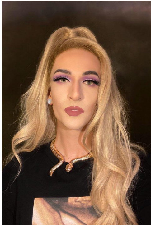
Příloha 1 - Cassiopeia