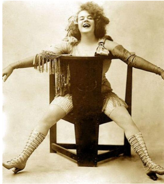
Obrázek 5 – Bert Savoy