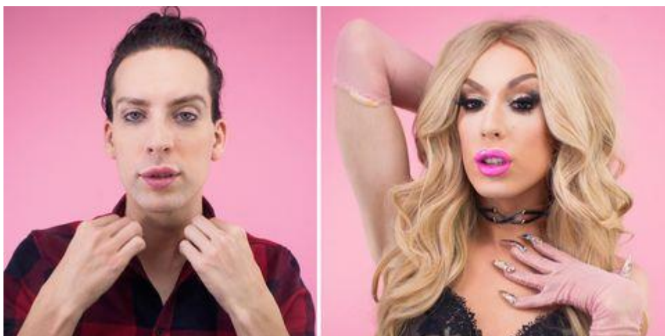
Obrázek 11 – Alaska

Alaska, někdy také Alaska 5000, Alaska Thunderfuck nebo Alaska Thunderfun je americký umělec a finalista 5. řady RuPaul's Drag Race. Věnuje se především hudbě a na kontě má již několik alb. Mimo svého někdy až mimozemského vzhledu se proslavila také tím, že byla 4 roky ve vztahu s jinou Drag queen. Rovněž byla účastnicí RuPaul's Drag Race. Alaska má tři Drag daughters jménem Nevada Thunderfuck, Florida Thunderfuck a Nebraska Thunderfuck (RuPaul's Drag Race Wiki, cit. 2020-03-09).