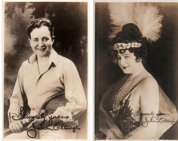
Obrázek 4 – Julian Eltinge