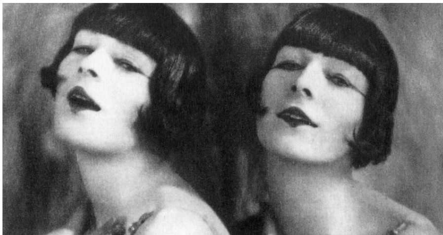
Obrázek 2 – The Rocky Twins