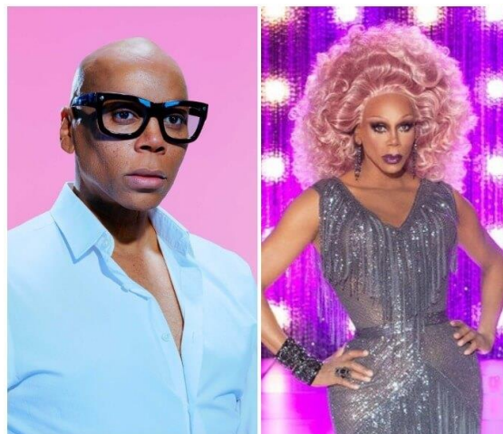
Obrázek 8 – RuPaul Andre Charles

RuPaula můžeme považovat za drag ikonu. Bývá označován jako nejkomerčnější a nejúspěšnější Drag queen ve Spojených státech amerických. Téměř všechny Drag queen po celém světě k němu vzhlíží. Jak již bylo řečeno, je známý především díky své reality show RuPaul's Drag Race, ve které hledá ty nejlepší Drag queens z celého světa. Show nejenže moderuje, je ale také hlavním porotcem. Tato show má nyní po celém světě miliony diváků. Soutěž běží od roku 2009 a nyní se chystá již 12. řada. Podařilo se mu proslavit přes 120 Drag queens. Nebyl to však jeho jediný pořad. V letech 1996–1998 měl svou talkshow s názvem The RuPaul Show, do které si zval známé hudební hvězdy. Přestože je mu skoro 60 let, je stále úspěšný. Kromě toho, že má svůj pořad, který moderuje, žíví se také zpěvem, herectvím a modelingem. V roce 2017 se umístil mezi 100 nejvlivnějšími lidmi na světě. Dokonce můžeme najít jeho voskovou figurínu ve známém muzeu Madame Tussauds v New Yorku a na Hollywoodském chodníku můžeme narazit na jeho hvězdu (RuPaul Official Site, cit. 2020-02-15).