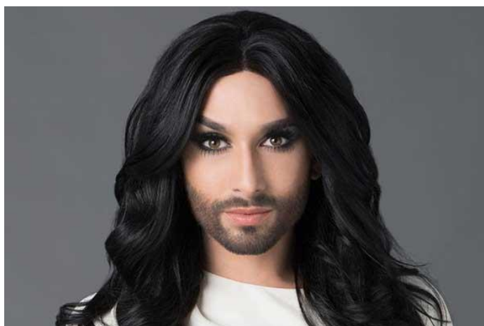
Obrázek 13 – Conchita Wurst