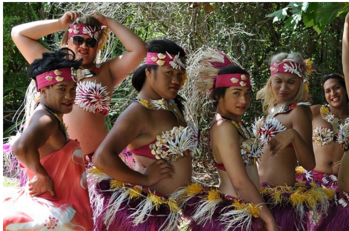
Obrázek 1 – Fa afafine v Samoa