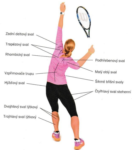
Obr. 3 Svaly, ktoré sa zapájajú pri akceleračnej a konečnej fáze podania (Vágner, 2016)