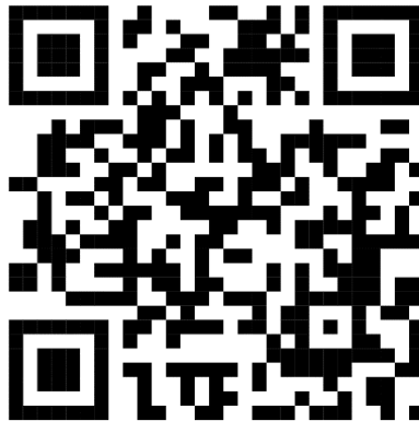
Obr.4 QR kód na naskenovanie videa

Vo výsledkoch sa budeme venovať spôsobom zlepšenia techniky a porovnaniu 3 fáz podania od októbra 2022 po apríl 2023. Vo výsledkoch pozorujeme viditeľné zlepšenie všetkých 3 fáz podania, ktorým sme sa venovali. Súčasťou výsledkov je metodické video, ktoré je dostupné s QR kódom na YouTube ( Obr.4). V zátvorkách za textom budú uvedené minúty videa, v ktorých sa danej hráčke venujeme.