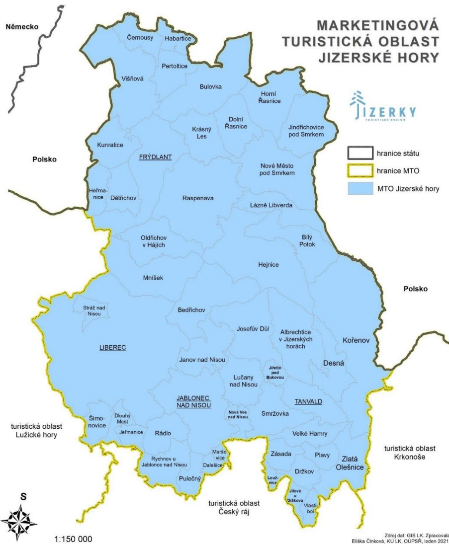
Obrázek 2: Turistický region Jizerské hory Zdroj: TRHJ (2023)

Následující podkapitoly jsou věnované analýze vnitřního a vnějšího prostředí destinace se zaměřením na cyklistiku. Nejprve jsou rozebrány lokalizační a realizační faktory a následně analýza návštěvnosti a konkurence. Podkapitola analýza podmínek pro rozvoj cyklistiky se bude věnovat současným trendům ve světě cyklistiky a mimo jiné také aktivitám infocenter působících v regionu Jizerské hory.