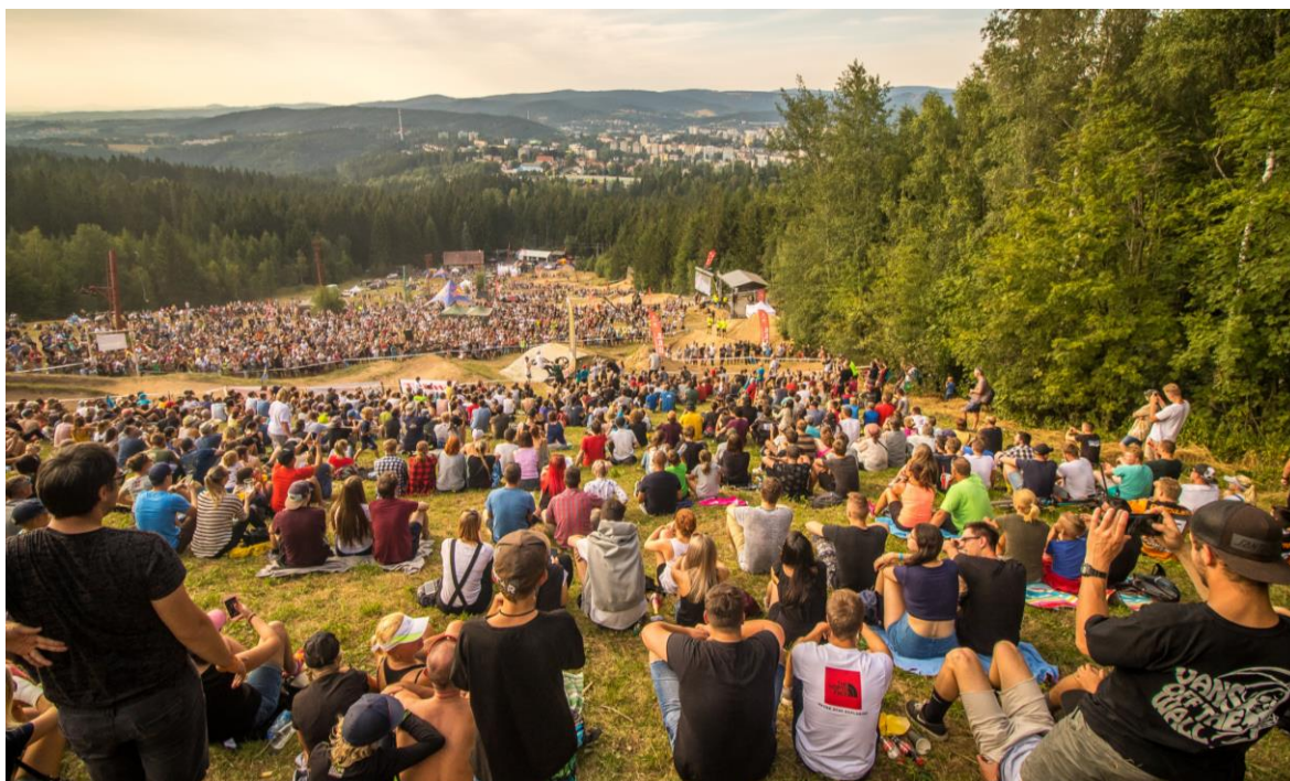
Obrázek 7: JBC 4X Revelations

V Jizerských horách probíhají také cyklistické akce a závody. Jedním ze závodů je závod horských kol ČT Author Cup, který se každoročně pořádá v Bedřichově a jedná se o největší závod na horských kolech v České republice. Závodu se může účastnit každý, obvykle ale závodí profesionální závodníci. Letošní 27. ročník se bude konat 14. října 2023. Závod nabízí dvě trasy – delší je dlouhá 66,7 km, druhá kratší měří 41,9 km. Generálními partnery jsou Česká televize, která závod živě vysílá, a prodejce kol Author. Kromě samotného závodu je v areálu doprovodný program a v cíli jsou závodníkům k dispozici maséři (ČT Author Cup 2023). Dalším závodem je ABB MTB Cup. Ten letos čeká již 13. ročník a bude se konat 27. května 2023. Závodníci si mohou vybrat mezi 33 km a 54 km dlouhou trasou. Závod startuje a končí před firmou ABB a vede přes Bramberk, Slovanku, Královku, Josefův Důl, Špičák, Černou Studnici a Nisanku (ABB MTB Cup 2023). Za zmínku stojí bikepark pro fourcross v Jablonci nad Nisou v areálu Dobrá Voda, který je možné vidět na obrázku č. 7 níže. Od roku 2013 se zde pořádají závody světového formátu s názvem JBC 4X Revelations, na které každoročně dorazí tisíce fanoušků (JBC 4X Revelations 2022).