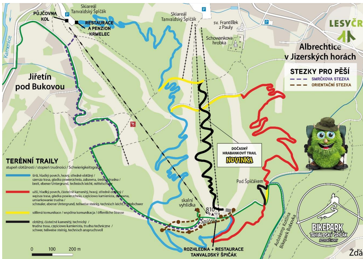
Obrázek 4: Bikepark Tanvaldský Špičák

V letní sezóně v roce 2022 bylo možné zakoupit zvýhodněné lístky na lanovou dráhu – 3, 6 a 10 jízd, dospělí za jízdy zaplatili 370 Kč, 620 Kč a 830 Kč, junioři do 18 let a senioři nad 63 let 300 Kč, 520 Kč a 700 Kč a děti do 14 let 230 Kč, 390 Kč a 520 Kč. Dále byla možnost zakoupit denní, dvoudenní a desetidenní lístky. Dospělí za tyto lístky zaplatili 670 Kč, 1150 Kč a 4900 Kč, junioři a senioři 560 Kč, 910 Kč a 4200 Kč a děti 450 Kč, 790 Kč a 3500 Kč. Za jednu jízdu zaplatili dospělí 140 Kč, junioři a senioři 120 Kč a děti 90 Kč. Lanová dráha byla v roce 2022 otevřena během července a srpna každý den od 9:30 do 17:00. V červnu a srpnu byl provoz omezen na středu až neděli. Na nástupním místě je také k dispozici vypůjčení kol s možnou online rezervací předem. V roce 2022 byly k dispozici 3 typy celoodpružených kol a 2 horská kola. Možnost zapůjčení je buď na 4 hodiny, 1 den a 2 dny. Ceny za 4 hodiny byly v rozmezí 300-800 Kč, na 1 den 400-1100 Kč a na 2 dny 700-2200 Kč. Dále nabízí také vypůjčení cyklistického příslušenství. Otevírací doba půjčovny kol byla v červenci a srpnu denně od 9:00 do 18:00, v červnu a září pouze od středy do neděle (Skijizerky 2022).