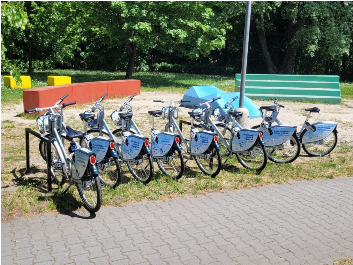
Obrázek 9: Bikesharing v Jablonci nad Nisou