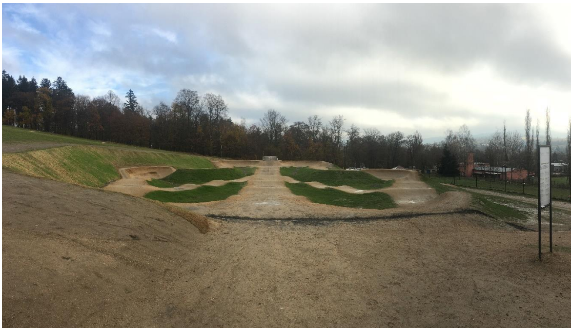
Obrázek 6: Pumptrack ve Vratislavicích nad Nisou

Další velký asfaltový pumptrack byl vystaven v blízkosti lanovky na Tanvaldský Špičák v roce 2021. Za těmito dvěma projekty stojí firma Dirty Parks, kterou založil mistr ČR v BMX dirtjumpu Tomáš Kudrnáč. Menší pumptrack se nachází také u Singltrek Centra v Novém Městě pod Smrkem (České Bikeparky 2023; MTB Czech 2023; Dirty Parks 2023).