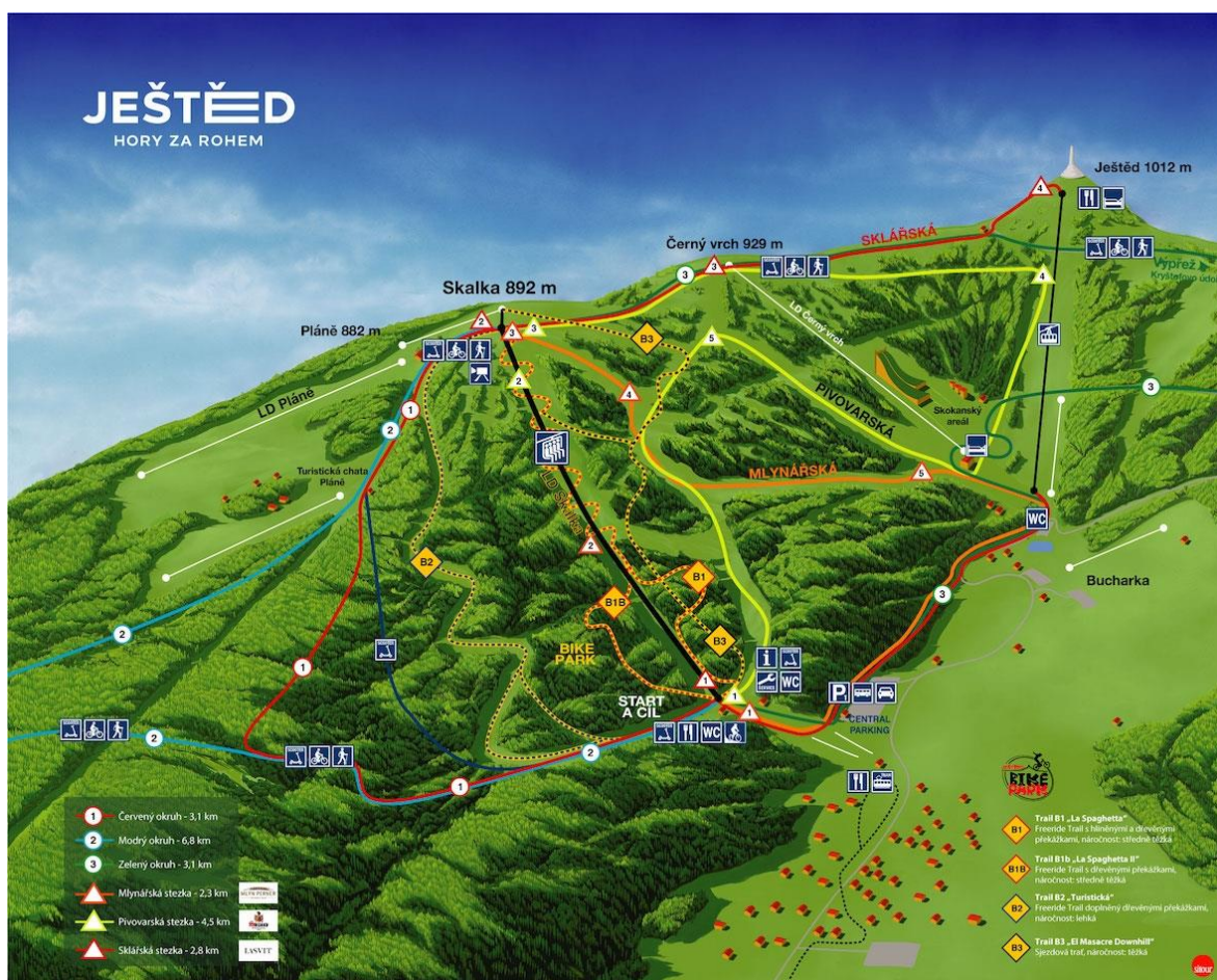
Obrázek 5: Bikepark Ještěd

Ve známém lyžařském areálu na Ještědu se nachází tři trailové sjezdy. Na začátek všech sjezdů se dá dostat lanovkou Skalka. Většina tras je vybudovaná spíše pro zručnější cyklisty. Pro začátečníky existuje trasa Trail B2 Turistická, která kombinuje širší lesní cestu, podél které jsou vytvořené zatáčky, boule a malé skoky. Tato trasa byla vytvořena pro vyzkoušení trailových prvků. Středně těžká trasa se nazývá Trail B1 La Spaghetta a vede přímo pod lanovkou Skalka. Zhruba v polovině sjezdu se dá odpojit na Trail B1b. Trať Trail B1 nabízí vše, co si freeridový jezdec může přát. Jsou na ní postavené skoky, klopenky a dřevěné a hliněné překážky. Náročným terénem po kořenech a kamenech vede technická sjezdová černá trať Trail B3 El Masacre Downhill. Bikepark je zpoplatněn jízdou na lanovku, která funguje jako vstupenka na tratě. Provozní doba parku je omezena na provozní dobu lanovky. Tratě Bikeparku Ještěd jsou k vidění na obrázku č. 5 níže.