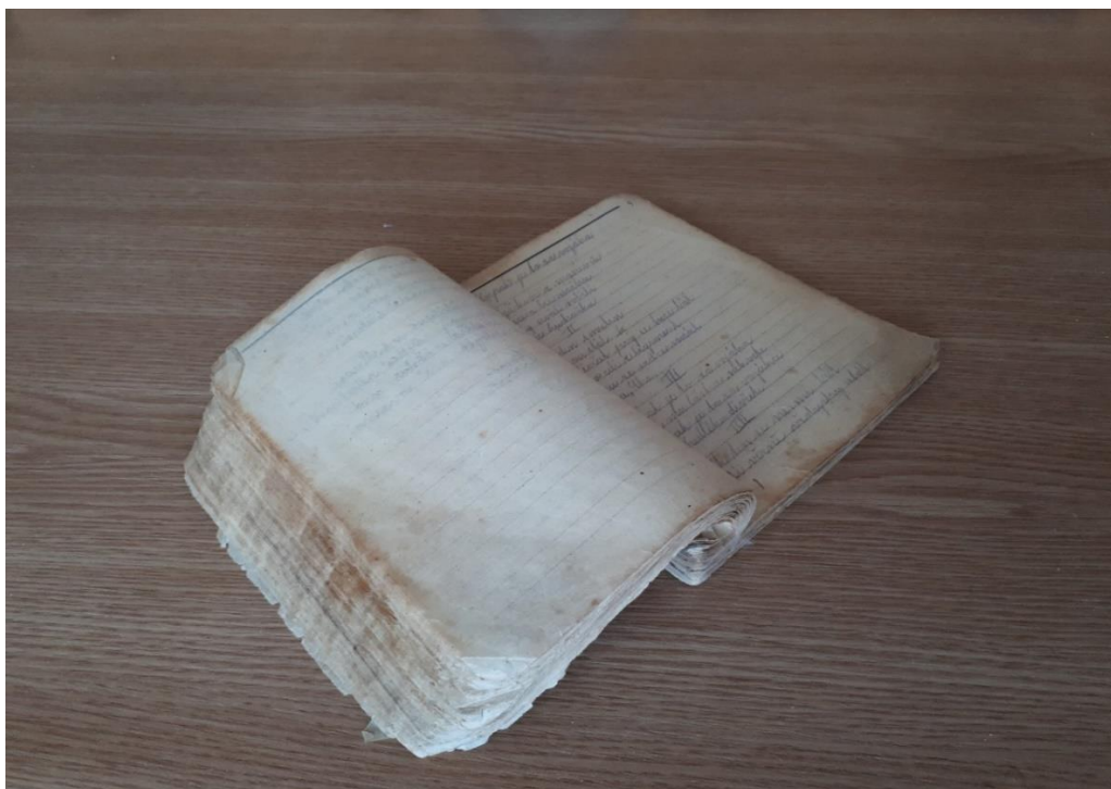
Obrázek 5. Deník chlapce narozeného v roce 1970