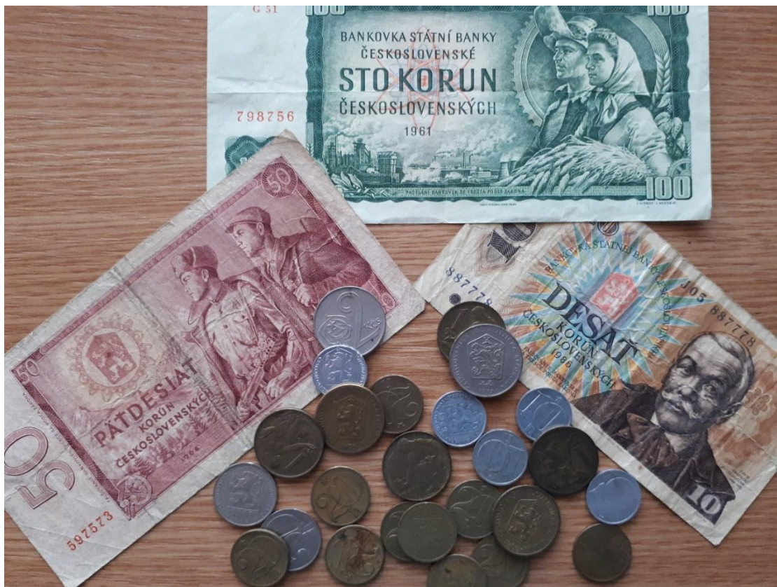
Obrázek 11. Československé bankovky a mince