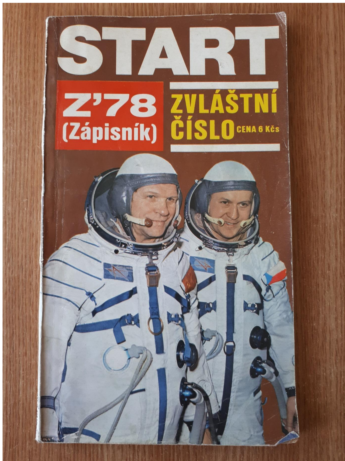
Obrázek 21. Zápisník Start