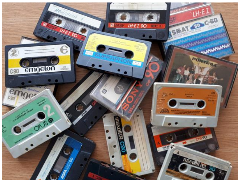
Obrázek 7. Kazety, které se používaly před rokem 1989