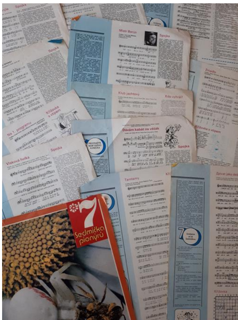
Obrázek 8. Časopis Sedmička pionýrů, ve kterém vycházely písně i noty