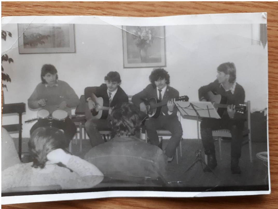
Obrázek 18. Školní hudební skupina (1986)