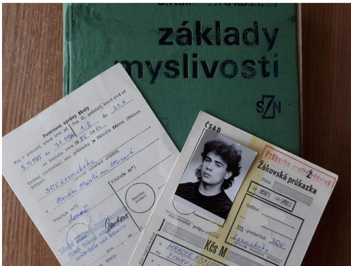
Obrázek 20. SOU lesnické