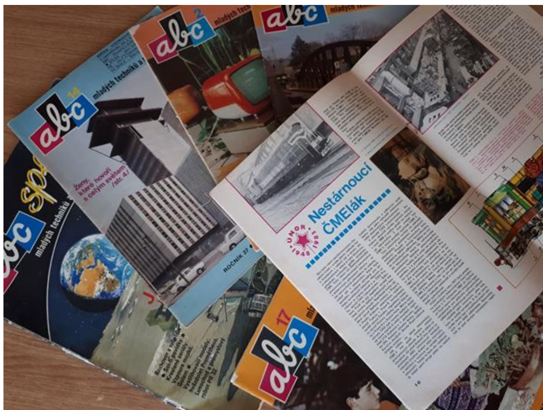
Obrázek 13. Legendární časopis ABC