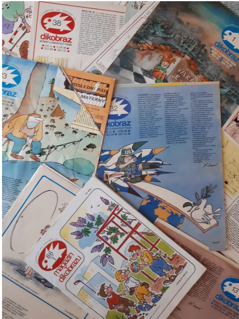
Obrázek 15. Nestárnoucí humoristický časopis