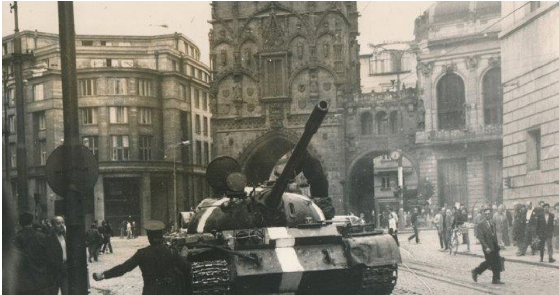
Obrázek 4. Praha 21. srpen 1968

O dvacet let starší, zkušenější a vyzrálejší Vladimír Merta se najednou veřejně staví čelem proti komunistickému režimu, odhazuje veškerou opatrnost a sděluje národu, že komunisté vraždili, vraždí a pokud se s tím něco neudělá, jsou odhodláni vraždit dál. Píseň byla jasným signálem pro všechny, že už je načase vystoupit ze svých ulit, překročit vlastní stín a zaujmout občanský postoj, který povede třeba i k revoluci. Ke cti dalších písničkářů musím uvést, že to nebyl ojedinělý počín, takových bylo mnohem více, ale na příkladu Vladimíra Mertu je ta proměna nejvýraznější.