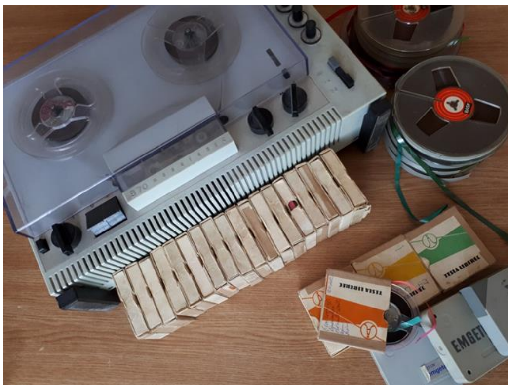
Obrázek 6. Magnetofon a kotouče s nahrávkami