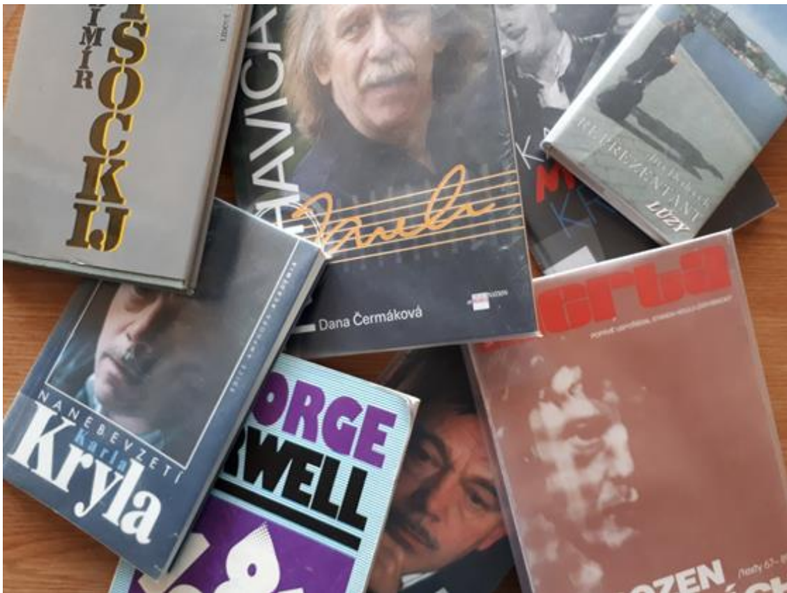
Obrázek 10. Knihy