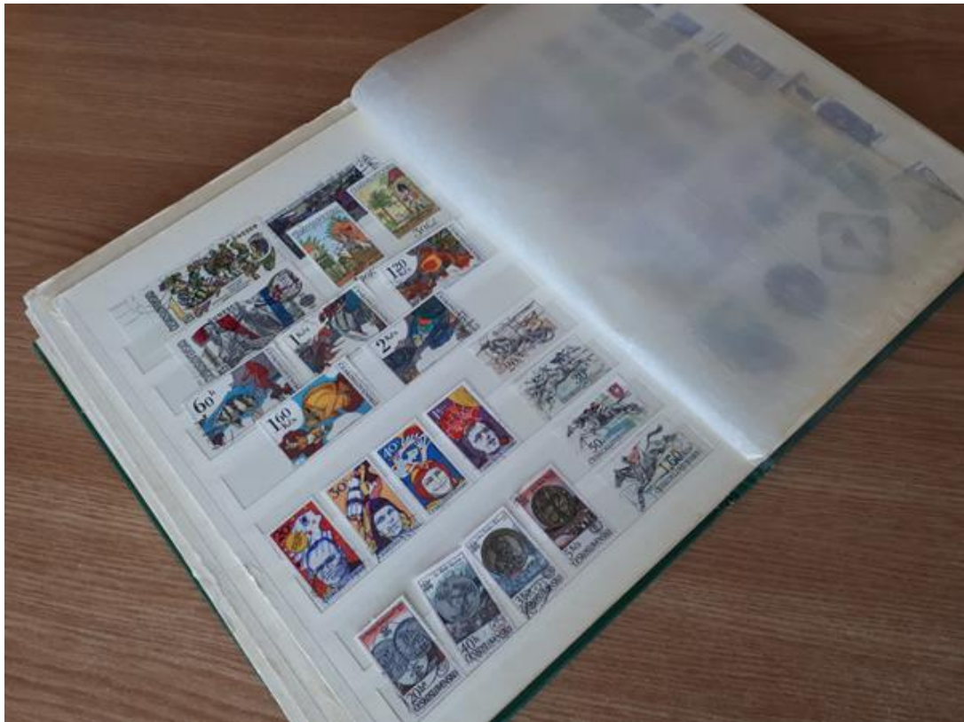
Obrázek 17. Album poštovních známek, které mnozí sbírali a měnili