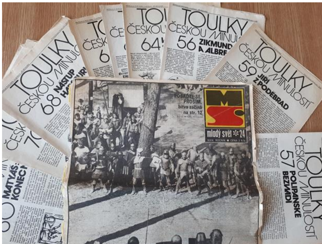
Obrázek 12. Velice oblíbený časopis pro mladá