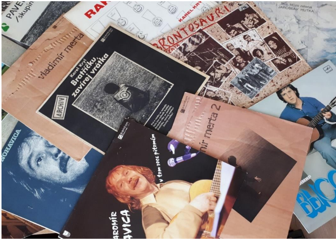
Obrázek 9. Gramofonové desky písničkářů