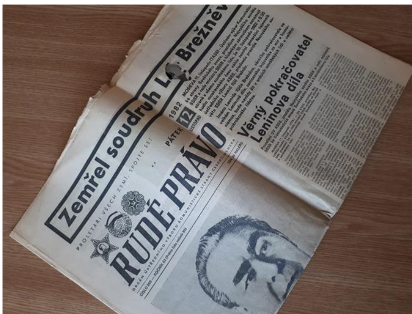
Obrázek 16. Nejrozšířenější denní tisk v Československu