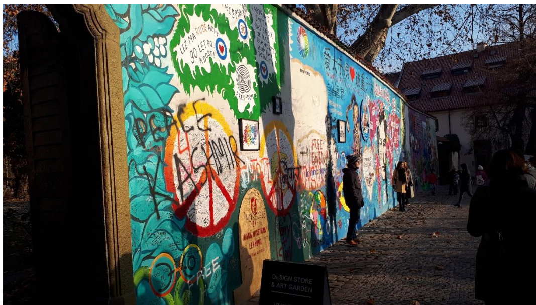
Obrázek 2. Lennon wall – pamětní místo (leden 2020)

Přestože se tam hrálo jen pár měsíců, stala se z toho masová záležitost. Dokonce až z Ostravy na most jezdil hrát začínající písničkář Pepa Streichl. S 21. srpnem to ale vše rychle skončilo. Přesto se na tuhle krátkou činnost ani po letech nezapomnělo a například v roce 1989 se každou středu a neděli pod sochami na mostě scházeli tremповé a hrálo se tam na kytaru a zpívali se písničky.