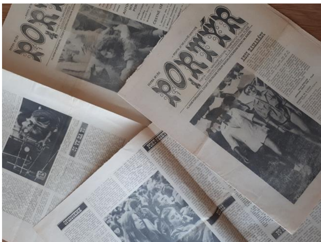
Obrázek 14. Časopisy, které se vydávaly na hudebním festivale Porta v roce 1988