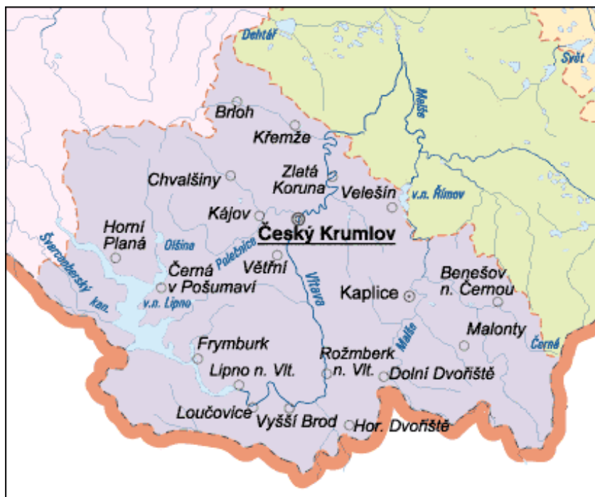
Obrázek 1: Mapa Českokrumlovského okresu

Pro vizuální znázornění Českokrumlovského okresu přiložena mapa (viz obrázek č.1).