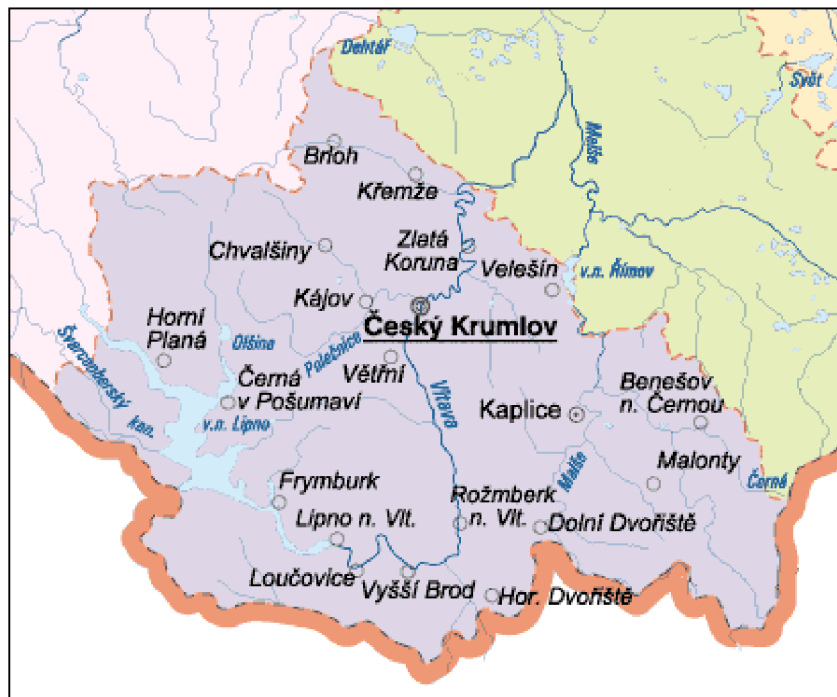
Obrázek 1: Mapa Českokrumlovského okresu

Pro vizuální znázornění Českokrumlovského okresu přiložena mapa (viz obrázek č.1).