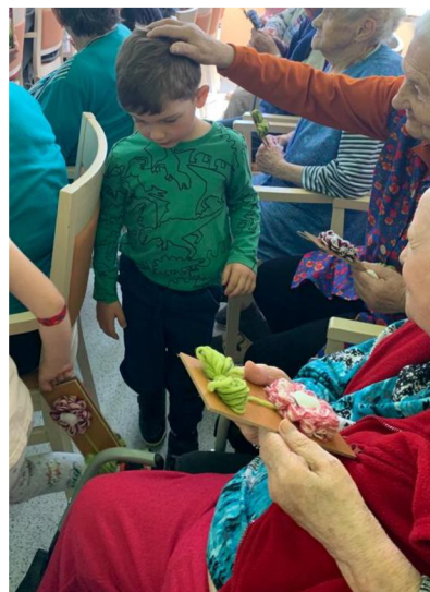
Obrázek 7: Předávání dárků