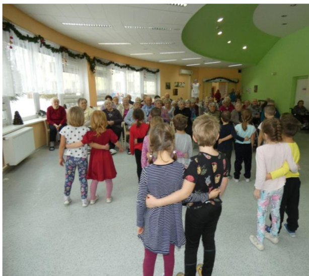
Obrázek 6: Vystoupení v domově pro seniory

V domově pro seniory nás čekalo spousta usměvavých tváří. Již při příchodu paní ředitelka avizovala, že plánované krátké posezení nebude možné, obávají se chřipky a covidu, tuto možnost jsem očekávala. Radost z vystoupení nám to nezkazilo a potěšili jsme nejen seniory, ale i jejich milé paní pečovatelky. Po vystoupení děti mohly roznést dárečky mezi seniory, toto letmé setkání bylo plné úsměvů a i pohlazení ze stran starších. Děti zase dostaly panenky, které šijí aktivnější senioři.