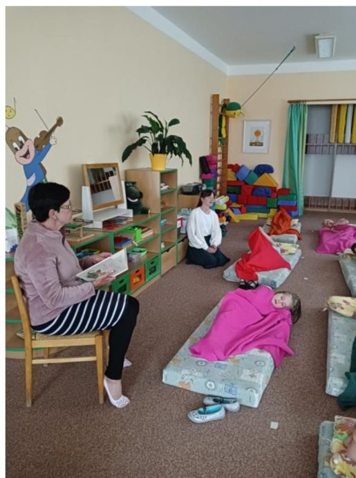
Obrázek 2: Čtení s prarodiči