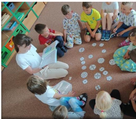
Obrázek 3: Čtení příběhů od dětí a prarodič Obrázek 4: Kniha pohádek dětí ze zelené

podpořily svou schopnost vypravování, výjimečně bylo zjevné, že tuto schopnost piloval jiný člen rodiny.