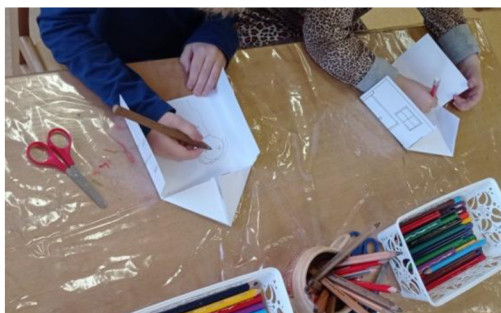
Obrázek 9: Kreslení rodiny