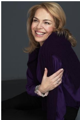
Dagmar Havlová (druhá manželka Václava Havla)

http://www.havlova-veskrnova.com/aktualita-detail.php/68