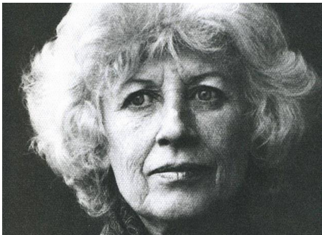
Olga Havlová (první manželka Václava Havla)

http://praha.idnes.cz/olga-havlova-ma-svou-ulici-dcg-/praha-zpravy.aspx?c=A120417_143128_praha-zpravy_ab