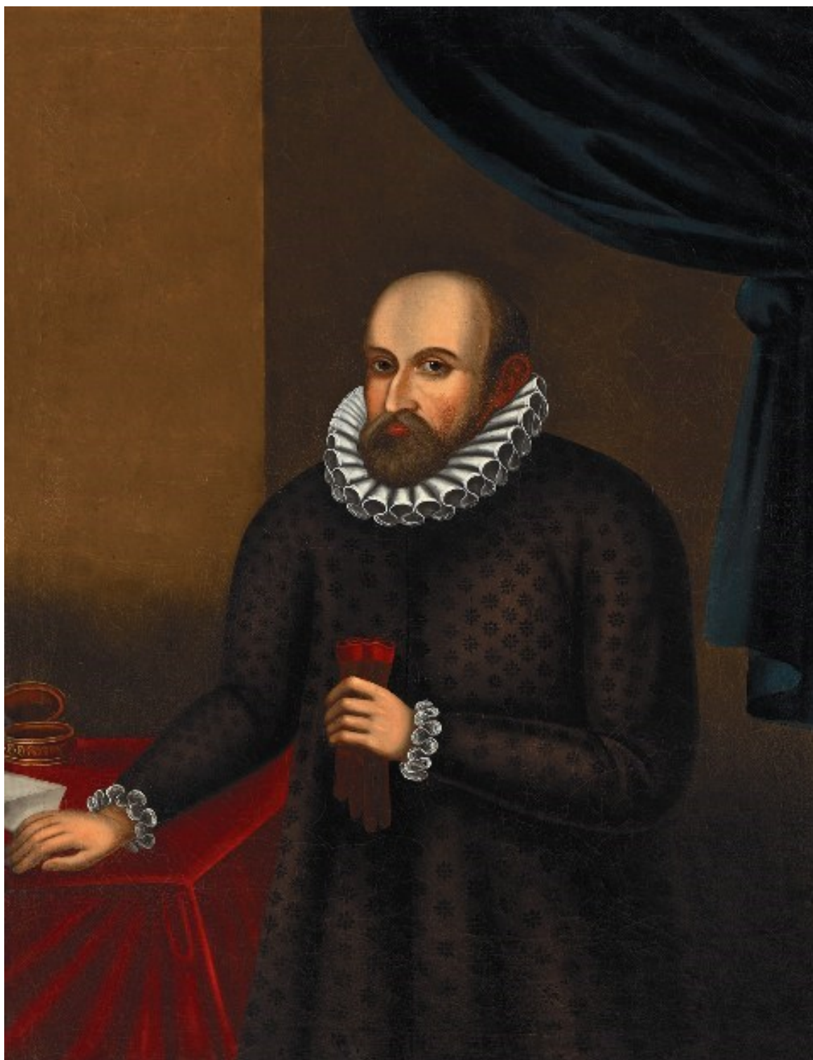
Obr. 1 Adam II. z Hradce