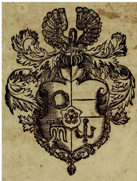
Obrázek 2 - Hradecký erb použitý v básni

Na straně druhé je vyobrazení erbu rodu pánů z Hradce provedené jako rytina. Nad a pod erbem Mitis básnickým jazykem stručně popsal symboly, které se na něm nacházejí. Nazývá je jako vybrané hrdinské znaky, jimiž je obohacen vznešený nový dům. Zároveň představují znamení síly, které v různých bojích proslavili předkové. „Květiny, věnce a růže označují pozemské bitvy svedené na polích, kotva bitvy, které se