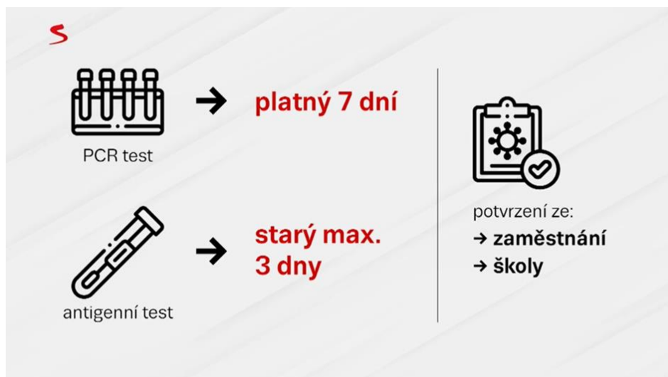
Obrázek 2: Informace o pravidlech vstupu do provozoven. Podmínkou byl buď maximálně týden starý PCR test, nebo maximálně 3 dny starý antigenní test, případně potvrzení se zaměstnání nebo školy o negativním výsledku provedeného antigenního testu na přítomnost viru Sars-CoV-2.