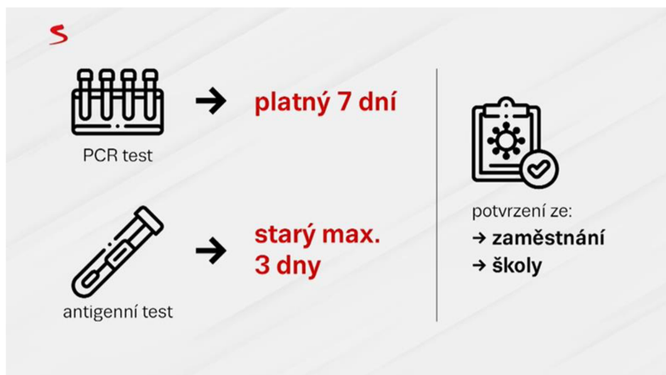
Obrázek 2: Informace o pravidlech vstupu do provozoven. Podmínkou byl buď maximálně týden starý PCR test, nebo maximálně 3 dny starý antigenní test, případně potvrzení se zaměstnání nebo školy o negativním výsledku provedeného antigenního testu na přítomnost viru Sars-CoV-2.