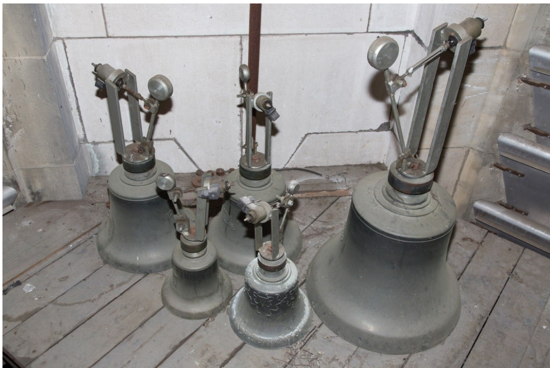
Obrázek č. 13.

Pět ze šestnácti zvonů katedrální zvonkohry.