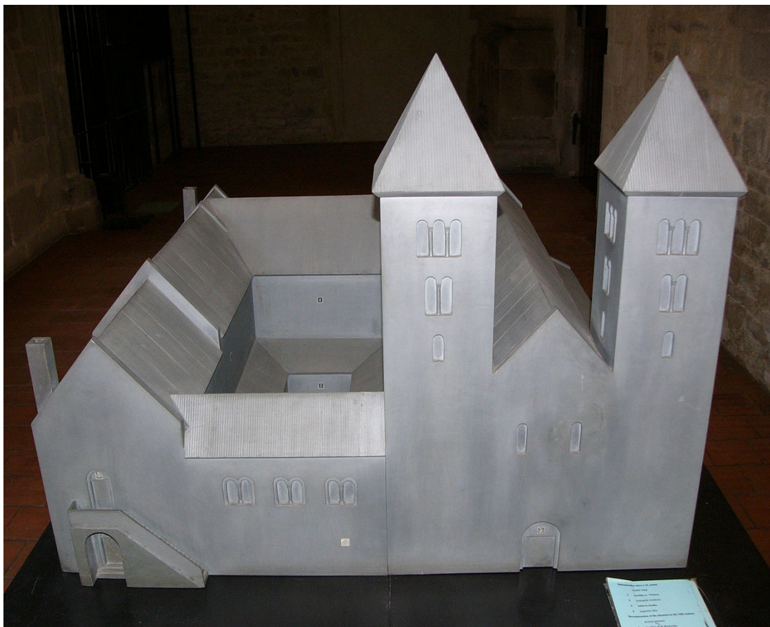
Obrázek č. 2.

Model Zdikova paláce s katedrálou sv. Václava (2. pol. 12. století)