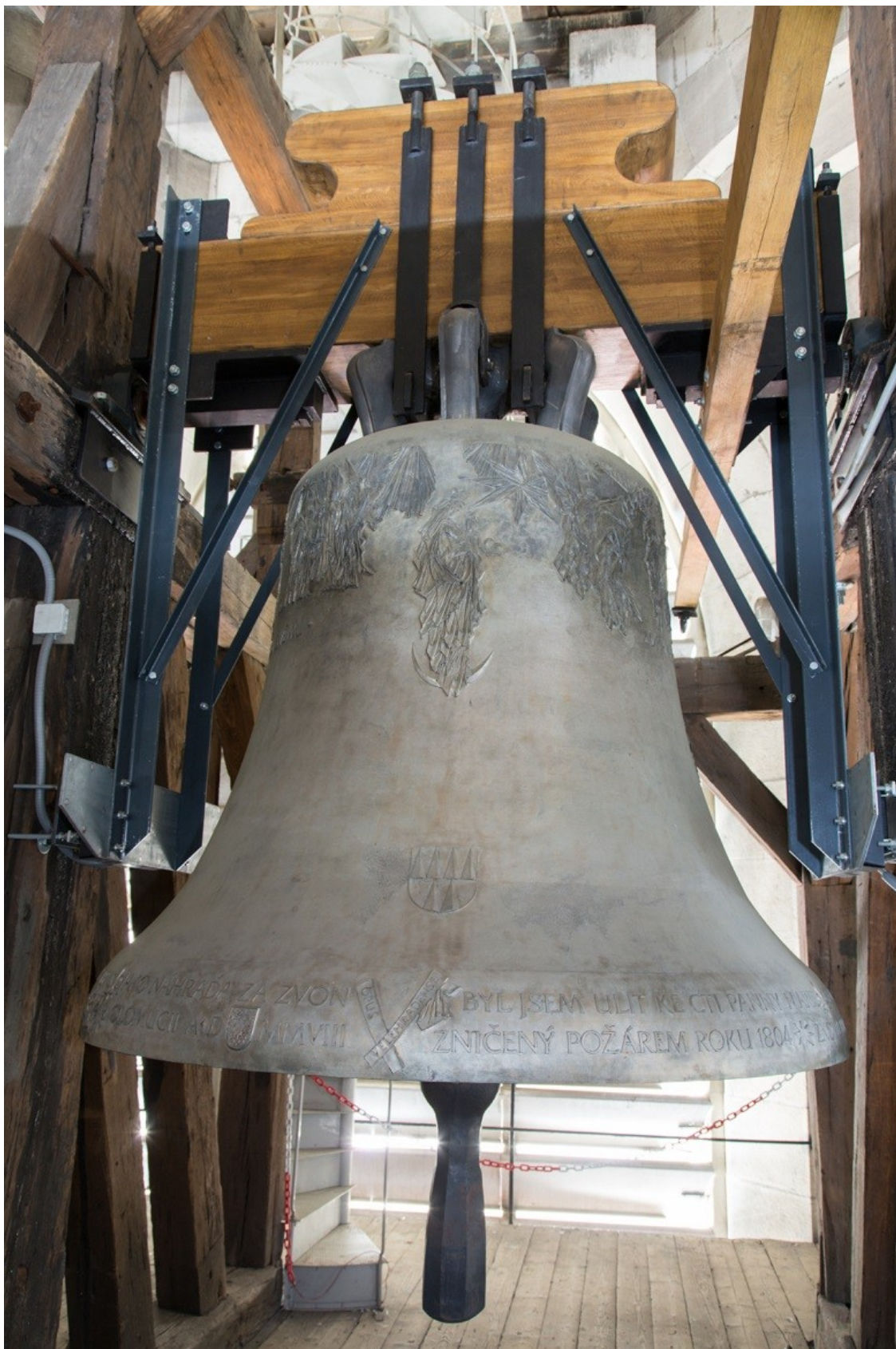
Obrázek č. 14.

Zvon Panna Marie Svatohostýnská.