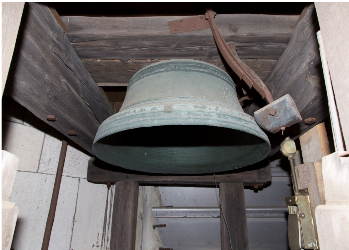
Obrázek č. 4.

Cymbál z roku 1804 se starým a novým kladívkem.