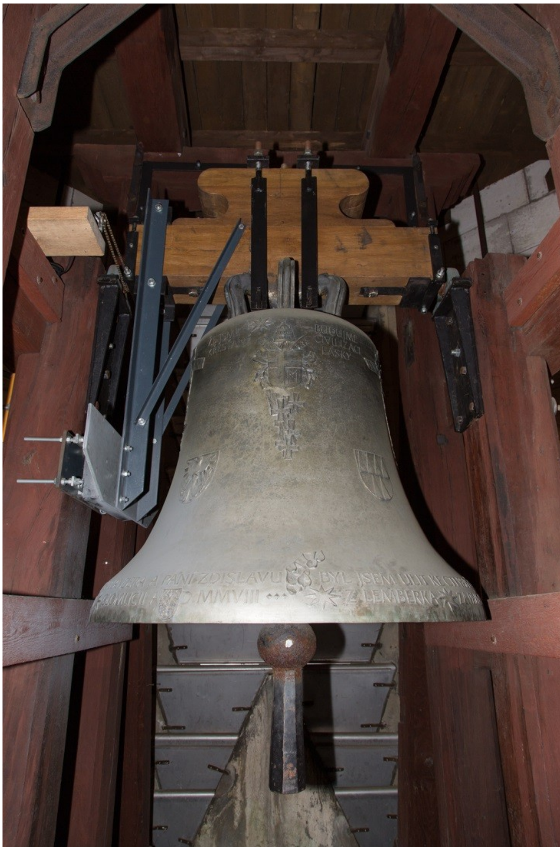
Obrázek č. 15.

Zvon Jan Pavel II..