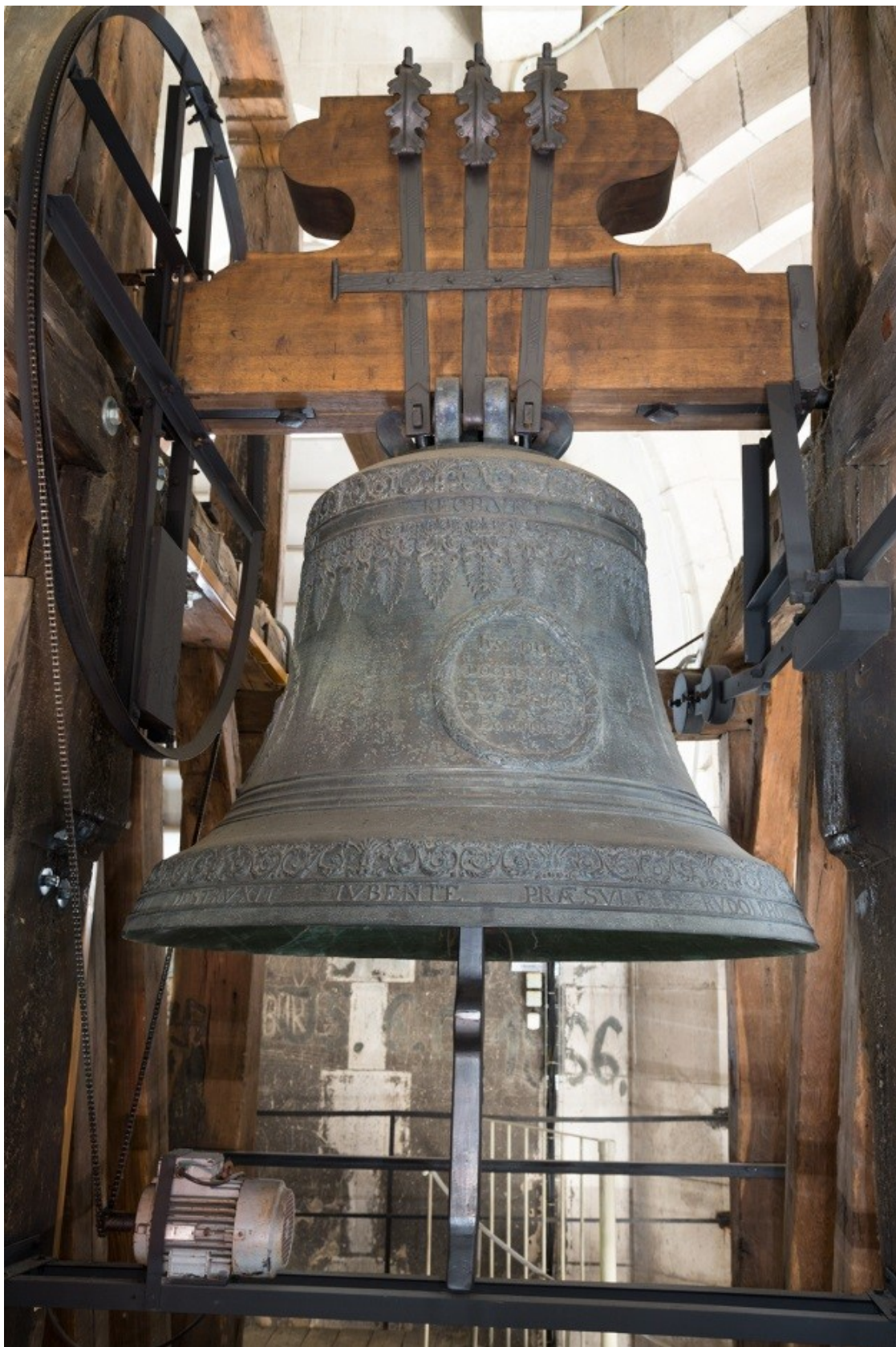
Obrázek č. 9.

Zvon sv. Petr a Pavel.