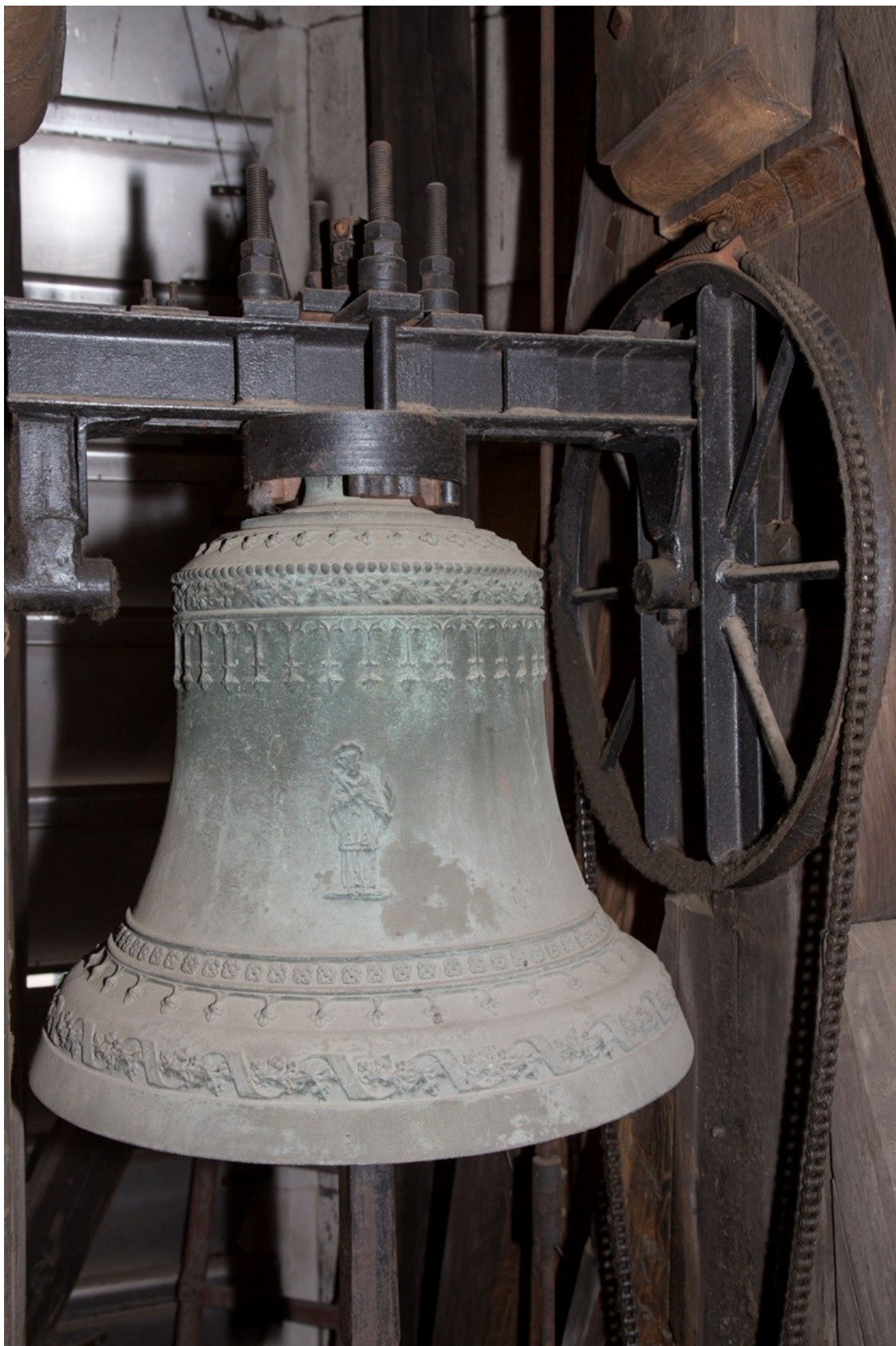
Obrázek č. 10.

Zvon sv. Jan Nepomucký.