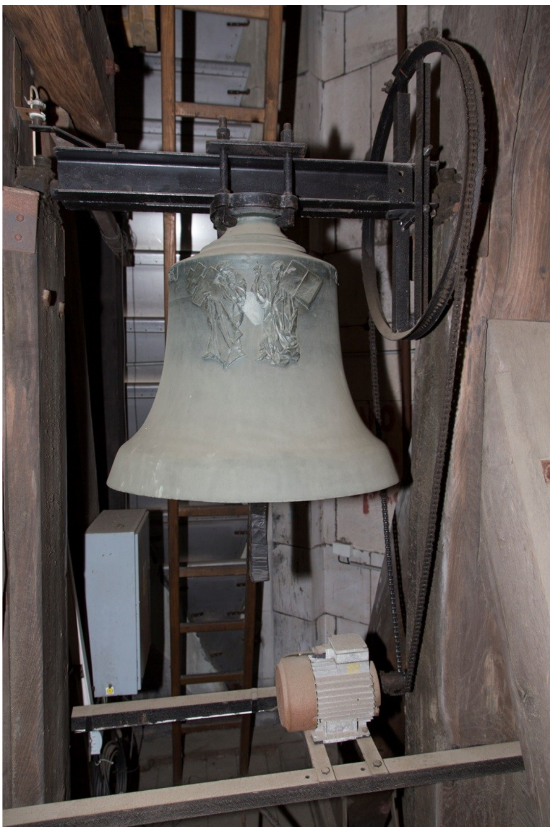
Obrázek č. 12.

Zvon sv. Cyril a Metoděj.