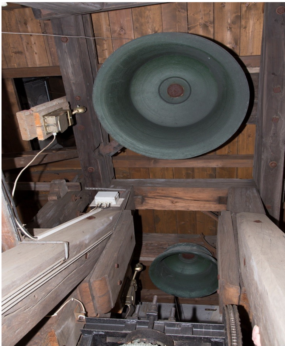
Obrázek č. 5.

Dva cymbály z roku 1804, menší odbíjí čtvrtky, větší celé hodiny.