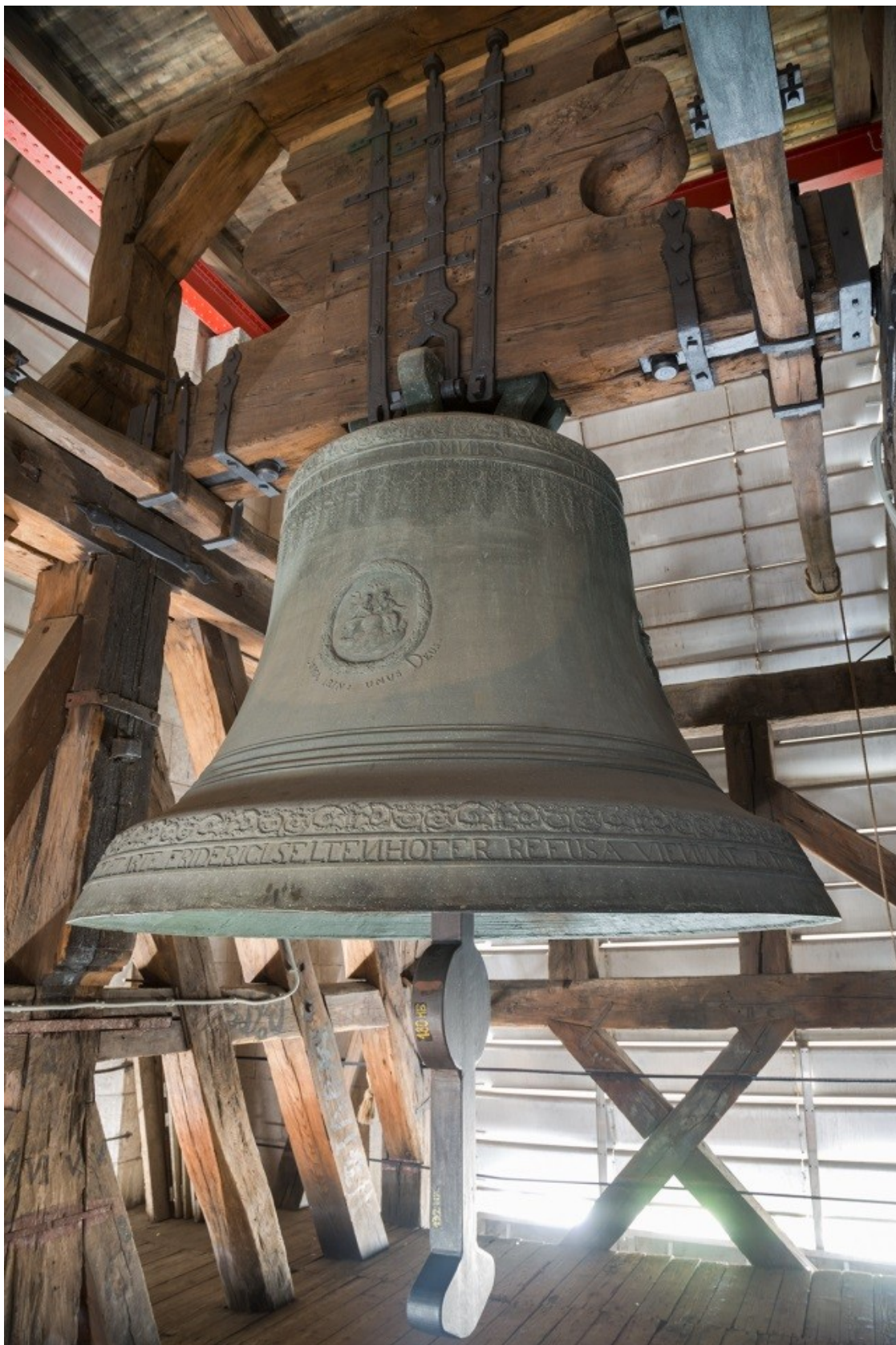
Obrázek č. 8.

Zvon Nejsvětější Trojice.