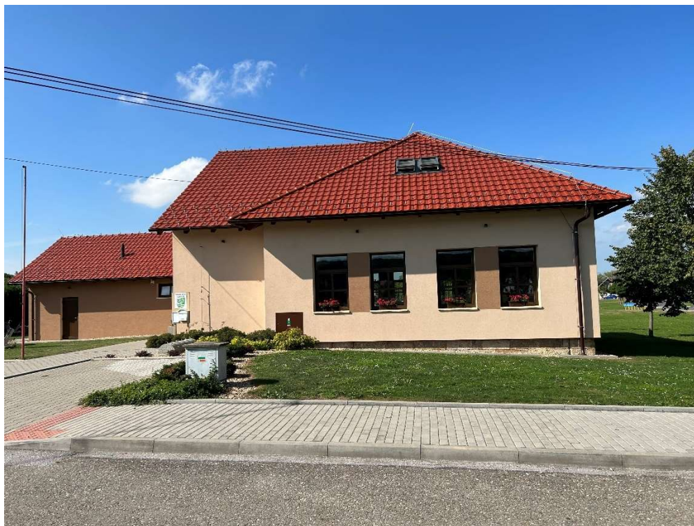
Obrázek 4 Bývalá škola, nyní obecní dům