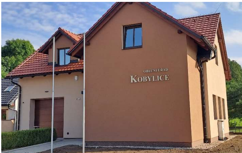
Obrázek 2 Obecní úřad Kobylice