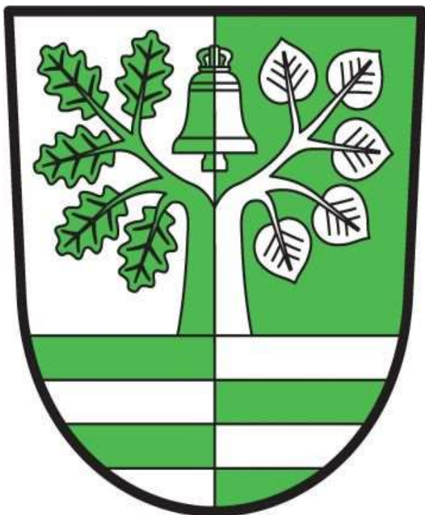
Obrázek 1 Znak obce