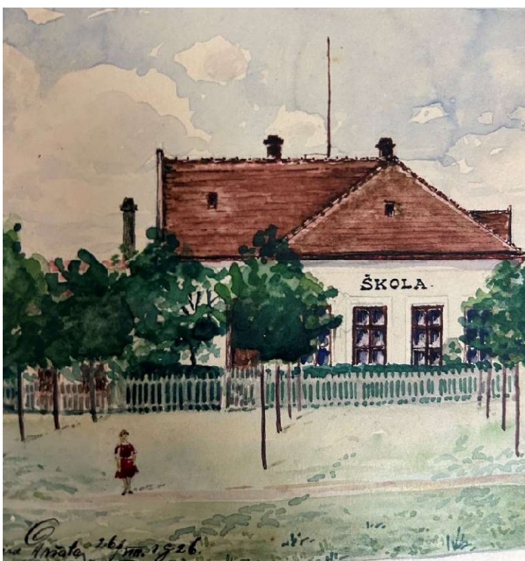
Obrázek 3 Škola v roce 1926