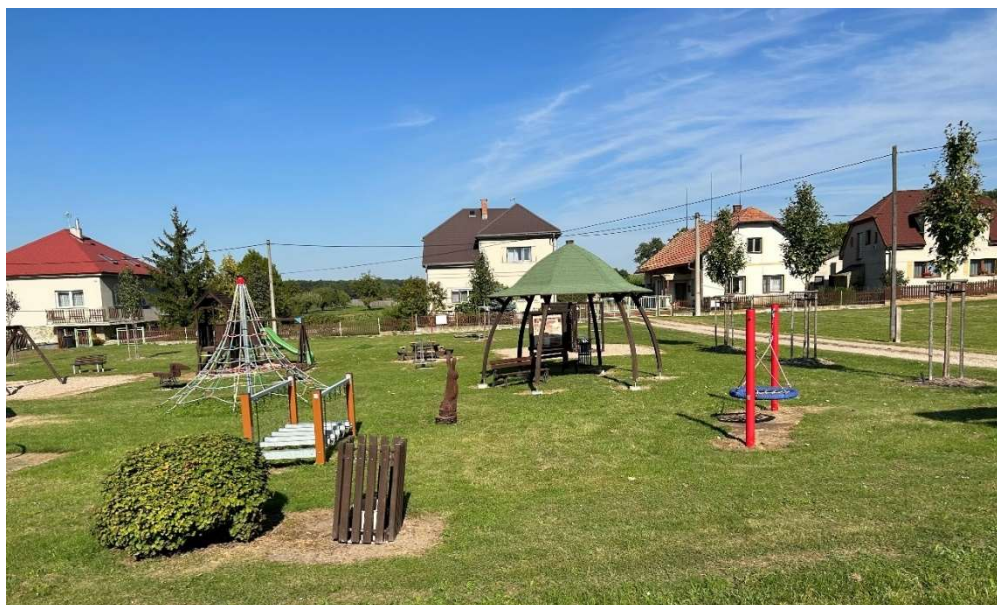
Obrázek 5 Dětské hřiště