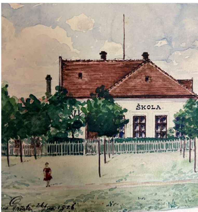
Obrázek 3 Škola v roce 1926