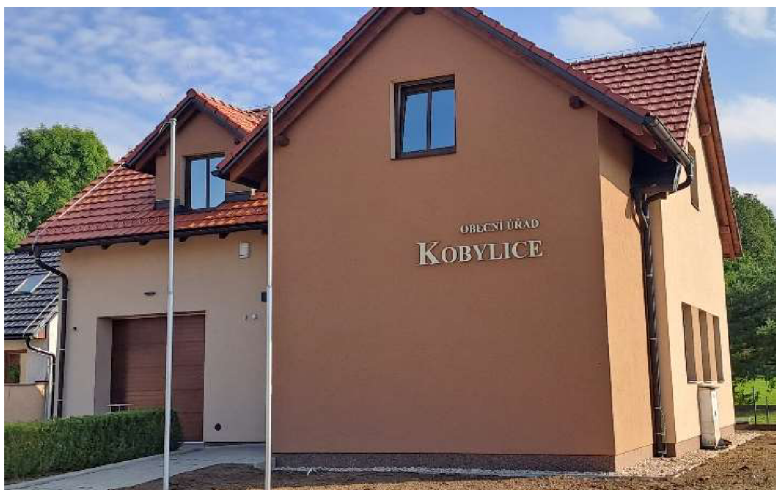
Obrázek 2 Obecní úřad Kobylice