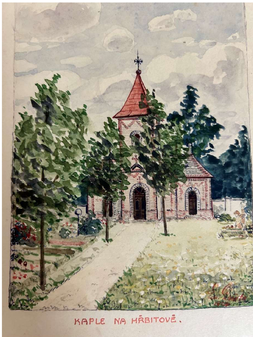
KAPLE NA HŘBITOVĚ.