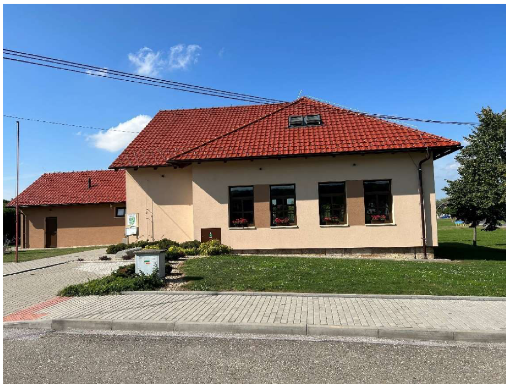
Obrázek 4 Bývalá škola, nyní obecní dům