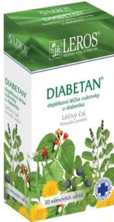
Obr. 24: Leros Diabetan (Dr. Max online, 12. 2. 2024)