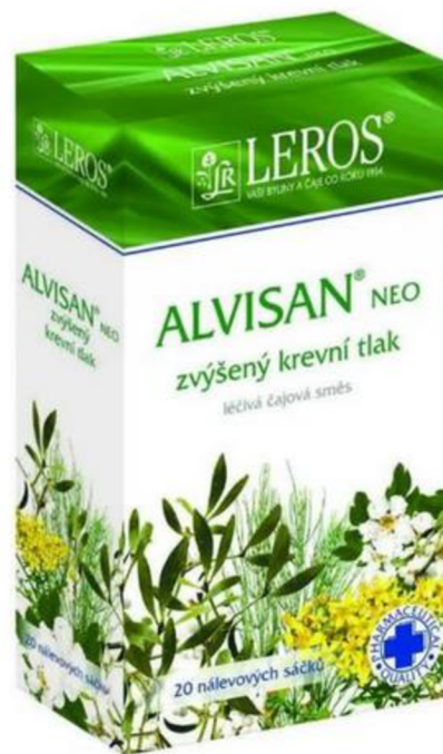
Obr. 6: Leros Alvisan Neo (Chytrá lékárna online, 7. 2. 2024)