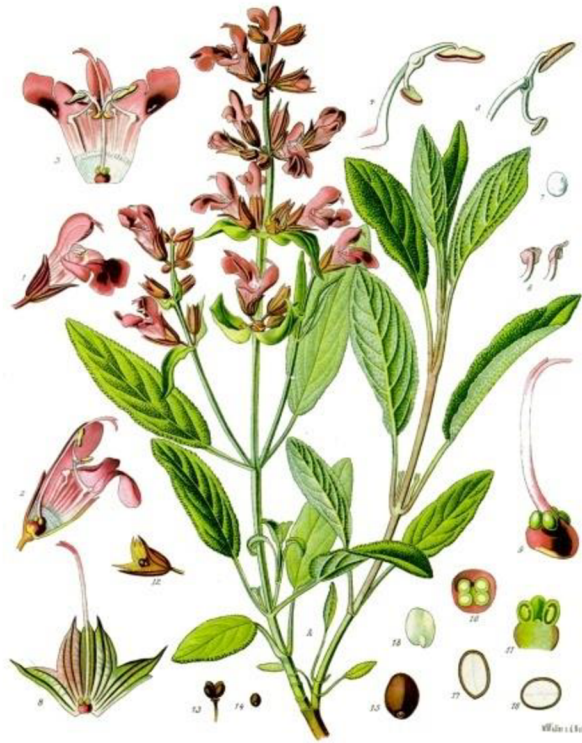
Obr. 23: Šalvěj lékařská