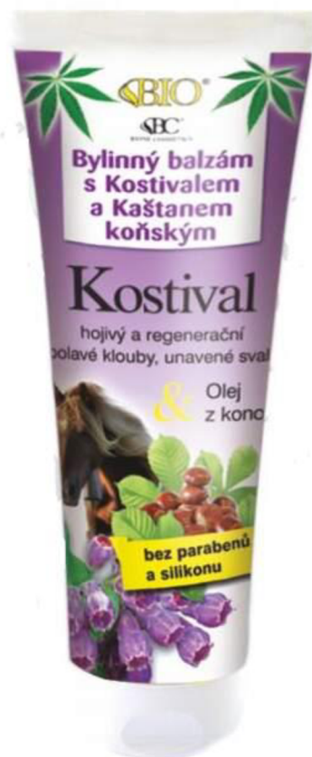
Obr. 12: Bylinkový balzám (Benu online, 10. 2. 2024)