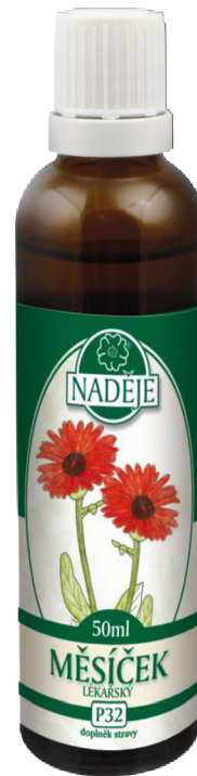
Obr. 22: Měsíček lékařský – tinktura