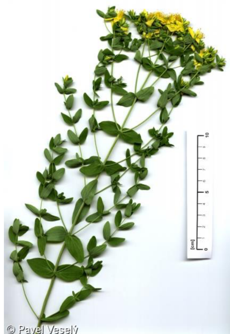
Obr. 25: Hypericum perforatum (Pladias online, 12. 2. 2024)