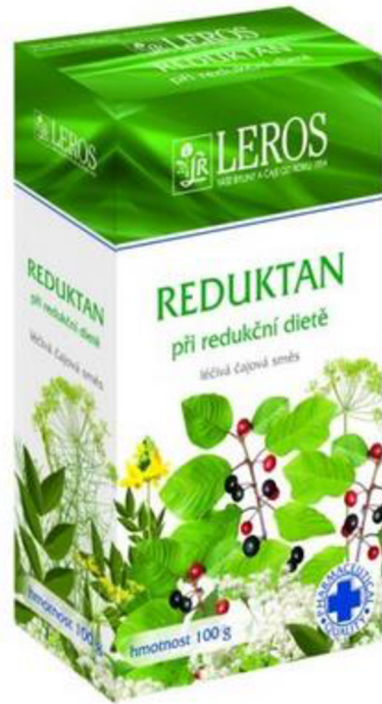
Obr. 14: Leros Reduktan (Benu online, 10. 2. 2024)