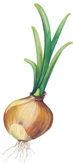
Obr. 1: Cibule kuchyňská