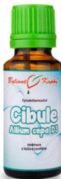
Obr. 2: Cibule D3