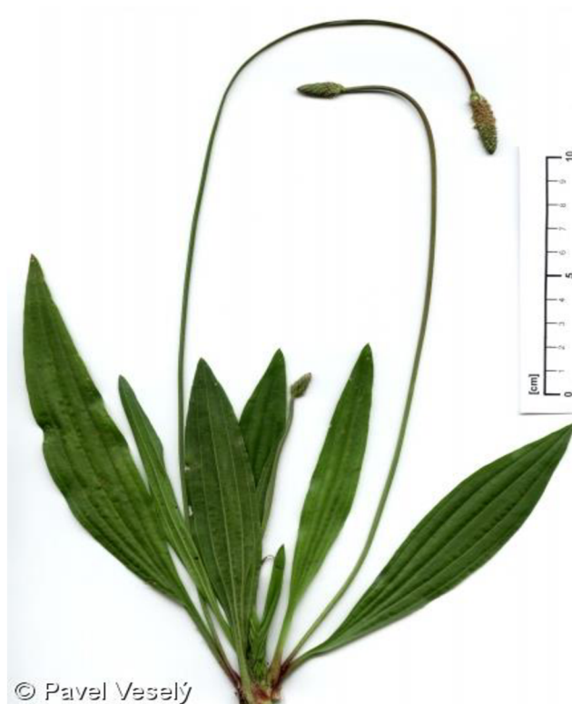
Obr. 9: Plantago lanceolata (Pladius online, 9. 2. 2024)