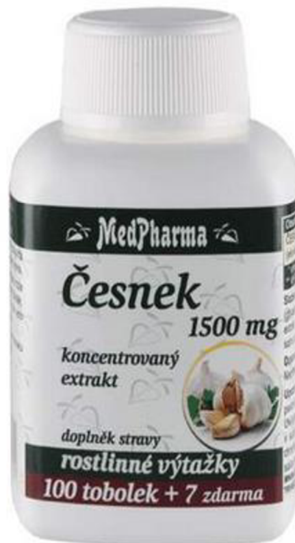
Obr. 4: MedPharma Česnek 1500mg tob.107 (Benu online, 6.2.2024)