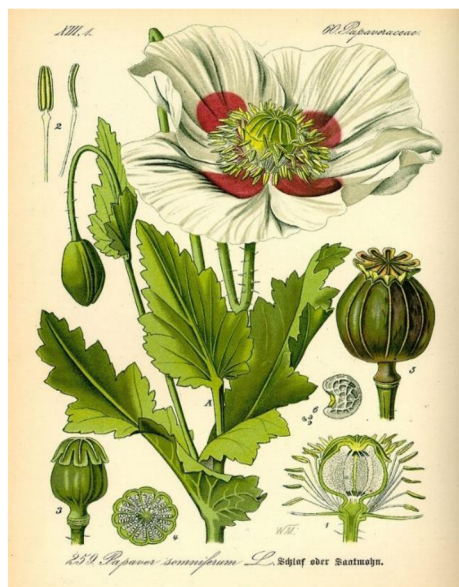
Obr. 15: Mák setý