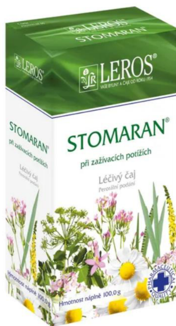
Obr. 26: Leros STOMARAN 100 g (Dr. Max online, 12. 2. 2024)