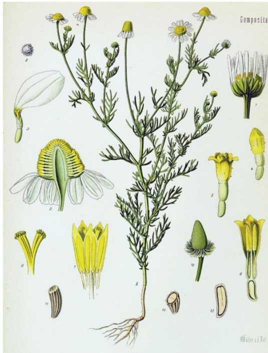
Obr. 5: Heřmánek pravý (Wikipedie online, 7. 2. 2024)