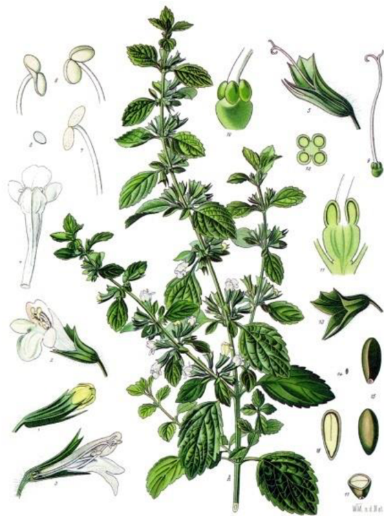
Obr. 19: Meduňka lékařská