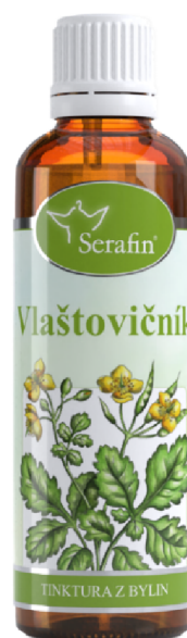
Obr. 28: Vlaštovičník – tinktura z bylin