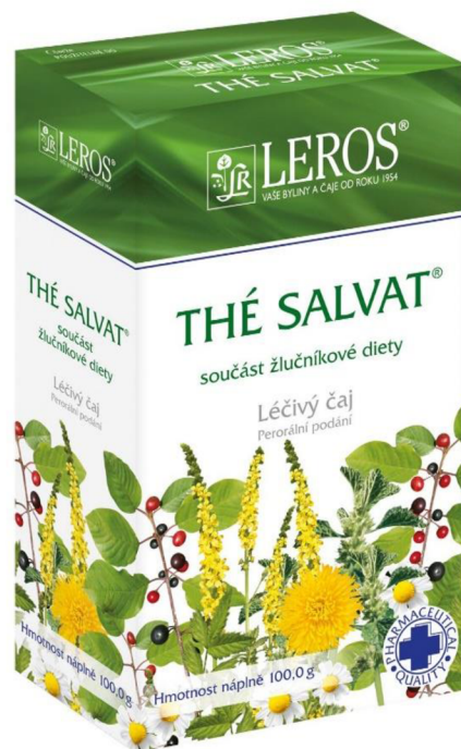
Obr. 10: Thé Salvat (Dr. Max online, 9. 2. 2024)