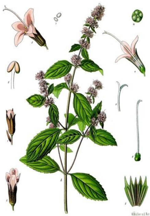
Obr. 17: Máta peprná