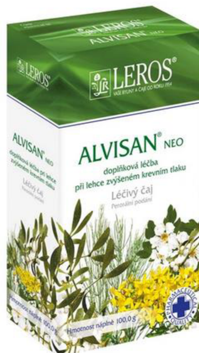
Obr. 18: Leros Alvisan Neo 100 g (Dr. Max online, 11. 2. 2024)