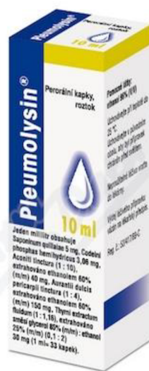
Obr. 16: Pleumolysin (Lékárna Bella online, 11. 2. 2024)