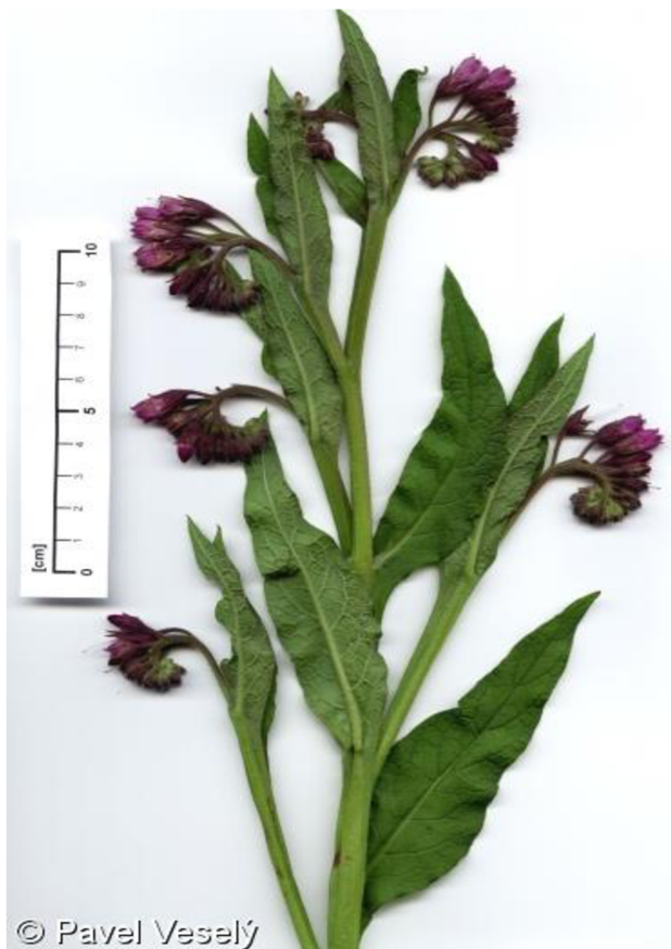
Obr. 11: Symphytum officinale