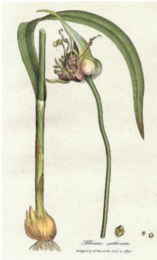
Obr. 3: Česnek kuchyňský

Léčiva: Z rostliny se vyrábí česnekové tablety.