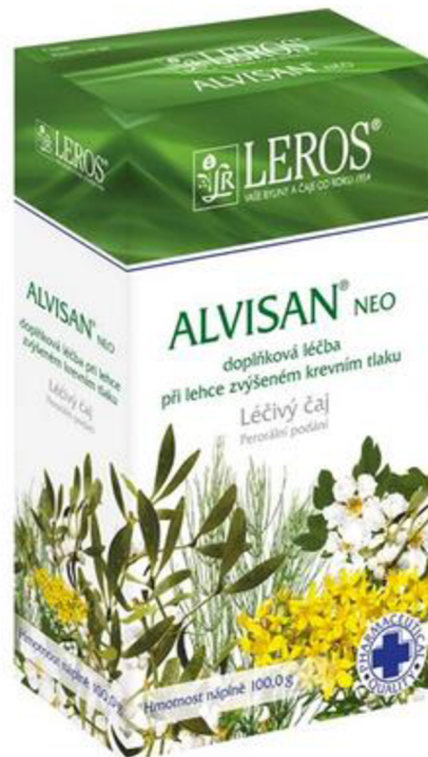
Obr. 20: Leros Alvisan Neo 100 g (Dr. Max online, 12. 2. 2024)