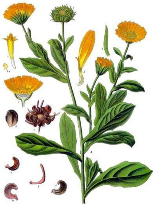
Obr. 21: Měsíček lékařský