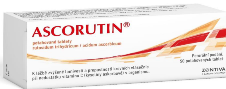
Obr. 8: Ascorutin 50 tablet (Dr. Max online, 8. 2. 2024)