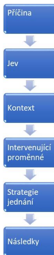
Obrázek č. 5. Konceptuální model