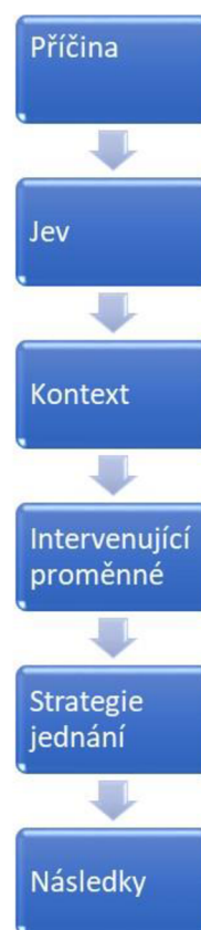
Obrázek č. 5. Konceptuální model