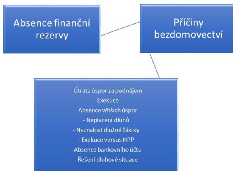
Obrázek č. 4: Diagram s kódy