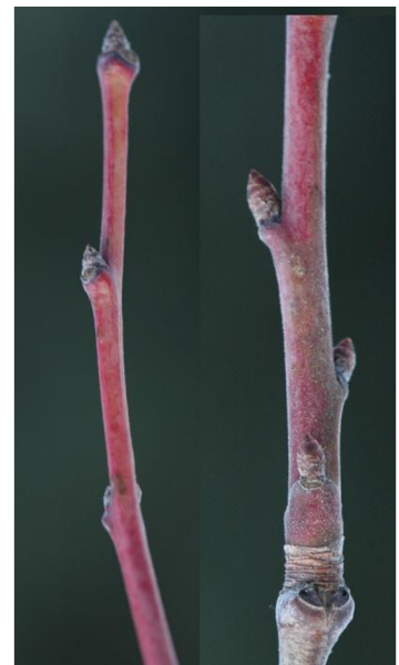
Obr. 5: Slivoň švestka