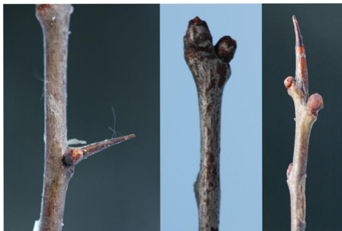
Obr. 1: Hloh jednosmenný