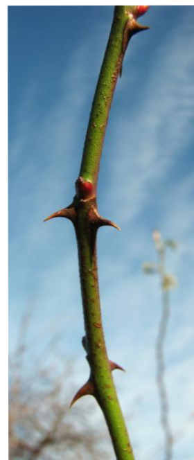
Obr. 4: Růže šípková