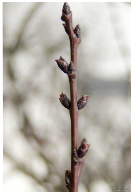
Obr. 3: Meruňka obecná