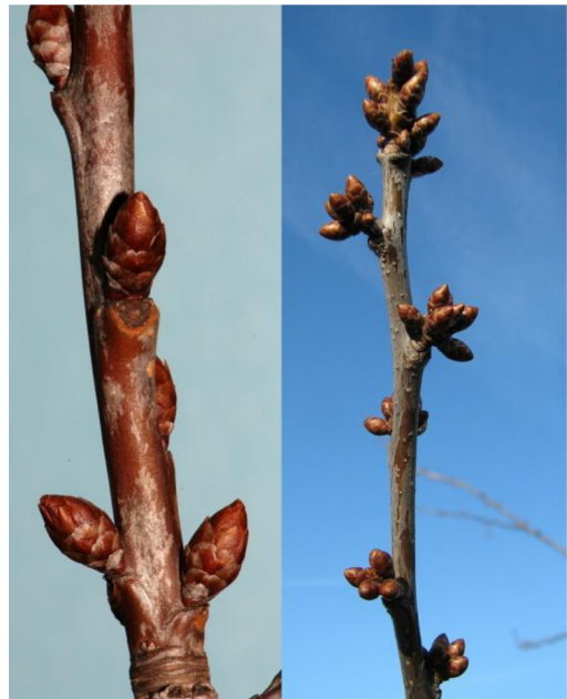
Obr. 6: Třešeň ptačí