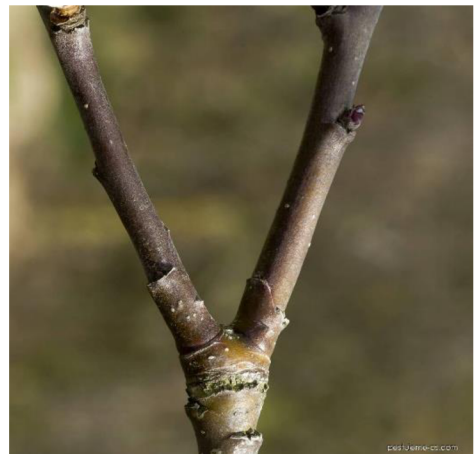
Obr. 2: Jabloň domácí