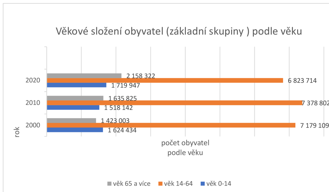
Graf č. 2 Věkové složení obyvatel (základní skupiny) rok 2000, 2010, 2020