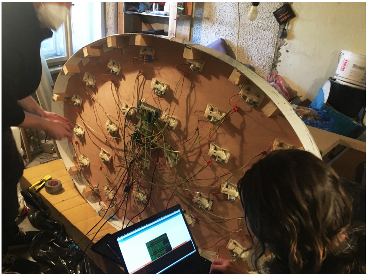
Pohled na 1. Instalaci, zadní část– překližka, epoxid, mechanické ryby, 2x1,25m