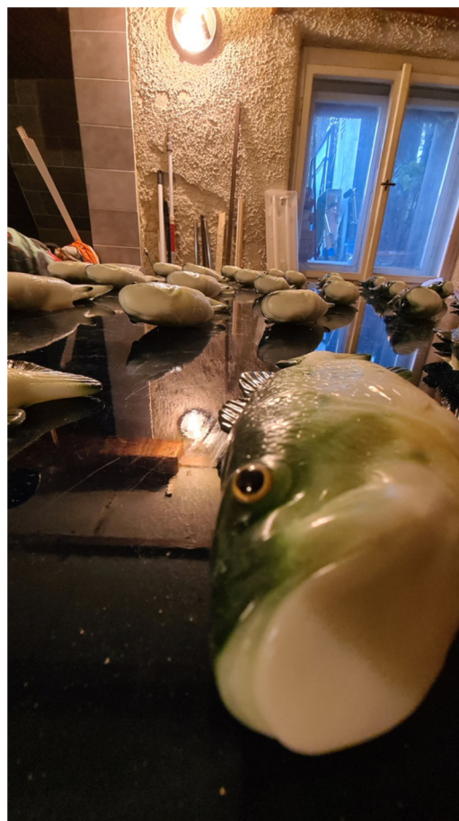
Pohled na 1. Instalaci, detail– překližka, epoxid, mechanické ryby, 2x1,25m