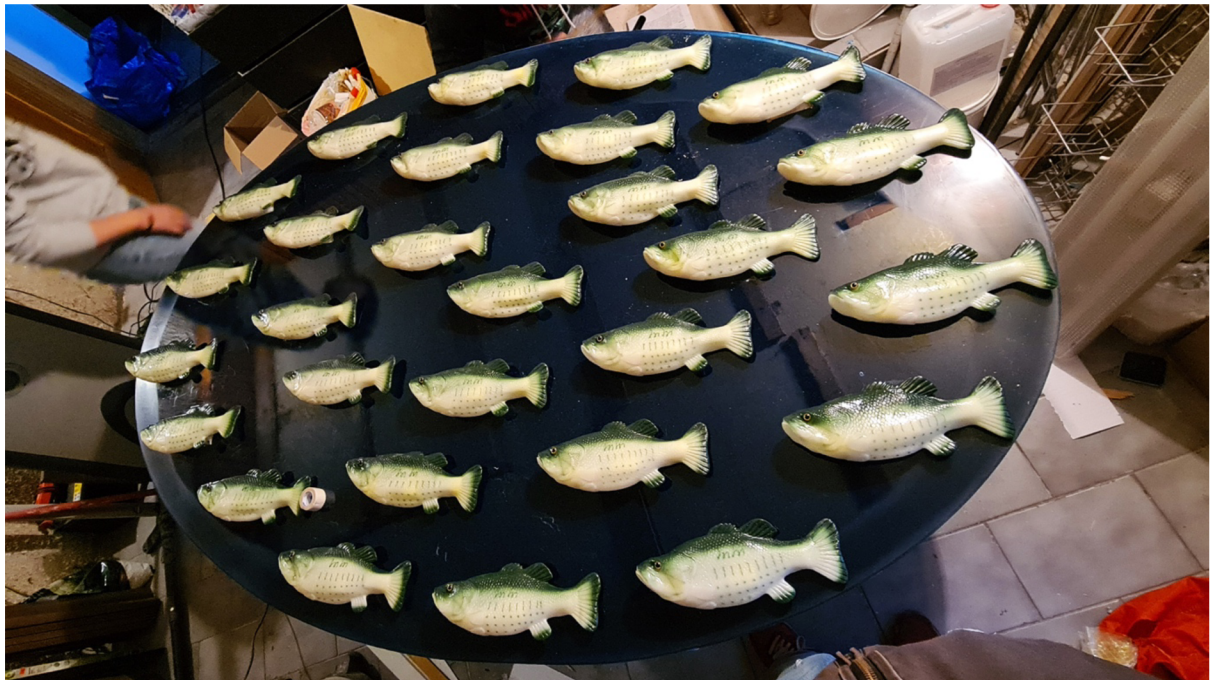
Pohled na 1. Instalaci – překližka, epoxid, mechanické ryby, 2x1,25m