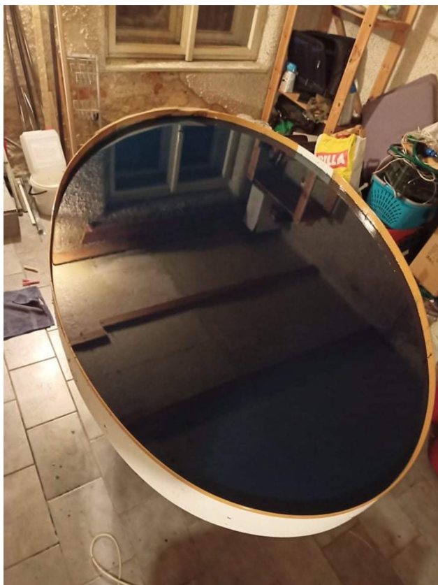
Pohled na 1. Instalaci, proces výroby– překližka, epoxid, 2x1,25m