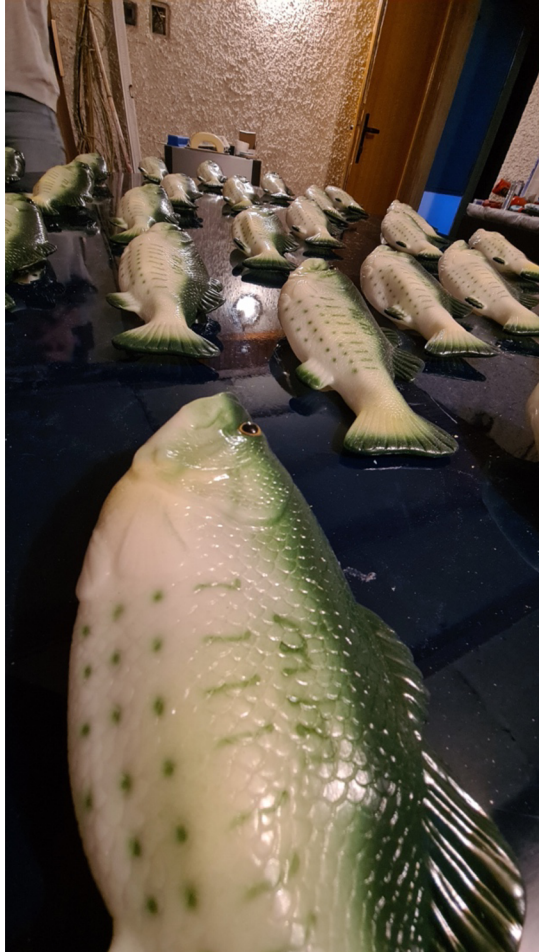
Pohled na 1. Instalaci, detail– překližka, epoxid, mechanické ryby, 2x1,25m