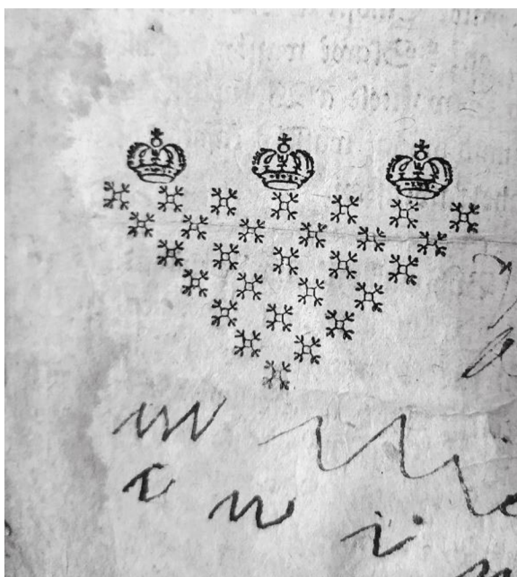
obrázek č. 2

kříž s paprsky na přední části vazby bible hallské, Mz 2167