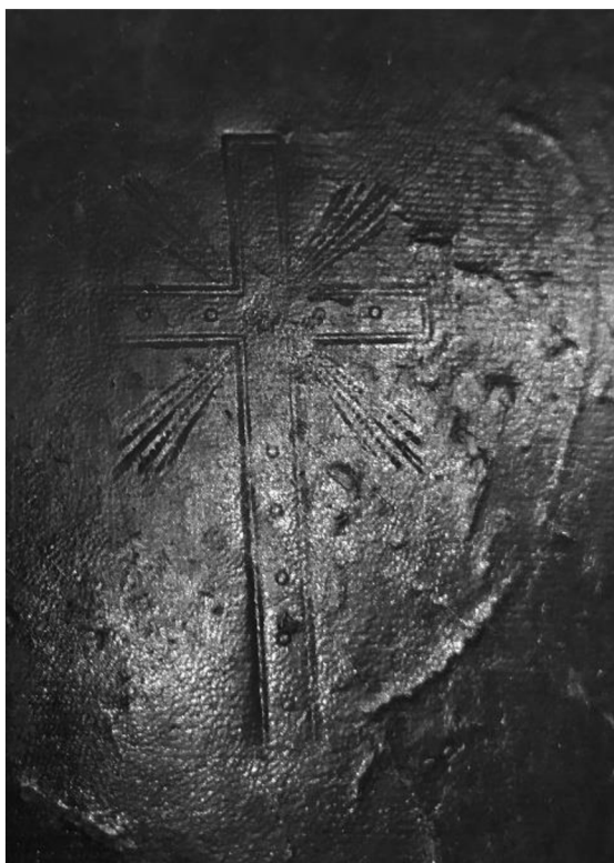
obrázek č. 1

kříž s paprsky na přední části vazby bible hallské, Mz 2167