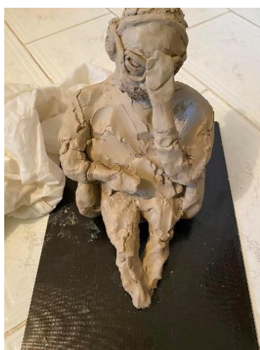
Obr. 12 Malý model babičky

Druhý malý model, který jsem vytvořila, je zobrazen v postoji, kdy si babička podepírá čelo rukou a její pohled směřuje k zemi. Tady už jsem nedbala tolik na podobu v obličejí, protože má část obličejí zakryt dlaní. Snažila jsem se opět zobrazit postoj a výraz zamyšlení. Invalidní vozík jsem zjednodušila tak, že ze začátku vypadal jako lavička s koly. Poté jsem na něj posadila model babičky. Sedadlo, na kterém model sedí se podlamoval tíhou figury, proto jsem ho musela zespodu pojistit kusem hlíny, aby postavu udržel. Tady jsem se inspirovala jiným autorem, a to Henry Moorem a jeho dílem Král a královna .