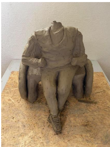
Obr. 22 Přidání horních končetin (bez dlaní)

Další část tvorby byla zaměřena na dokončení trupu a přidání horních končetin. Zatím pouze bez dlaní. Ruce jsem vymodelovala i s rukávy, aby bylo patrné, že babička nemá holé ruce. Snažila jsem se, aby byla patrná i vestička, kterou babička nosí pravidelně.