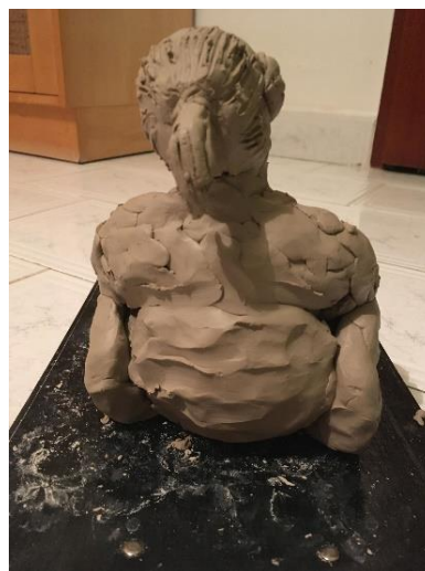
Obr. 11 Malý model babičky

Druhý malý model, který jsem vytvořila, je zobrazen v postoji, kdy si babička podepírá čelo rukou a její pohled směřuje k zemi. Tady už jsem nedbala tolik na podobu v obličejí, protože má část obličejí zakryt dlaní. Snažila jsem se opět zobrazit postoj a výraz zamyšlení. Invalidní vozík jsem zjednodušila tak, že ze začátku vypadal jako lavička s koly. Poté jsem na něj posadila model babičky. Sedadlo, na kterém model sedí se podlamoval tíhou figury, proto jsem ho musela zespodu pojistit kusem hlíny, aby postavu udržel. Tady jsem se inspirovala jiným autorem, a to Henry Moorem a jeho dílem Král a královna .