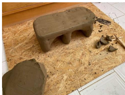
Obr. 16 Zjednodušený invalidní vozík

Kola jsem nechala strohá bez jakéhokoli dekoru. Chtěla jsem, aby se v práci střídala detailní propracovaná místa s těmi strohými bez detailu.