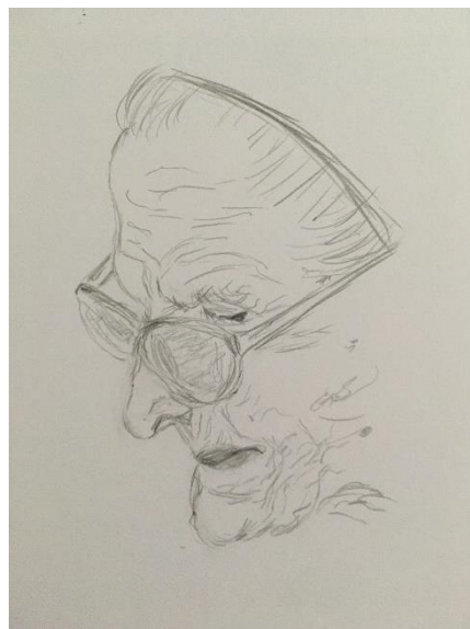
Obr. 7 Skica babičky (portrét)