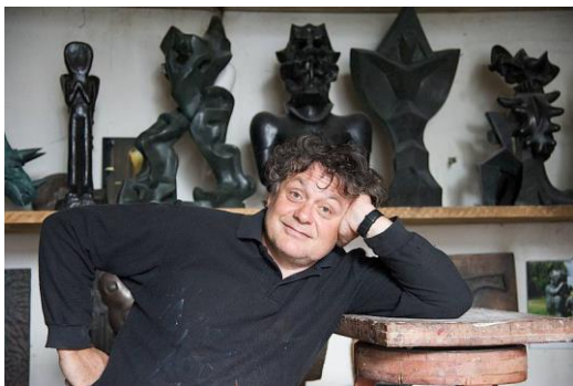
Obr. 7 Jaroslav Róna

Narodil se v roce 1957 v Praze. Jeho otec byl žid, proto musel s rodiči emigrovat. Museli se také schovávat před nacisty. Prožil si hrozné chvíle, které mu jistě utkvěly v paměti. Svá díla vystavuje od roku 1985 samostatně nebo se skupinou Tvrdohlaví, jejíž je součástí a je dokonce i jedním ze zakládajících členů skupiny. Jeho první velká samostatná výstava se konala v Domě U Kamenného zvonu v roce 1997.