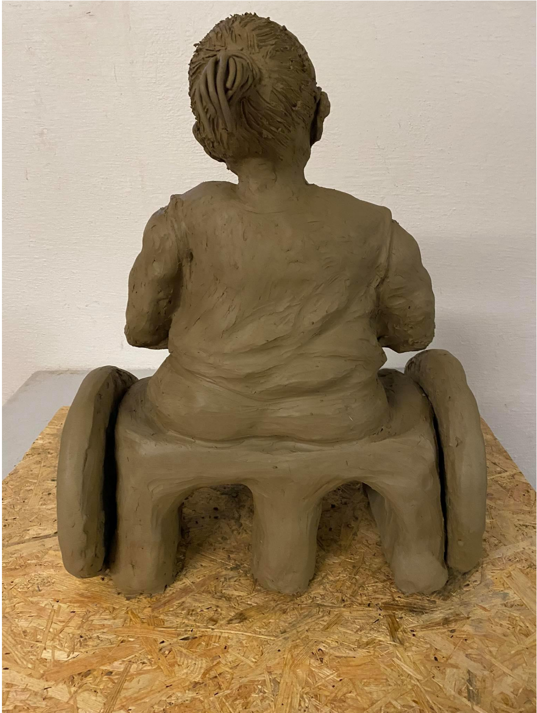
Příloha č. 8: Závěrečný model babičky