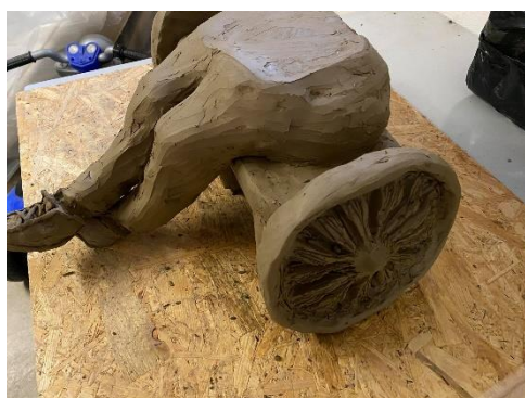
Obr. 18 Přidání dolních končetin

Začala jsem jak jinak než od nohou, které jsem umístila na sedací plochu. Musela jsem je prodlužovat v průběhu práce z důvodu zvýšení invalidního vozíku. Na chodidla jsem vymodelovala papuče, které patří neodmyslitelně k babičce a nesmí na jejím modelu chybět.