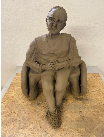
Obr. 26 Závěrečný model babičky

Hotové dílo bude převezeno na budovu Jezuitského konviktu a následně vystaveno.