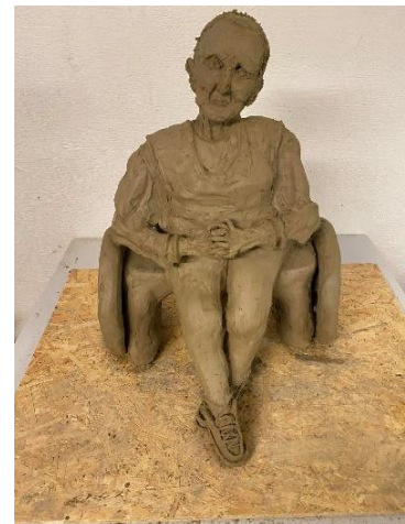
Obr. 25 Přidání hlavy

Hlava se zdála ale velmi velká oproti dlaním a chodidlům, proto jsem zvětšila chodidla a ruce, abych neubírala hlíny z hlavy. Po úpravě se zdálo vše v pořádku - hlava, ruce, trup i nohy k sobě perfektně seděly.