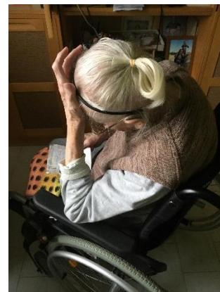
Obr. 1 Fotografie babičky Obr.2 Fotografie babičky Obr. 3 Fotografie babičky