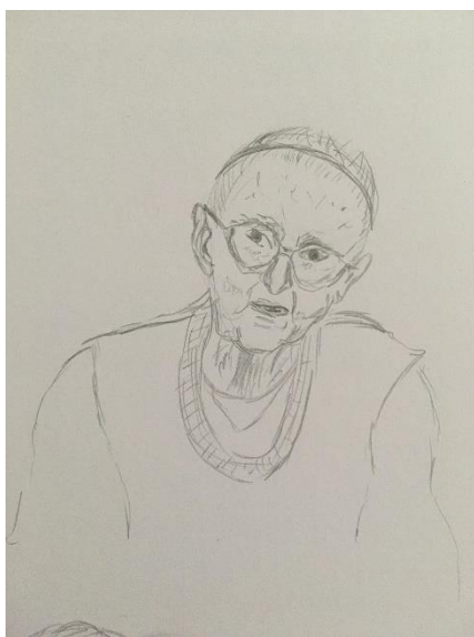
Obr. 6 Skica babičky (portrét)

K tomu jsem postupně začala přidávat skici, které byly zaměřeny na portrét babičky. Šlo o to, abych nastudovala také její obličej. Přece jen starý člověk má na tváři tolik nedokonalostí, které by se měly poté promítnout i do výsledného modelu, aby babička nevypadala jako mladá paní s tělem starého člověka.