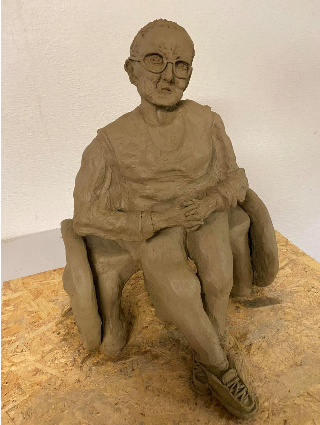
Příloha č. 2: Závěrečný model babičky