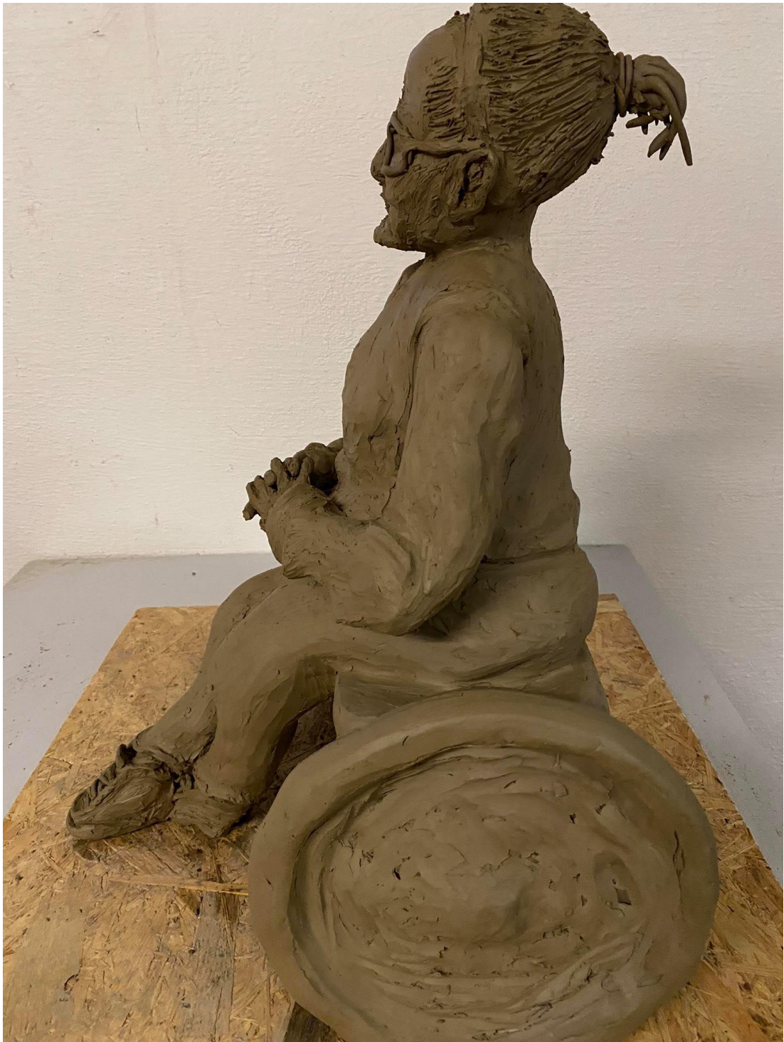
Příloha č. 6: Závěrečný model babičky