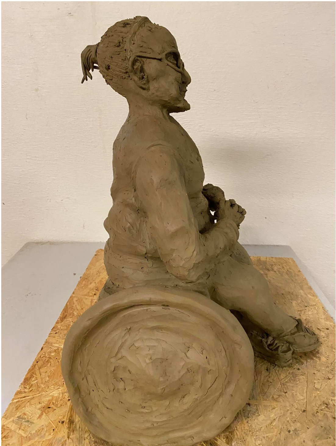
Příloha č. 5: Závěrečný model babičky