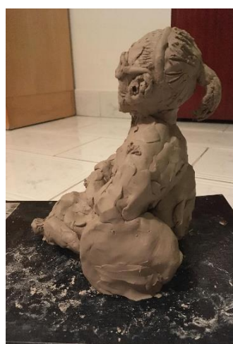
Obr. 9 Malý model babičky