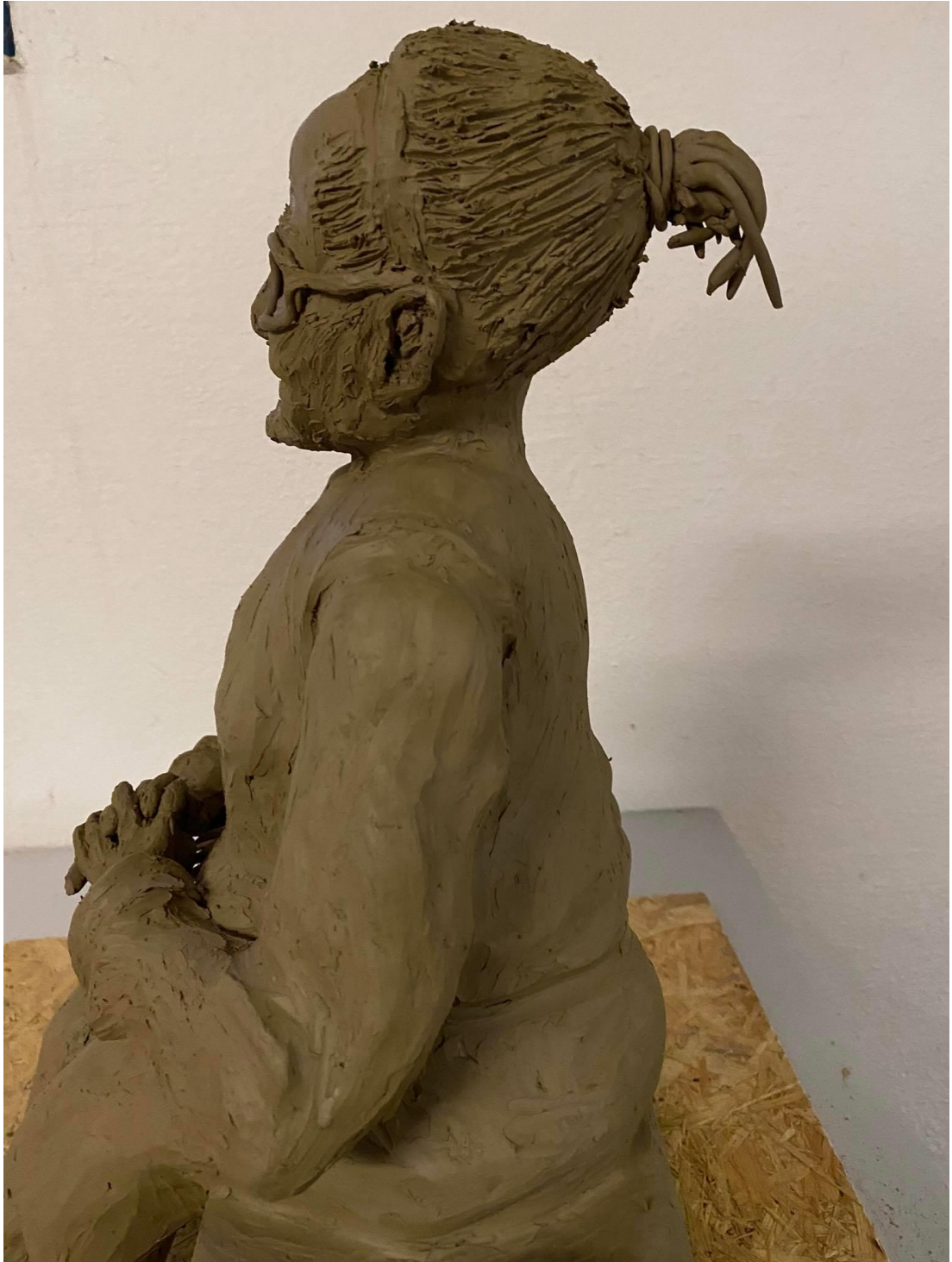
Příloha č. 7: Závěrečný model babičky