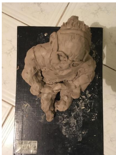
Obr. 10 Malý model babičky