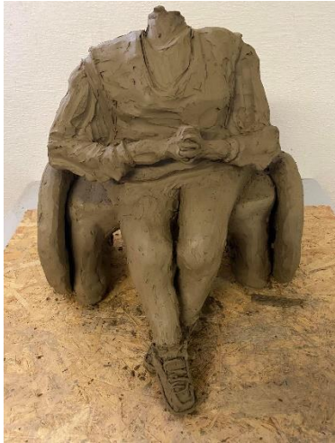
Obr. 23 Přidání dlaní k horním končetinám

Během několika dalších dnů jsem sháněla výztuhu, kterou bych protáhla skrze trup, aby hlava hezky přilnula k šíji. Nakonec jsem jako výztuhu použila závitovou tyč M6 délky 30 cm. Na tyč jsem postupně začala modelovat tvar hlavy, který byl zatím strohý bez jakýchkoliv detailů.