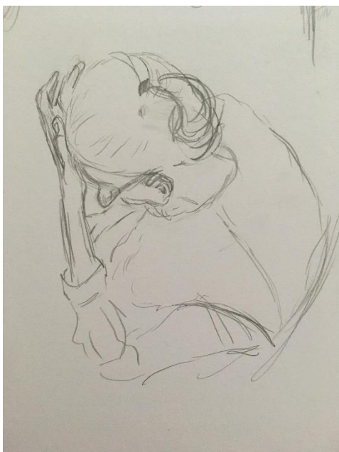
Obr. 4 skica babičky – první pozice