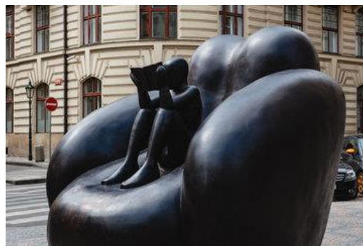
Obr. 8 Dílo Čtenář v křesle