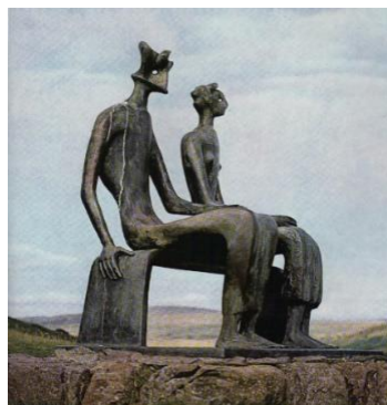
Obr. 10 Dílo Král a královna