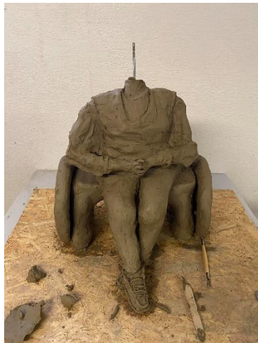
Obr. 24 Přidání výztuhy

Během několika dalších dnů jsem sháněla výztuhu, kterou bych protáhla skrze trup, aby hlava hezky přilnula k šíji. Nakonec jsem jako výztuhu použila závitovou tyč M6 délky 30 cm. Na tyč jsem postupně začala modelovat tvar hlavy, který byl zatím strohý bez jakýchkoliv detailů.