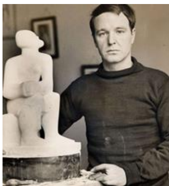
Obr. 9 Henry Moore

Jeho tvorba byla ovlivněna právě lidským prožitkem, který je tématem mé práce. Konkrétně zážitky z 1. světové války, kdy byl povolán na frontu nebo i zážitky z 2. světové války, kdy přestal učit na jedné z Londýnských univerzit. Válka zapříčinila to, že se začal věnovat např. grafice nebo kresbě. Zobrazoval lidi, kteří se schovávali před nálety v úkrytech. Jeden z nejhorších zážitků ale bylo, když Moorovi vybombardovali jeho dům a zničili část jeho prací a inspirace. Některé z jeho soch připomínají tváře lidí, kteří byli přivedeni na okraj šílenství, což zapříčinilo válečné období. Sochy měly prázdný výraz v očích nebo byly rozděleny do několika fragmentů. Nejčastěji je zobrazoval v poloze vleže. Jedním z příkladů je Ležící postava. Bylo to šílené období, které způsobilo také to, že byl po celý život tak skromný a vážil si mála.