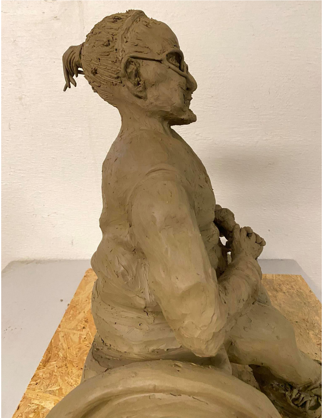
Příloha č. 9: Závěrečný model babičky