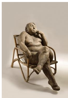
Obr. 4 Dílo Sedící žena