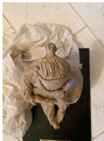
Obr. 14 Malý model babičky Obr. 15 Malý model babičky