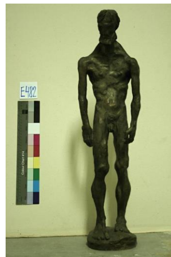
Obr. 2 Dílo Stařec