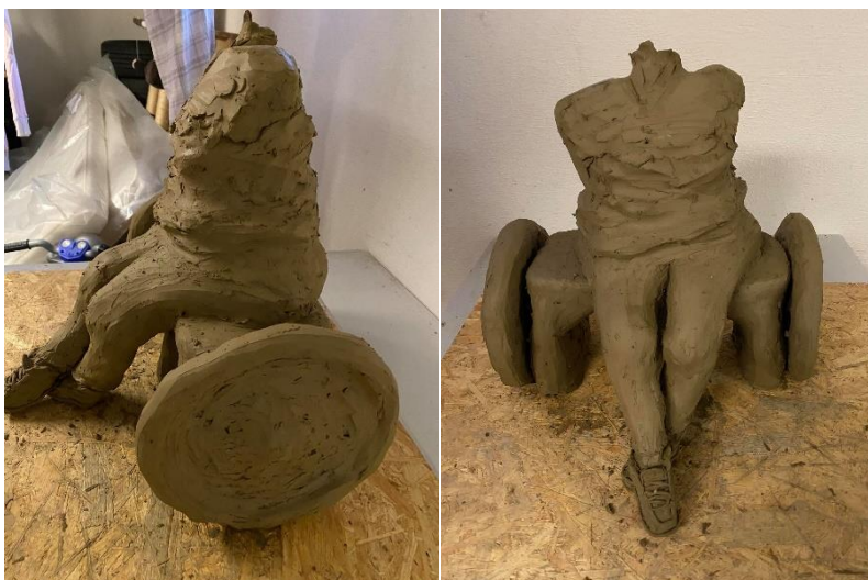
Obr. 20 Přidání pasu a hrudníku Obr. 21 Přidání pasu a hrudníku

Další část tvorby byla zaměřena na dokončení trupu a přidání horních končetin. Zatím pouze bez dlaní. Ruce jsem vymodelovala i s rukávy, aby bylo patrné, že babička nemá holé ruce. Snažila jsem se, aby byla patrná i vestička, kterou babička nosí pravidelně.