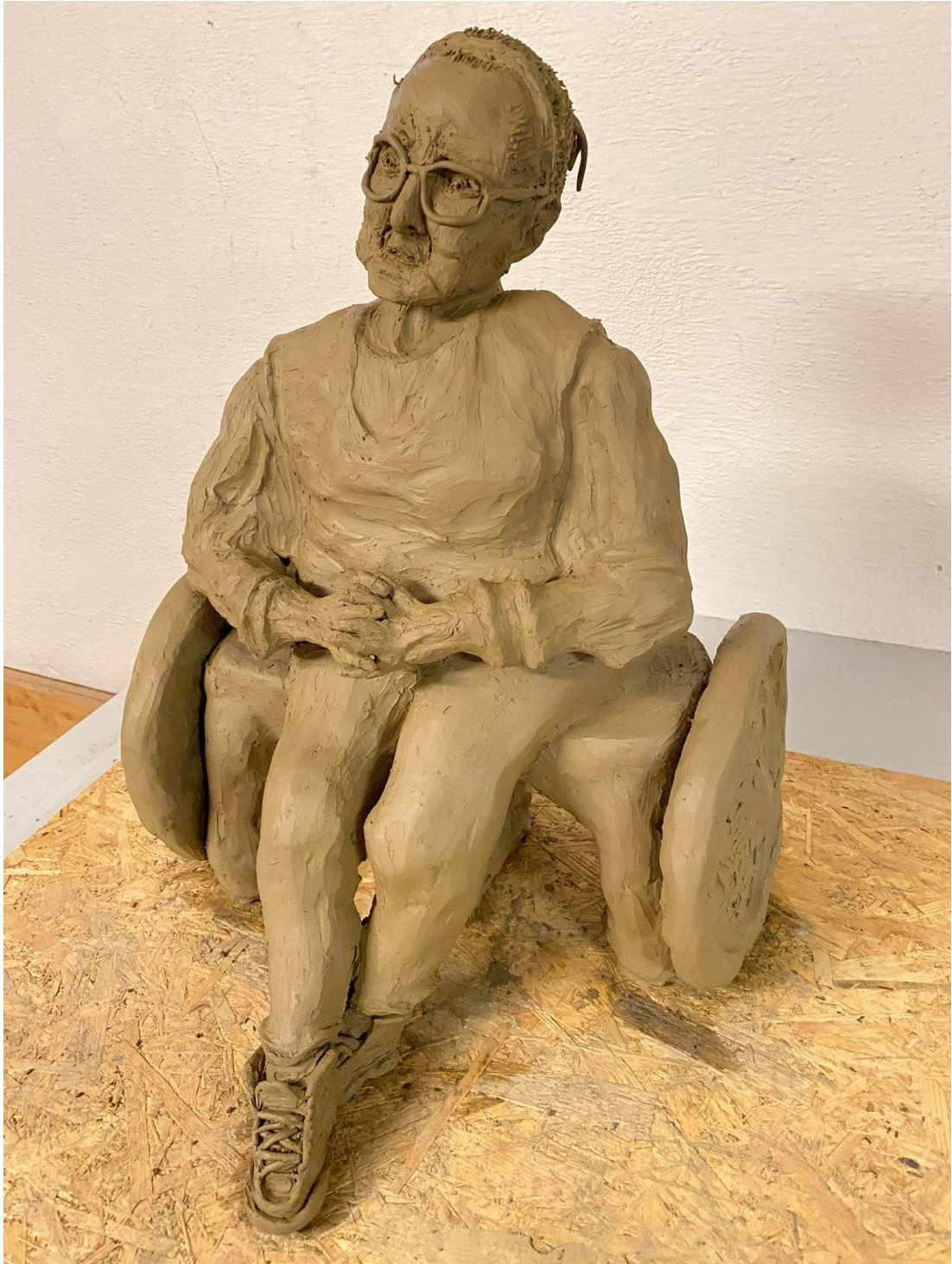
Příloha č. 4: Závěrečný model babičky