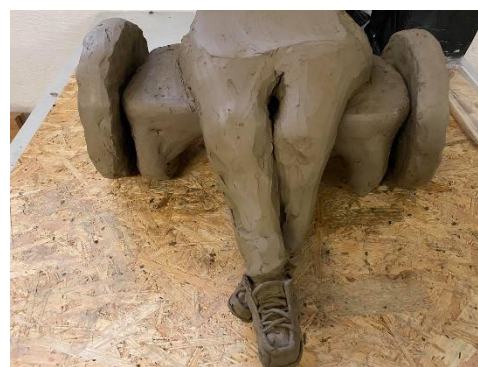
Obr. 19 Přidání dolních končetin

Když už jsem byla spokojená s proporcemi a výškou či šířkou, přidávala jsem ke končetinám trup. Zatím jen takový nástřel trupu, který byl nakloněn na jednu stranu.