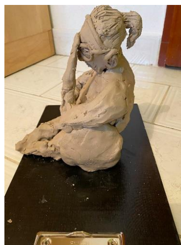
Obr. 13 Malý model babičky