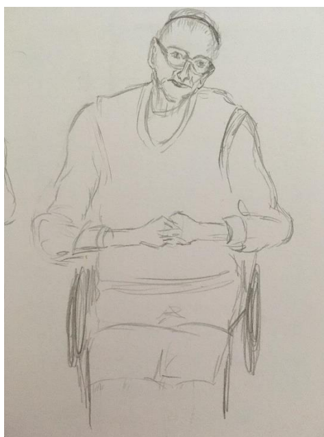
Obr. 5 skica babičky – druhá pozice

K tomu jsem postupně začala přidávat skici, které byly zaměřeny na portrét babičky. Šlo o to, abych nastudovala také její obličej. Přece jen starý člověk má na tváři tolik nedokonalostí, které by se měly poté promítnout i do výsledného modelu, aby babička nevypadala jako mladá paní s tělem starého člověka.