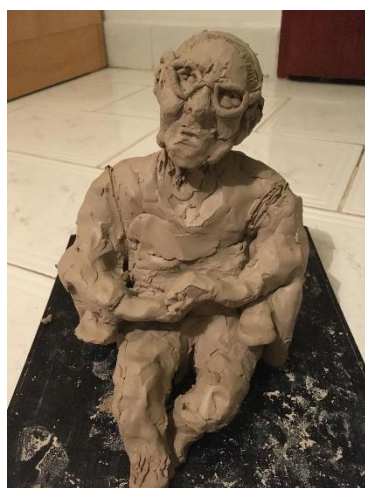
Obr. 8 Malý model babičky

První ze dvou modelů jsem zobrazila v postoji, kdy má babička spjaté ruce a hlavu nakloněnou na jednu stranu. Je to postoj, který jsem popisovala již více, kdy jsem babičku studovala pomocí studijních skic. Snažila jsem se zaměřit především na podobu babičky. Dále jsem se snažila zachytit výraz v obličeji a postoj. Co se týče invalidního vozíku, ten jsem zjednodušila a upravila tak, aby přes zjednodušení byl zachován jeho základní tvar. Inspirací mi byl známí český autor Jaroslav Róna a jeho dílo Čtenář v křesle . Konkrétně křeslo, které jsem ale zmenšila a přidala jsem k němu z každé strany 2 kola, aby to vypadalo, že babička sedí na invalidním vozíku.