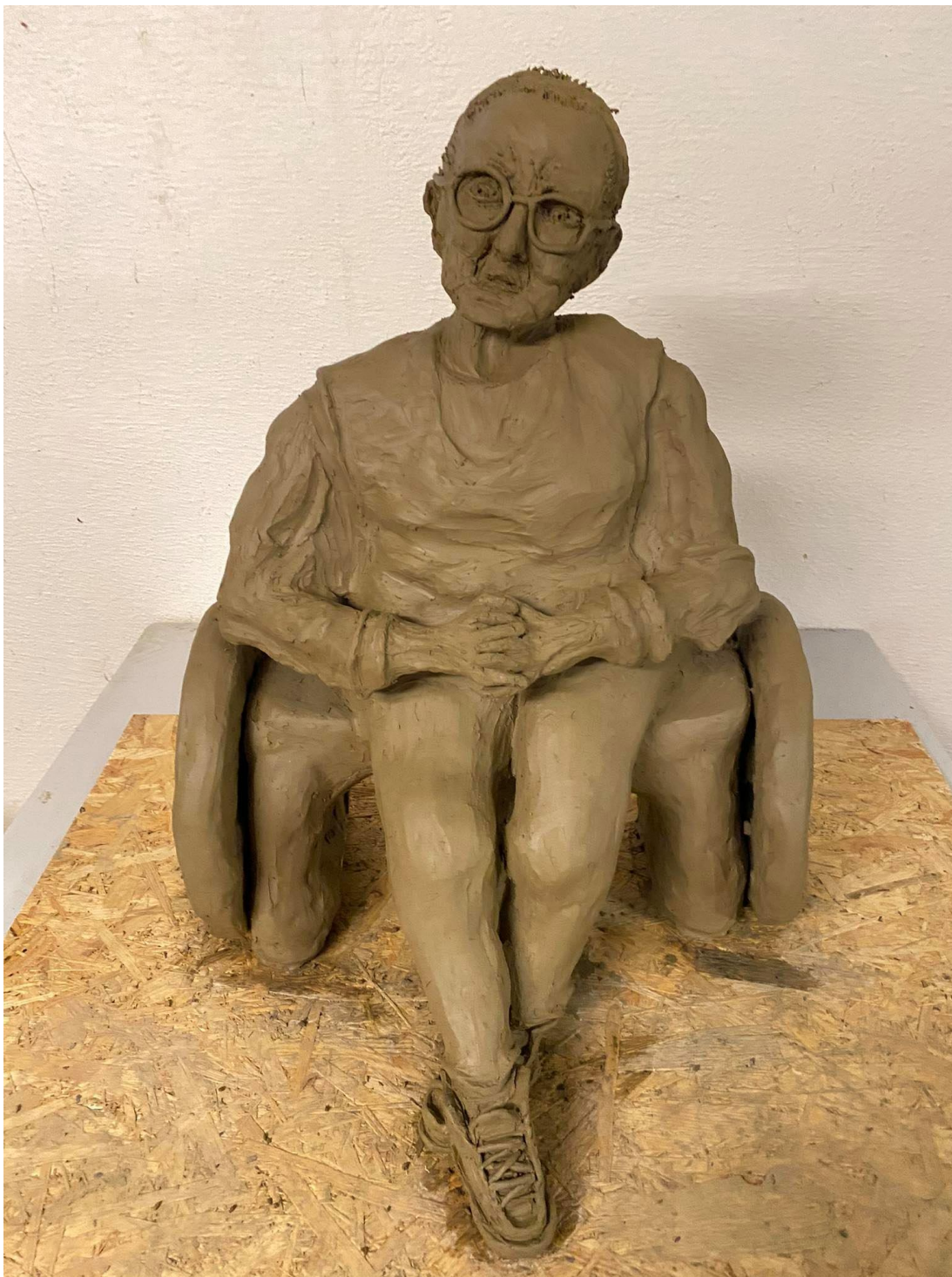
Příloha č. 1: Závěrečný model babičky