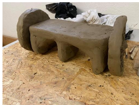
Obr. 17 Zjednodušený invalidní vozík

Jakmile jsem měla sedací plochu hotovou, dala jsem se do práce se samotným modelem babičky.