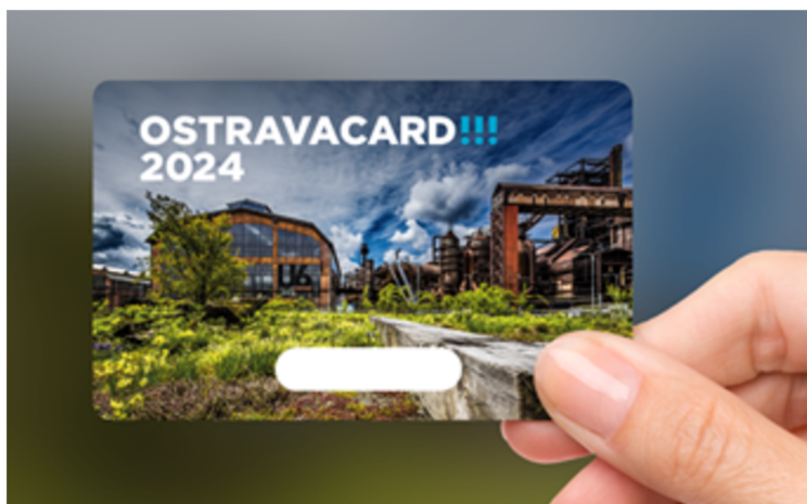
Obrázek 4: Návštěvnická karta OSTRAVACARD!!!

Držitel karty má možnost využít slevy v oblasti gastronomie, volnočasových aktivit a nakupování suvenýrů. Mezi zainteresované subjekty patří například Vyhlídková věž Nové radnice, ZOO Ostrava nebo Slezskoostravský hrad. V Dolnovítkovském areálu lze využít slevu na vstupné do Velkého světa techniky a Malého světa techniky U6. Velikost slevy se liší podle objektů v rozmezí od 10 do 30 % (Ostravacard.eu, 2024).