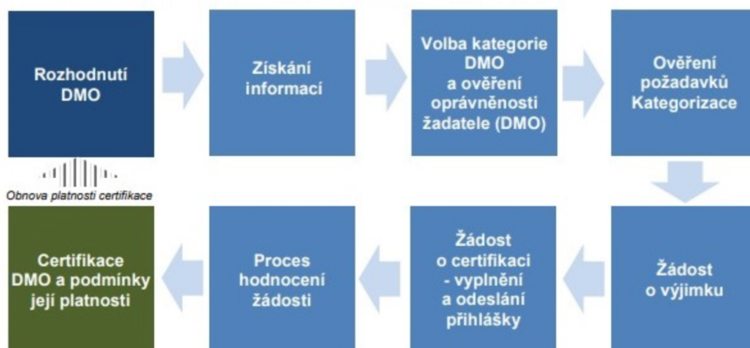
Obrázek 2: Proces certifikace