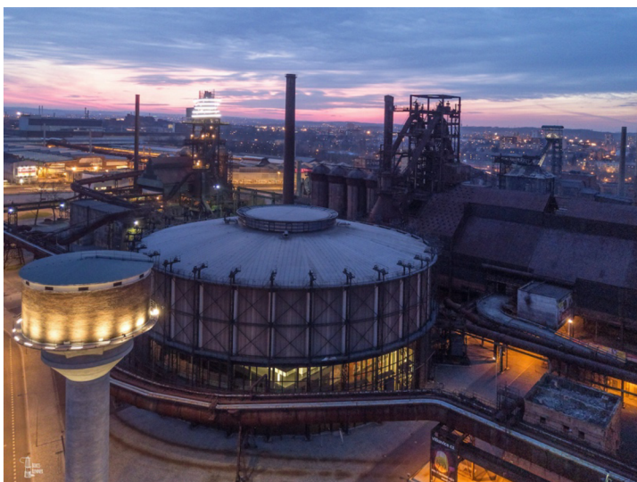
Obrázek 5: Dolní Vítkovice

S areálem Dolních Vítkovic a jeho revitalizací je úzce spjata jméno Josef Pleskot. Ing. arch. Josef Pleskot je významný český architekt, který absolvoval fakultu architektury Českého vysokého učení technického v Praze a v roce 1991 založil atelier AP (APatelier, 2023). Mezi jeho nejznámější stavby patří radnice v Benešově, dále sídlo ČSBO v Praze-Radlicích nebo průchod valem Prašného mostu na Pražském hradě. Dolní Vítkovice představují jeho dosud největší realizaci a sám ji označuje jako "srdeční záležitost". Díky práci Josefa Pleskota se architektura v této oblasti posouvá na úroveň evropských projektů (Volf et al., 2013).