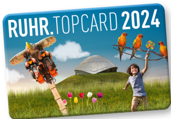
Obrázek 7: Návštěvnická karta RUHR.TOPCARD

Ruhr.topcard je platná jeden rok a to od listopadu do konce října následujícího roku. Cena této karty je 66 eur pro dospělého a 42 eur pro děti. Zakoupení je možné na více než 140 prodejních místech v celém Severním Porýní-Vestfálsku, online na webové stránce, nebo telefonicky na infolince (Ruhr.topcard, 2024).