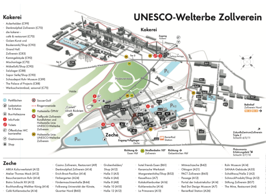
Obrázek 9: Mapa areálu bývalého uhelného dolu Zollverein

Areál bývalého uhelného dolu a koksovny Zollverein se dělí na dvě části Kokerei, v překladu koksovnu a Zeche - důl. Rozložení jednotlivých objektů je k vidění na obrázku 9.