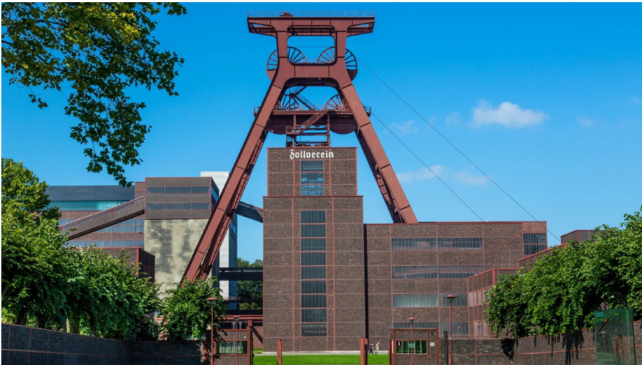
Obrázek 8: Uhelny dól Zollverein

V Porýří se těžilo uhlí ve stovkách dolů, ale pouze dól a koksovna Zollverein je od prosince roku 2001 zapsán na seznam světového dědictví UNESCO. Objekt byl na seznam zapsán nejen kvůli jedinečné architektuře Bauhaus stylu, ale také z důvodu stavební proměny kraje (Stojanová, 2014). Bývalý průmyslový areál se tak řadí mezi nejvýznamnější industriální památky na světě. Průkopníkem a architektem, který se zasloužil o podobu Porýří po ukončení těžby uhlí je Dr. Werner Müller. K uctění jeho celoživotního díla je po něm od roku 2020 pojmenováno náměstí před úpravnou uhlí (zollverein.de, 2024).