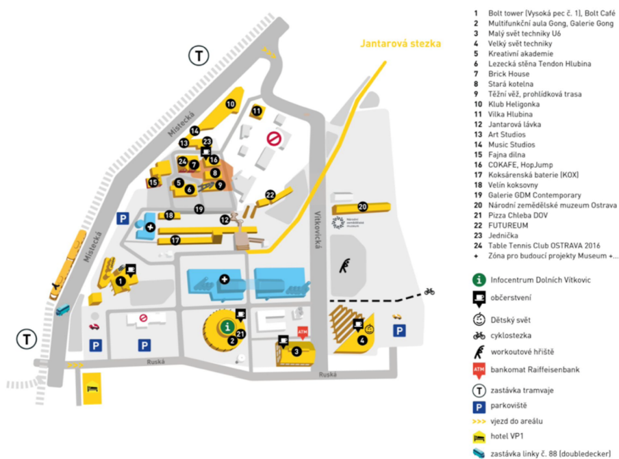
Obrázek 6: Mapa areálu Dolní Vítkovice

V následující části budou jednotlivě popsány objekty, které byly v rámci areálu Dolních Vítkovic revitalizovány a nově zpřístupněny pro návštěvníky. Podrobněji bude popsán vývoj těchto staveb od historie až po současnost. Obrázek 6 zobrazuje aktuální plánec Dolních Vítkovic a rozvržení jednotlivých budov.