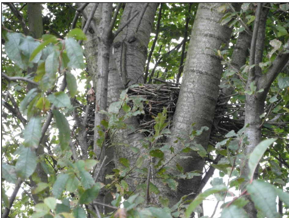
Obr. 9 V biokoridoru dochází ke hnízdění (29. 9. 2013).