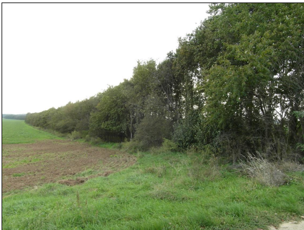
Obr. 11 Severní konec biokoridoru s TVP 3 (29. 9. 2013).