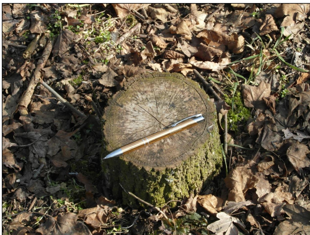
Obr. 13 Provedená těžba Quercus robur na TVP 3 (20. 2. 2015).