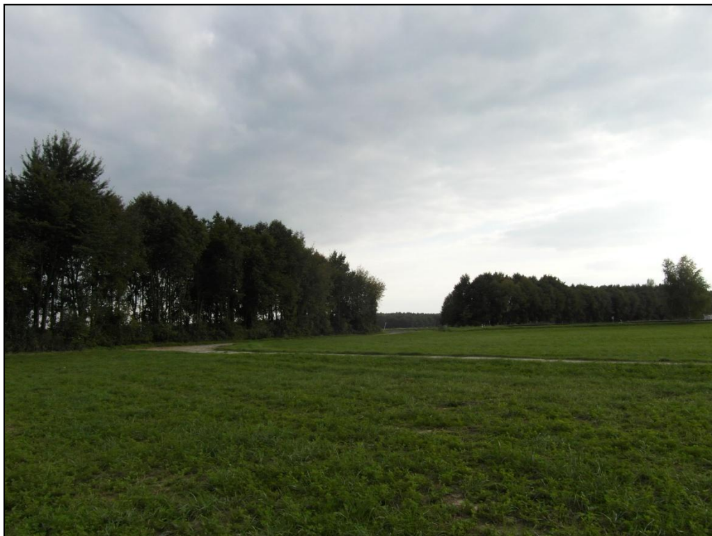
Obr. 16 TVP 4 v blízkosti cesty Veselí nad Moravou – Kyjov (29. 9. 2013).