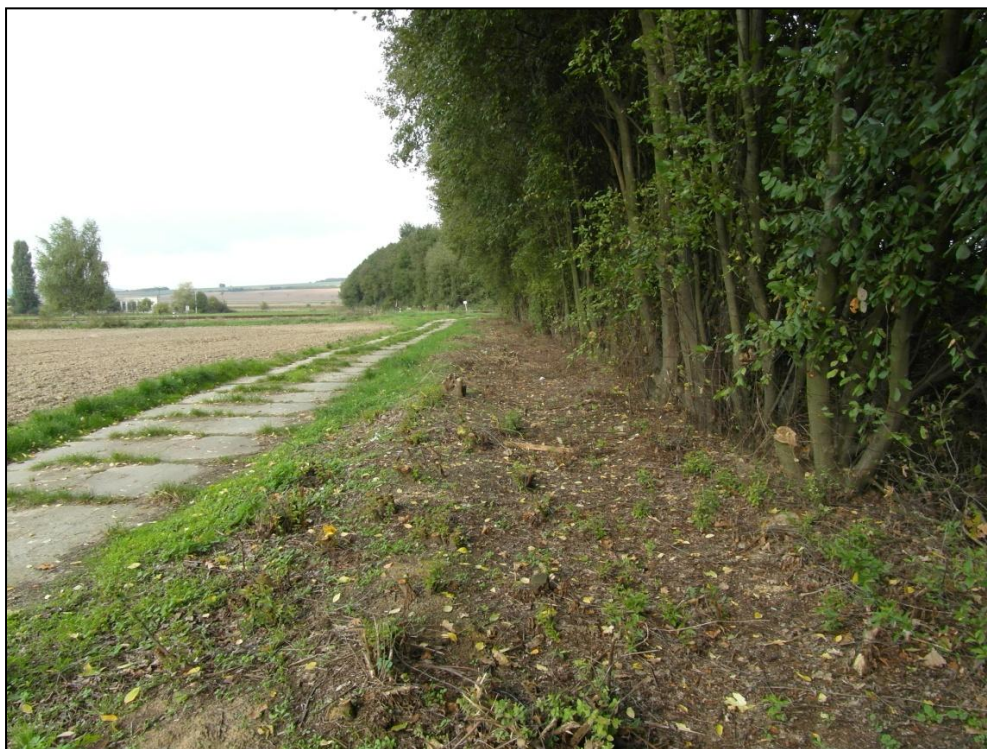
Obr. 8 Kompletně odstraněná první řada na TVP 2 (29. 9. 2013).