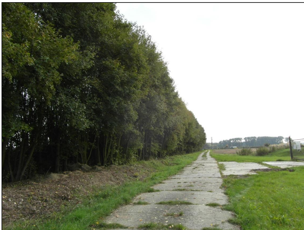
Obr. 7 Betonová cesta podél TVP 2 (29. 9. 2013).