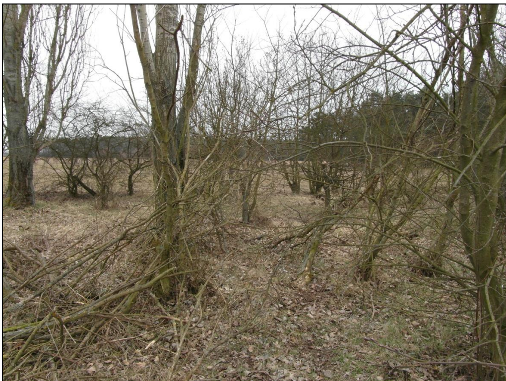
Obr. 6 Nizký počet jedinců na TVP 1 (24. 3. 2013).