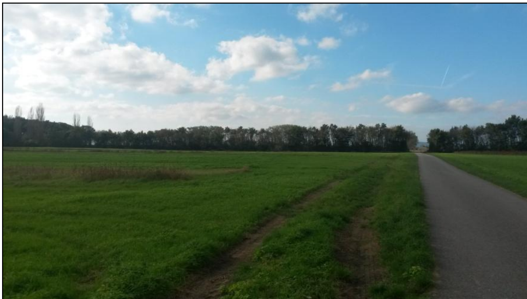
Obr. 3 Pohled na jižní část biokoridoru s TVP 1 (19. 10. 2014).