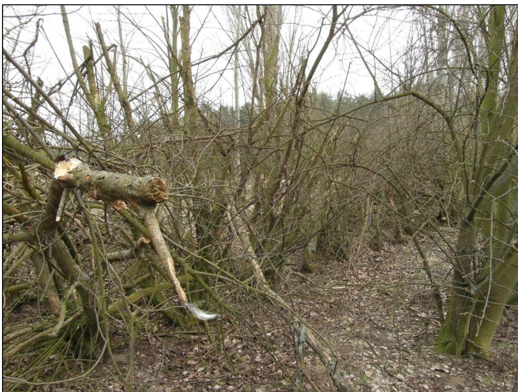
Obr. 5 Torza keřového patra na TVP 1 (24. 3. 2013).