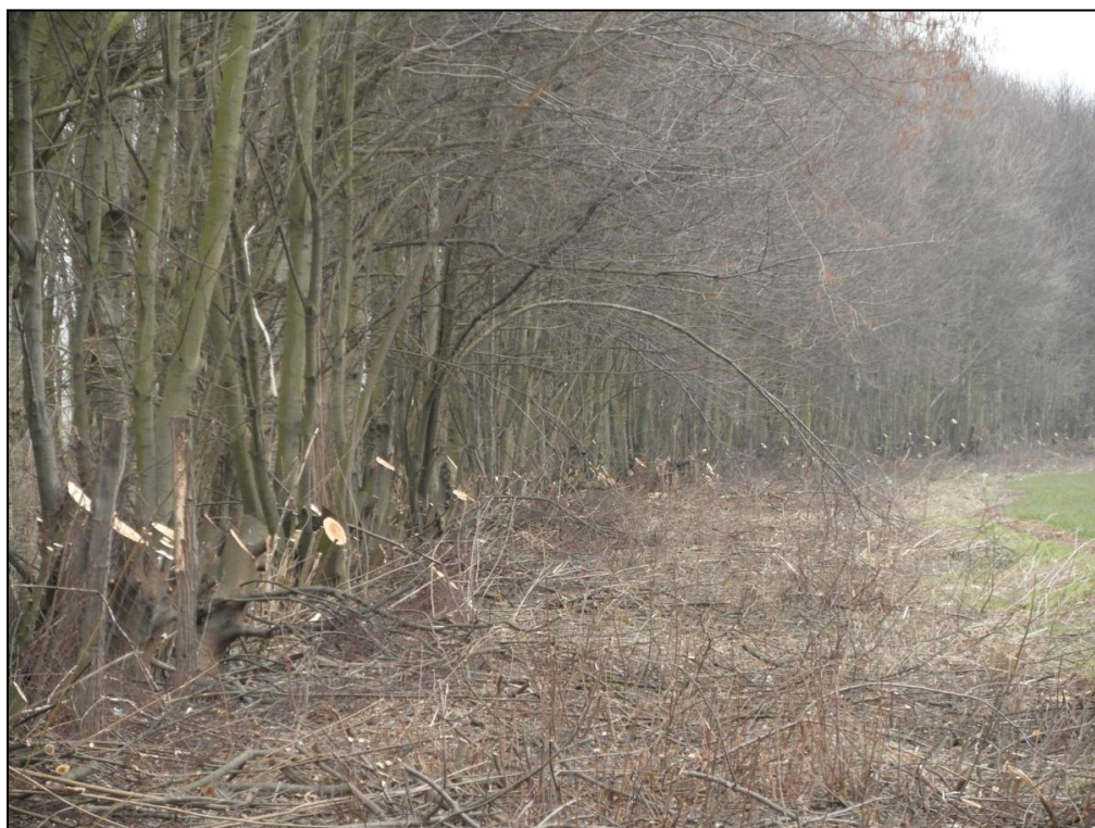
Obr. 15 Ořez osmé řady na TVP 4 (7. 4. 2013).