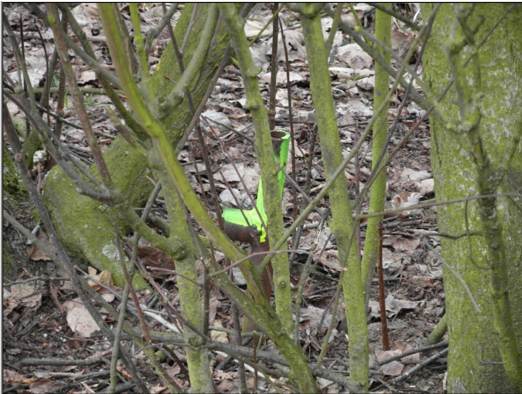
Obr. 17 Trvalé vyznačení bodů výzkumných ploch (24. 3. 2013).