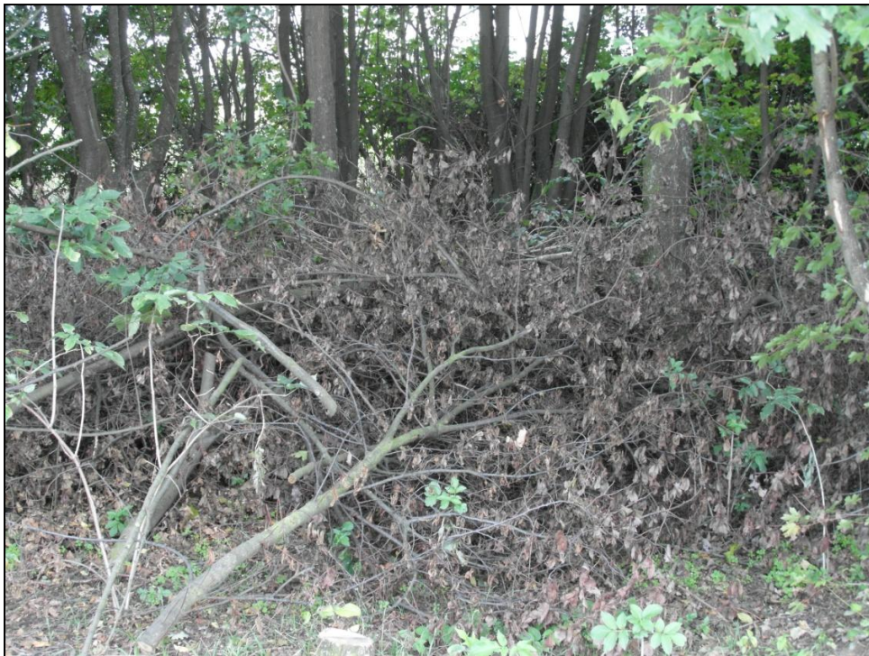
Obr. 10 Jedinci odstranění na TVP 2 jsou navršeni v Biokoridoru (29. 9. 2013).