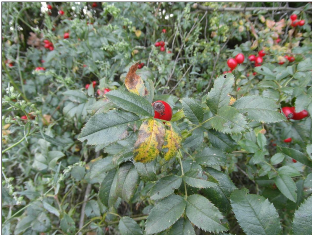
Obr. 18 Estetická funkce biokoridoru Rosa sp. (29. 9. 2013).