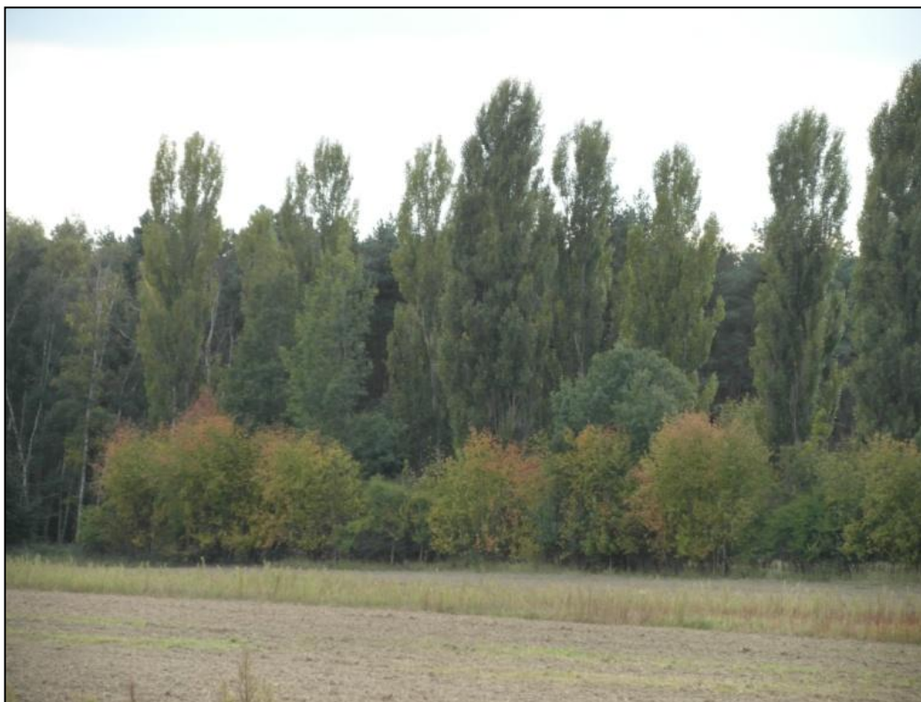
Obr. 4 TVP 1 dominují zástupci rodu Populus sp. (29. 9. 2013).