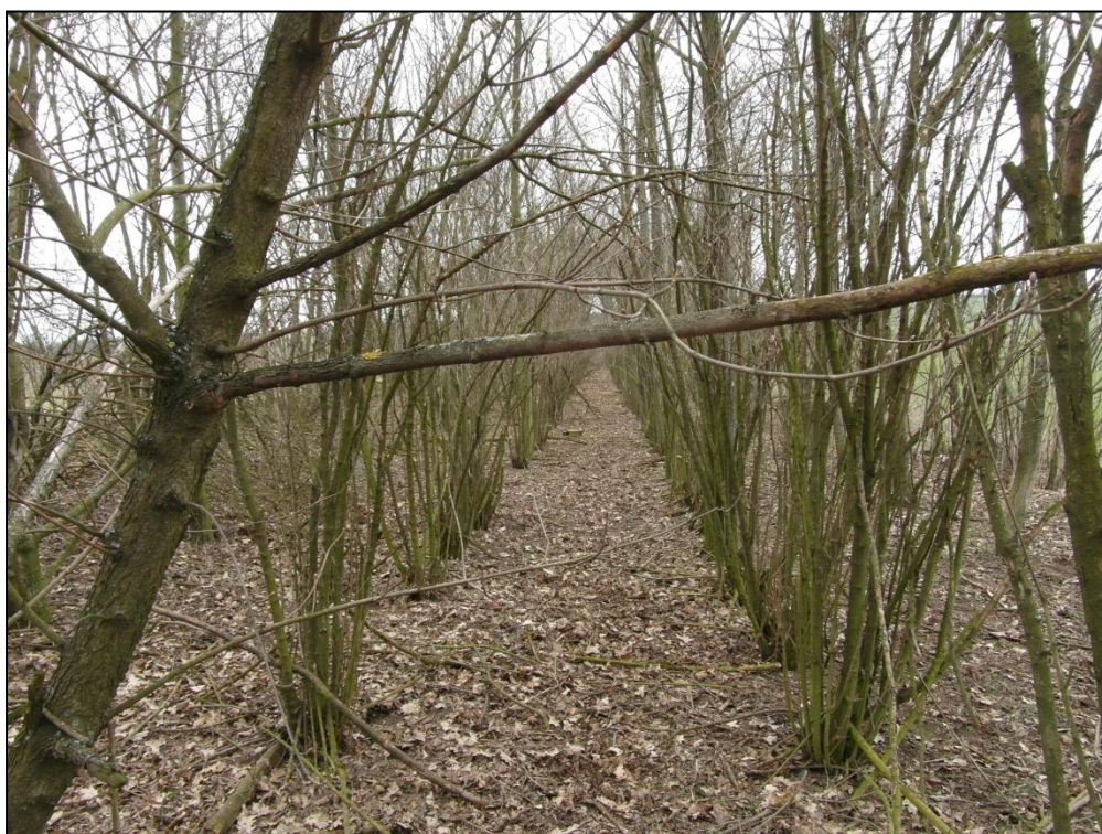
Obr. 12 Řady biokoridoru na TVP 3 (6. 4. 2013).