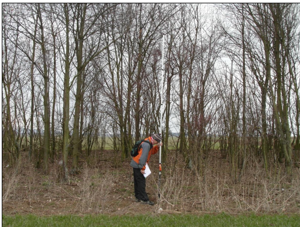
Obr. 14 Práce s výškoměrnou latí na TVP 3 (7. 4. 2013).