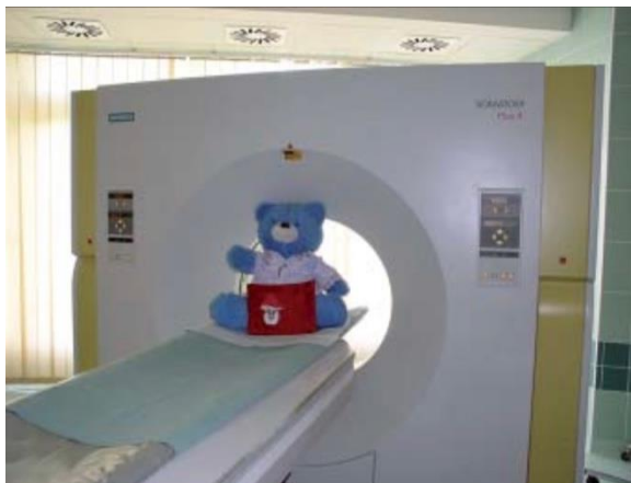
Obrázek 1 Fotoalbum – medvídek na CT vyšetření