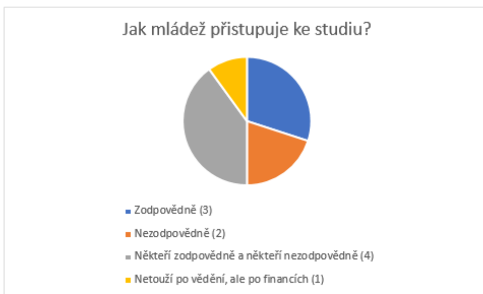
Graf 1: Jak mládež přistupuje ke studiu?

Předpokládala jsem, že většina příslušníků starší generace si myslí, že dnešní mládež přistupuje ke studiu zodpovědně a to z toho důvodu, že je velké procento mládeže studující na vysoké škole. Má hypotéza se potvrdila jen částečně. Pouze tři respondenti uvedli, že většina mladých lidí bere studium zodpovědně. Čtyři respondenti rozdělili mládež na dvě skupiny a to ty, kteří jsou cílevědomí a zodpovědně přistupují ke svému vzdělání, a ty, kteří mají ke studiu laxní přístup. Negativně mládež v této záležitosti hodnotili 3 respondenti.