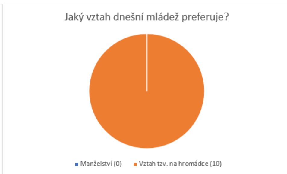
Graf 5: Jaký vztah dnešní mládež preferuje?

Poslední hypotéza, kterou jsem stanovila následovně: Většina příslušníků starší generace si myslí, že mladí lidé nemají zájem o manželství, se zcela potvrdila. 100% respondentů odpovědělo, že mladí lidé se nechtějí vázat a nechávají si ve vztahu tzv. otevřená vrátka.