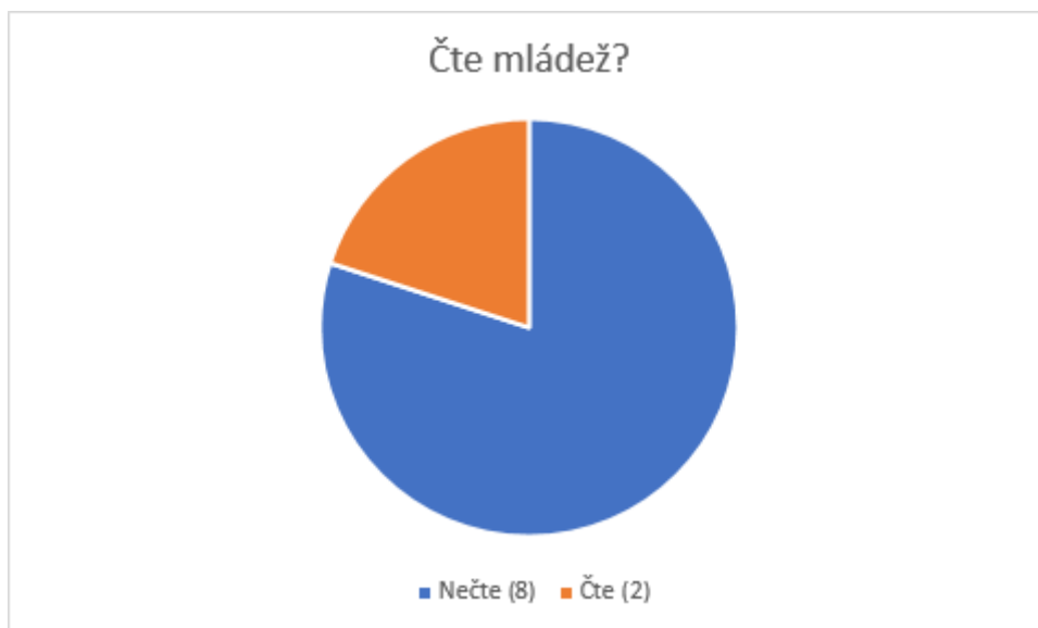
Graf 2: Čte mládež?

Mou hypotézou v tomto okruhu bylo, že většina příslušníků starší generace si myslí, že dnešní mládež nečte. Tato hypotéza se potvrdila na 80 %.