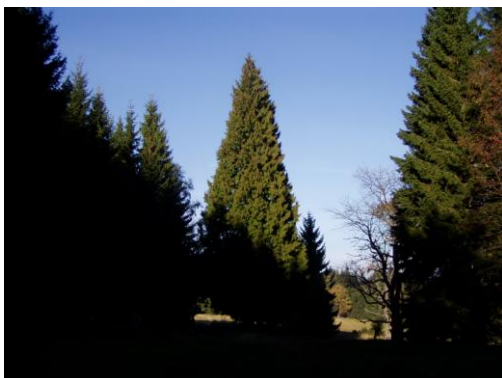
Obrázek 17. Oblast bývalé osady Paulina s "cizokrajným stromem" (vyhlášený památný strom-zerav obrovský)