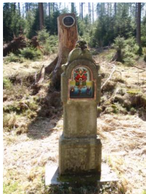
Obrázek 2. Stélová Boží muka

Pro oblast novohradská jsou specifickým fenoménem tzv. stélová Boží muka. Jedná se o do kamene (většinou modrošedé žuly) tesané výklenkové kapličky. Tento typ kaple byl rozšířen především na území dnešního rakouského Mühlviertelu. (Kolektiv, 2006)