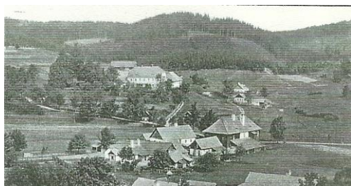
Obrázek 13. Stříbrné Hutě na počátku 20. století