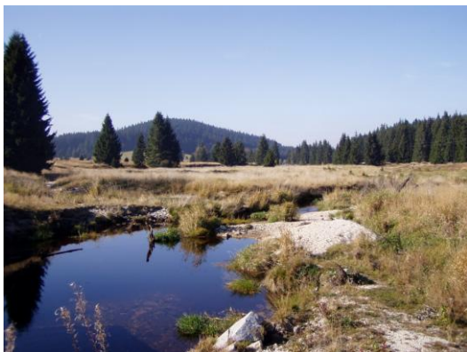
Obrázek 6. Plošina v okolí Pohoří na Šumavě