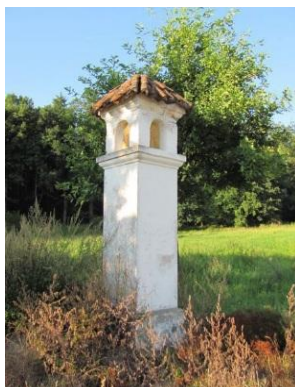
Obrázek 3. Zděná Boží muka