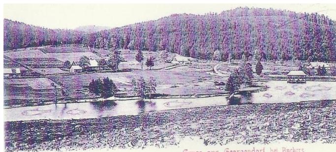
Obrázek 15. Bývalé Jiřice na počátku 20. století

vybudovali svá obydlí. (Kolektiv 1775-1947) Od roku 1788 je osada uváděna pod tradičním německým názvem Georgendorf. (Koblasa 1997)