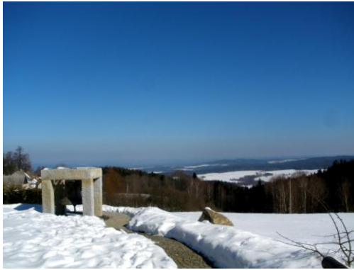
Obrázek 22. Výhled od zvonu v Hojně Vodě