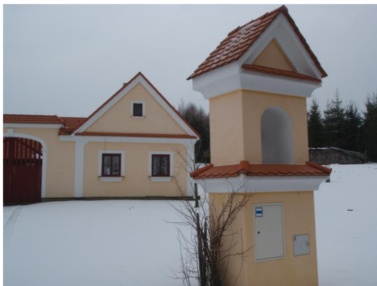
Obrázek 24. Přestavěná Boží muka na Lužnici

V prostoru obce Lužnice byly lokalizovány dva objekty drobné sakrální architektury. Jedná se o kamenný kříž s plastikou Krista u silnice na Pohorskou Ves a zděnou kapličku na jižním okraji sídla, která je příkladem zacházení některých majitelů rekreačních nemovitostí s drobnou sakrální architekturou, jelikož byla upravena jako elektrorozvodna pro přilehlou stavbu (kaplička na kapličce).