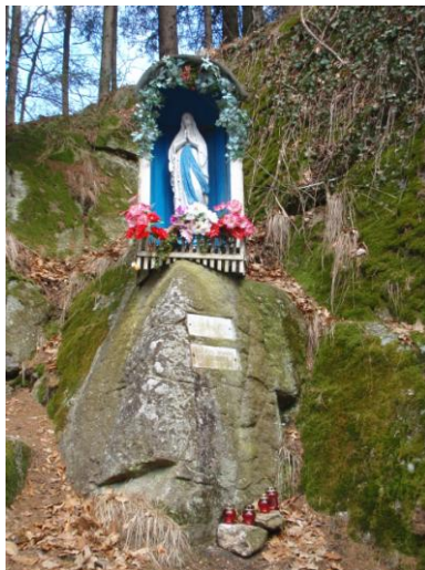
Obrázek 5. Volně stojící plastika (Panna Maria)

Názvy objektů drobné sakrální architektury, tak jak je známe dnes, byly odvozeny od účelu k jakému tyto objekty sloužily a někde slouží i dnes. Boží muka jsou tedy univerzálními místy, kde je vhodné obrátit se k Bohu s pokáním a vznikala na místech, kde je nějakým způsobem dobře nebo hezky. Zastavení jsou místa určená pro zastavení procesí a často se nachází ve čtyřech rozích plužiny a byly u nich vykonávány obřady. Poslední sortou jsou pak Pokony, Kříže a Svaté obrázky. Tyto objekty jsou spjaty s nějakou konkrétní událostí a jsou míněny jako poděkování nebo místo významné události. (Löw, 2003)