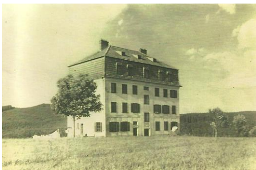
Obrázek 10. Bývalá celnice Stadlberg