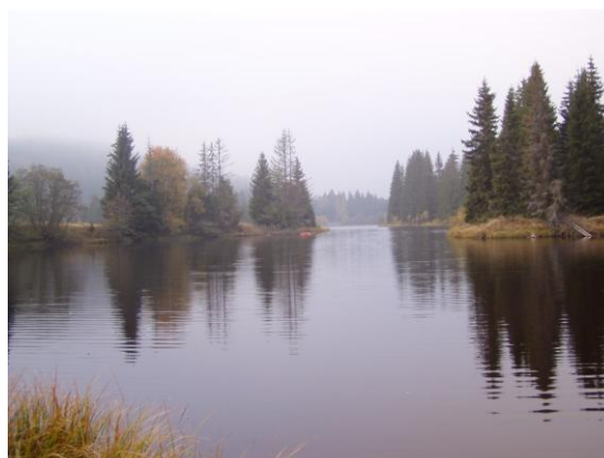
Obrázek 16. Jiřická nádrž

V prostoru bývalé osady Jiřice byly lokalizovány dva objekty drobné sakrální architektury. Jedná se o dva kříže u silnice. Oba mají formu křížů z armovací oceli na kamenných fundamentech. Kříže jsou výsledkem snahy o obnovu drobné sakrální architektury po roce 1989 a kamenné fundamenty jsou původní.