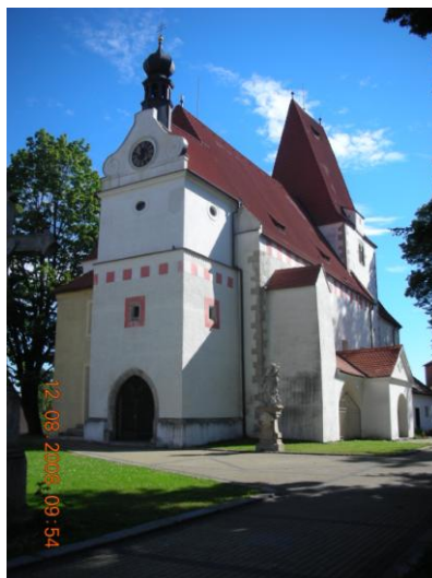
Obrázek 19. Kostel sv. Mikuláše v Horní Stropnici

Počet obyvatel je poprvé věrohodně uveden v roce 1880 a to 1099 obyvatel. V průběhu dalších historických událostí počet obyvatel příliš nekolísá. Výrazný krátkodobý propad byl zaznamenán krátce po 2. světové válce, po odsunu německy mluvícího obyvatelstva. Dnes má obec i se svými částmi přibližně 1 500 obyvatel. (Němec, 2005)