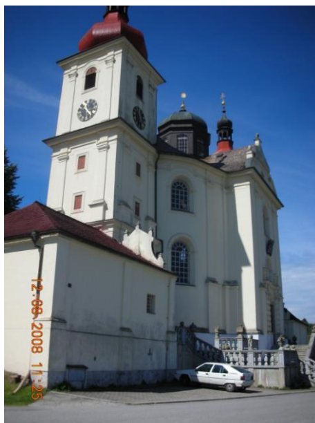
Obrázek 21. Poutní kostel Nanebevzetí Panny Marie v Dobré Vodě

V prostoru Dobré Vody byly lokalizovány 4 objekty drobné sakrální architektury. Jedná se o litinový kříž u silnice z Hojné Vody, kamenný kříž u odbočky na Šejby s datací 1910, trojici křížů u hlavního pramene a litinový kříž na kamené patici u silnice směrem na Horní Stropnici.