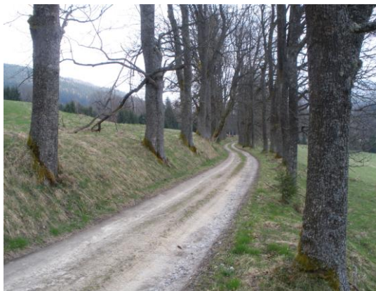
Obrázek 12. Alej javorů klenů v bývalých Stříbrných Hutích

Od roku 1820 se zavedla pokusná výroba hyalitu. Sklo ze Stříbrných Hutí nacházelo dostatek odběratelů ve Vídni, Terstu, ve Francii, Německu a Rusku. Získalo ocenění na světové výstavě konané v Paříži roku 1855. (Kolektiv, 2006) Huť se těšila výborné pověsti a byla rozšířena o nové brusírny - Ferdinandovu a Karlovu. Celkem tu bylo zaměstnáno 50 brusičů. Postupně se však se stále větší intenzitou projevoval úpadek. A již v 60. letech 19. stol. byla uzavřena Bonaventura. (Koblasa, 1997) Stejný osud čekal i na sklárnu ve Stříbrných Hutích. Nejprve se snižoval počet pecí a nakonec musely být hutě 17. srpna 1881 natrvalo uzavřeny, co způsobilo i pokles významu přilehlé osady. Skláři bez uplatnění, začali odcházet, místo nich přicházeli dřevorubci, rozmohla se domácí výroba knoflíků. (Kolektiv, 2006) Stříbrné Hutě měli 19 domů, bydlelo tu 81 Němců a 50 Čechů, finanční stráž měla při kapliče kasárna. V roce 1939 na Stříbrných Hutích a Bonaventuře najdeme 28 domů se 113 obyvateli (SOkA Český Krumlov 2010).