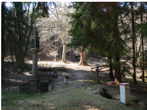
Obrázek 8. Trojhraňní mezník