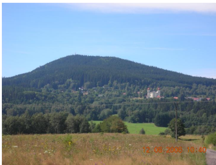
Obrázek 20. Dobrá Voda od Horní Stropnice

Z hlediska drobné sakrální architektury je zajímavým faktem označování pramenů křížky, z nichž se dochoval patrně pouze jediný u hlavního pramene nedaleko poutního kostela. (Němec, 2005)