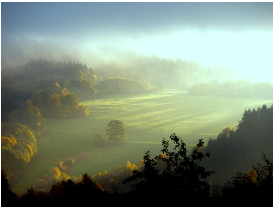
Obrázek 26. Podzimní ráno v zájmové oblasti

Terénním průzkum byl proveden s maximální pečlivostí, avšak ani tak si autor netroufá tvrdit, že zmapoval úplně všechny existující objekty drobné sakrální architektury a případné připomínky rád do své práce zahrne.