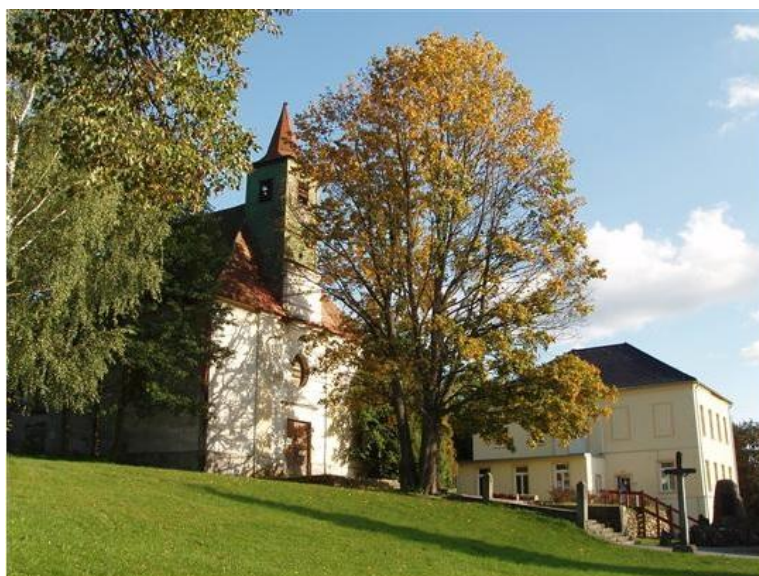
Obrázek 25. Kostel sv. Linharta v Pohorské Vsi

V intravilánu obce Pohorská Ves byly lokalizovány dva objekty drobné sakrální architektury a to kamenný říž s plastikou Krista, před kostelem sv. Linharta a pomník padlým z obou světových válek tamtéž.