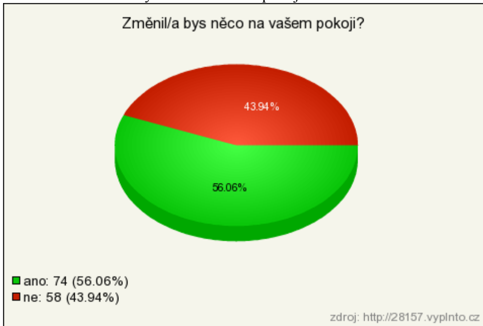
Graf č. 8 - Změnil/a bys něco na vašem pokoji?

Na otázku, zda by něco změnili na jejich pokoji v azylovém domě, zvolilo možnost ano 56 % a možnost ne 44 % respondentů.