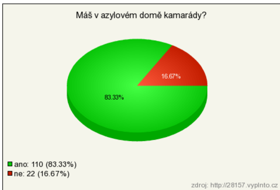
Graf č. 3 – Máš v azylovém domě kamarády?

Na otázku, zda má v azylovém domě kamarády odpovědělo 83 % respondentů, že ano. Kamarády v azylovém domě nemá zbývajících 17 % respondentů.