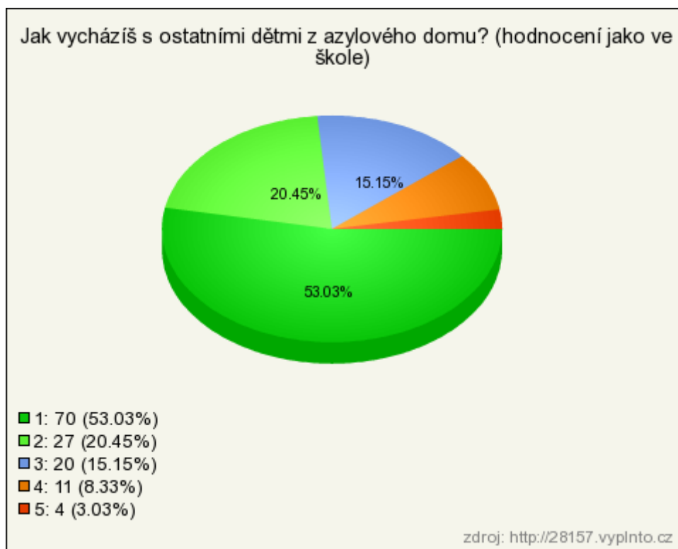
Graf č. 4 - Jak vycházíš s ostatními dětmi z azylového domu?

Na otázku, jak vychází s ostatními dětmi v azylovém domě, měli respondenti odpovědět provedením volby na pětistupňové škále. Jedničku zvolilo 53 % respondentů, dvojku 20 %, trojku 15 %, čtyřku 8 % a pětku 3 % respondentů.