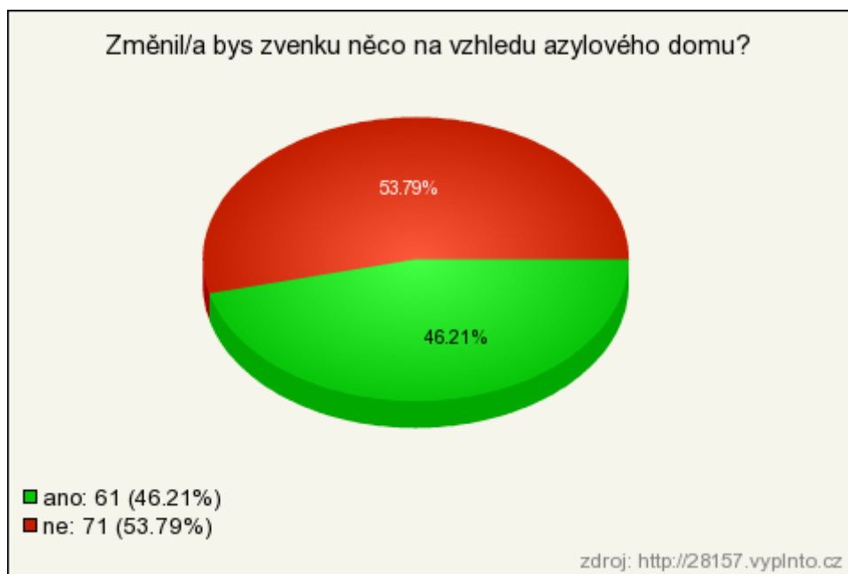
Graf č. 6 - Změnil/a bys zvenku něco na vzhledu azylového domu?

V této otázce se měli respondenti rozhodnout, zda by něco změnili na vnějším vzhledu azylového domu. Možnost, že nic měnit nechce, zvolilo 54 % respondentů a nějakou změnu by chtělo 46 % respondentů.