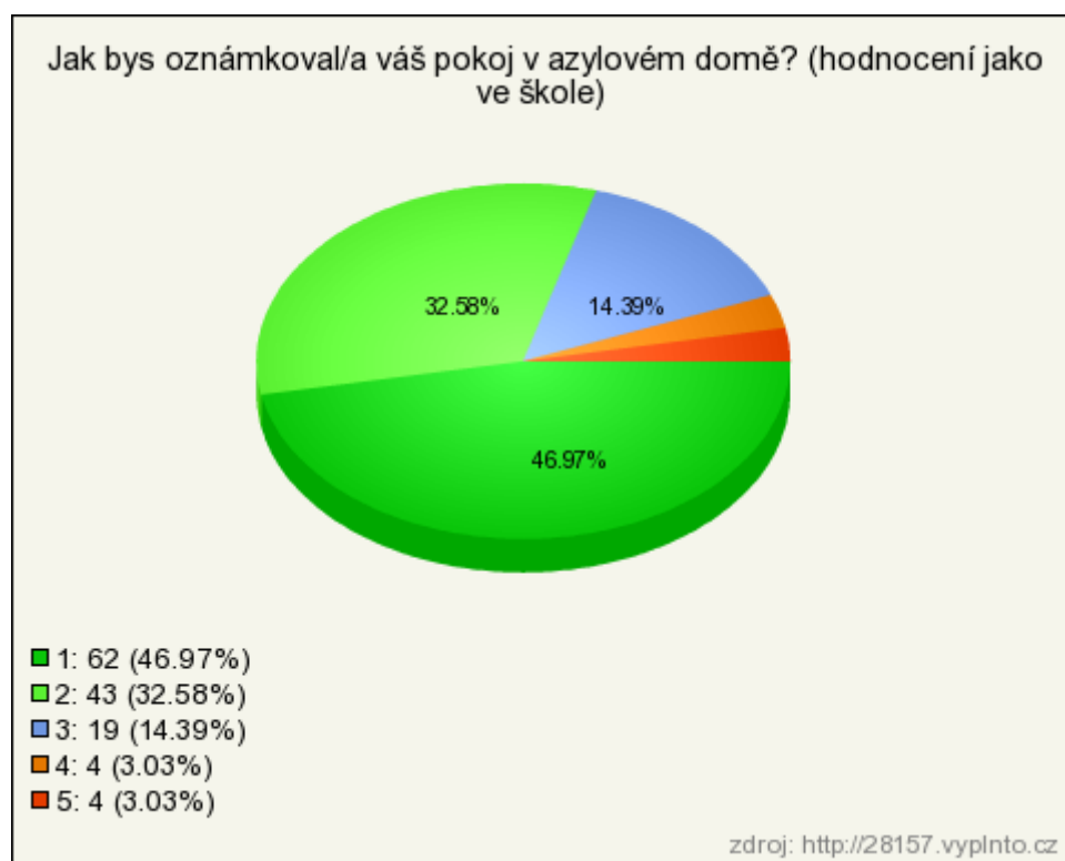
Graf č. 7 - Jak bys oznámkoval/a váš pokoj v azylovém domě?

V této otázce měli respondenti na pětistupňové škále oznámkovat jejich pokoj v azylovém domě. Jedničku zvolilo 47 % respondentů, dvojku 33 %, trojku 14 % a čtyřku a pětku shodně 3 % respondentů.