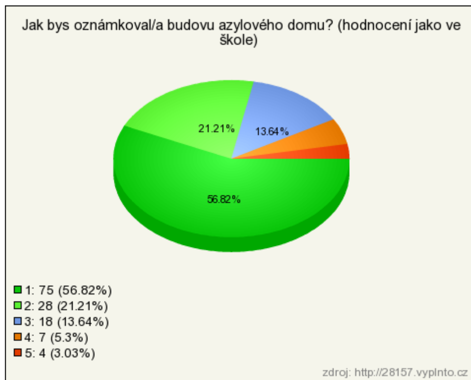
Graf č. 5 - Jak bys oznámkoval/a budovu azylového domu?

V otázce číslo deset měli respondenti oznámkovat pomocí pětistupňové škály vnější vzhled budovy azylového domu. Jedničku vybralo 57 % respondentů, dvojku 21 %, trojku 14 %, čtyřku 5 % a pětku 3 % respondentů.