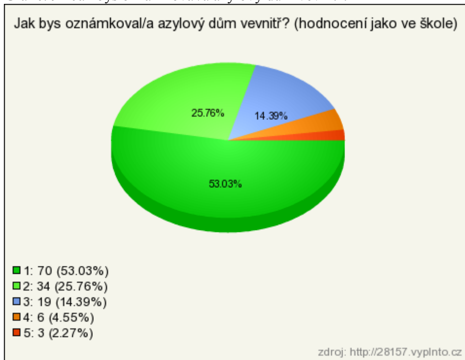
Graf č. 9 - Jak bys oznámkoval/a azylový dům vevnitř?

V této otázce měli respondenti pomocí pětistupňové škály oznámkovat vnitřek azylového domu. Jedničku zvolilo 53 % respondentů, dvojku 26 %, trojku 14 %, čtyřku 5 % a pětku 2 % respondentů.