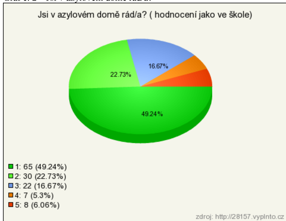
Graf č. 2 – Jsi v azylovém domě rád/a?

V otázce zda jsou rádi v azylovém domě, měli respondenti zvolit na pětistupňové škále. Jedničku zvolila téměř polovina (49 %) všech respondentů. Dvojku zaškrtnulo 23 % respondentů a trojku 17 %. Poslední dvě možnosti zaškrtnulo méně respondentů, pětku zaškrtnulo 6 % dětí a čtyřku 5 %.