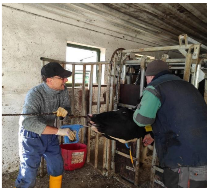
Obrázek 7.2: Bolus (Lanes Farm Vets, 2015)