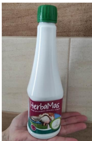
Obrázek 7.3: Doplňkové krmivo HerbaMas (Rejzková, 2023)

Některé podniky krmí před zaprahnutím převážně senem a nedávají dojnícím do krmných dávek melasu.