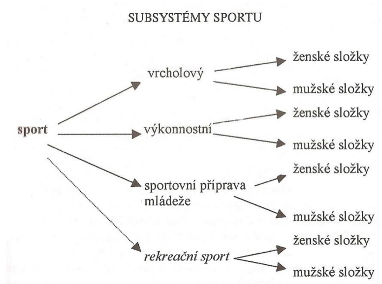
Obrázek 1. Subsystémy sportu (Hodaň, 2007, 43)

rozděluje sport do následujících subsystémů. Sport vrcholový, výkonnostní, rekreační a sportovní přípravu mládeže.