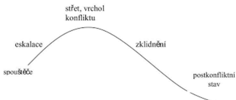
Obrázek 1: Vývoj konfliktu (Medlíková, 2007, s. 23)