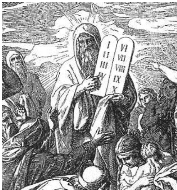
Obr. č. 4: Mojžíš a desatero 24

prvky za své vlastní. Takto se chtěli bránit a vymezit vůči náboženství kanaánských obyvatel. 23