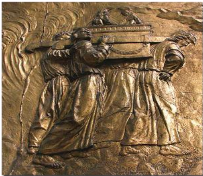
Obr. č. 9: Schrána úmluvy 57

Při následování Hospodina je problém pouze v jedné věci. Tím problémem je lidská smrtelnost. Umírají nejen lidé, kteří víru mění jako boty, podle toho, jaké je právě počasí, ale umírají i ti pevní ve víře. Vždy tedy budou lidé pevní ve víře a pak ti ostatní. Mění se jen jejich vzájemný poměr těchto lidí. Změnou rovnováhy mezi těmito lidmi se často mění osudy celých národů.