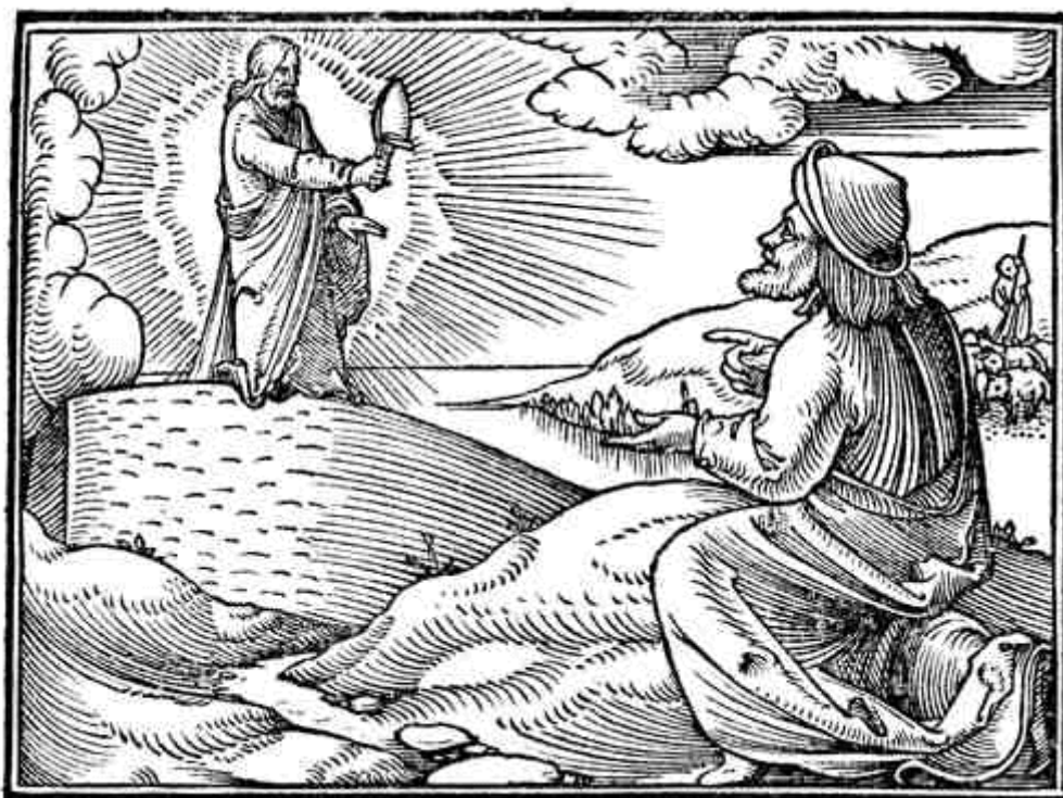
Obr. č. 8: Povolání proroka Ámose Hospodinem 51

Je příznačné, že Hospodin zvolil za svého proroka člověka prostého, pastevce a pěstitele fíkovníků. Člověka neoplývajícího hmotnými statky, člověka bez moci a vlivu. Člověka, kterého nebudou rozptylovat světské starosti. I Ámos o tom sám mluví a netají se svým původem.