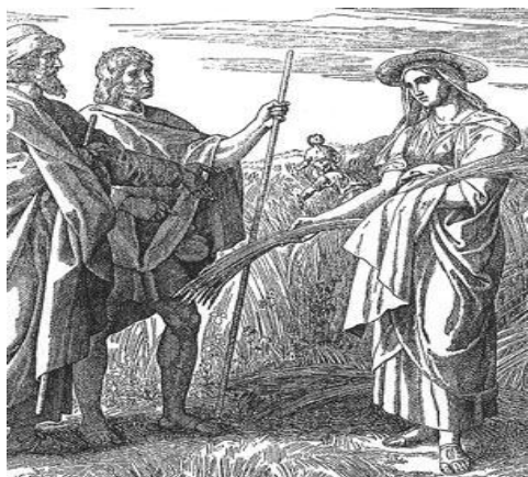
Obr. č. 6: Rút 33

Kniha Rút je po všech ukrutnostech předcházejících knih Jozue či Soudců naprostým zjevením. Je to první křišťálově čistá kapka vody, po všech těch potocích krve, které byly před tím prolity. Krutosti, zákeřnosti a nelidskost byly vystřídány něčím, co musí čtenáři připadat jako zjevení. Setkává se zde s pravým opakem všeho, co dosud četl. S lidskostí, tolerancí a soucitem. Nenachází zde bigotnost, náboženskou netoleranci, nenávist k jiným národům.