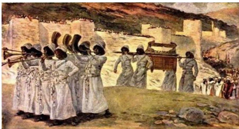
Obr. č. 5: Dobytí města Jericha 32

Dobytí jednoho z nejstarších měst světa, Jericha, bylo naopak umožněno brilantním využitím znalostí vyššího řádu. Zde se jedná o radu Hospodinovu Jozuovi. Mnohadenní pochodování mnohatisícového zástupu kolem městských hradeb, spojené s hlasitým troubením, se svými vibracemi projevilo na jejich kvalitě přesně tak, jak Jozue potřeboval.