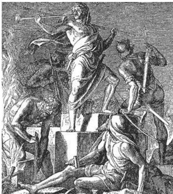
Obr. č. 7: Počátek stavby chrámu 48

Následují boje s Aramejci, obležení Samaří, Moábci, Jehuově revoluci až po vládu Jarobeáma II. Do tohoto sociálního napětí vstupuje prorok Ámos.