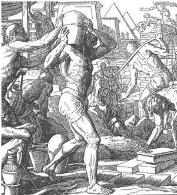
Obr. č. 1: Hebrejci v Egyptě 17

V knize Genesis sledujeme, jak nomádi putují Kanaánem, ale stále se neusazují. Hladomor je donutí odejít do Egypta. Takto sloučení nomádi se ucelí v „lid“, který žije v sociální a právní nejistotě a jsou pod tlakem a využívání cizím národem. Tento „lid“ se skládal z dvanácti kmenů – Jákobových synů. Jejich populace začíná rapidně stoupat. V Egyptě se projevují obavy z tohoto přistěhovaleckého lidu. „Toto jsou potomci synů Izraelových, kteří přišli do Egypta s Jákobem; každý přišel se svou rodinou.“ (Ex 1) 16