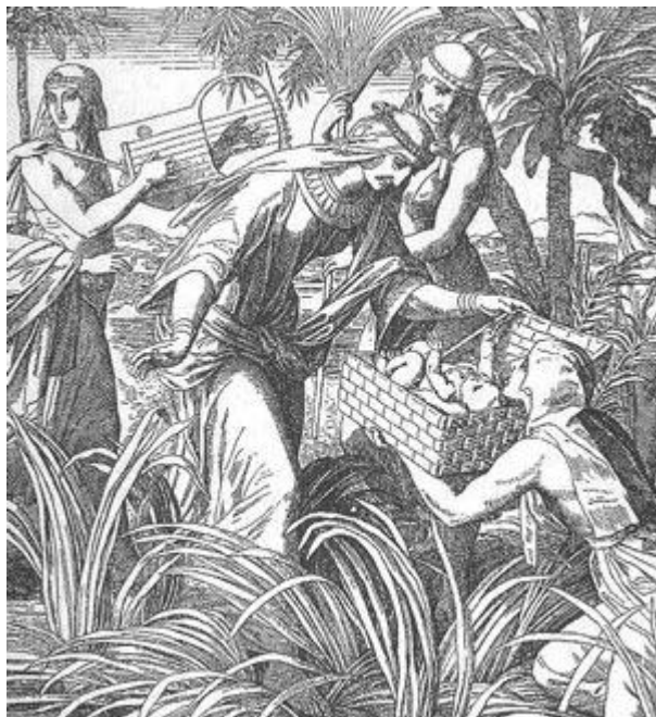
Obr. č. 2: Nalezenec Mojžíš 18

Zde bych opět upozornil na fakt, že Hebrejci si své ponížení v otroctví v podstatě zavinili sami, když jako pátá kolona podporovali a kolaborovali s hyksoskými dobyvateli, kteří na několik staletí ovládali Egypt.