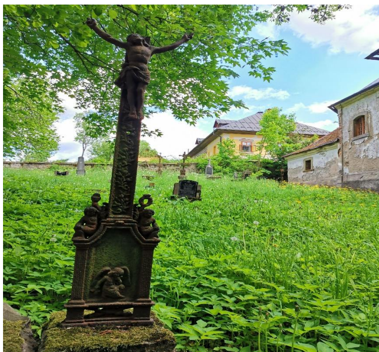
Obrázek 2 Zpustlý hřbitov v Bělé

Mohlo by se zdát, že osud Sudet se sociální prací nesouvisí. Nicméně, je nutno konstatovat, že vzájemná souvislost mezi pohraničím, jeho velkým vylidněním po válce a výkonem sociální práce existuje. Důvod je možná překvapivý, nicméně vcelku logický a prozaický. Pro vládu komunistické strany, která preferovala lidi zdravé, mladé, perspektivní a výkonné, nebyli odlišnosti od „normálu“ ku prospěchu propagandy. Bylo velmi výhodné umístit ústavy sociální péče, dětské domovy aj. právě do nezajímavých, fádních, obyčejných lokalit. Do regionů, kde bylo méně obyvatelstva, do končin, kde pohyb lidí není tak výrazný. Jednoduše, lidsky řečeno na území, kde nechtění lidé nebudou tolik vidět.