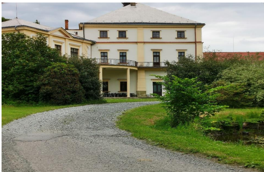
Obrázek 3 Objekt zámku Kvasiny, bývalý objekt ÚSP Kvasiny