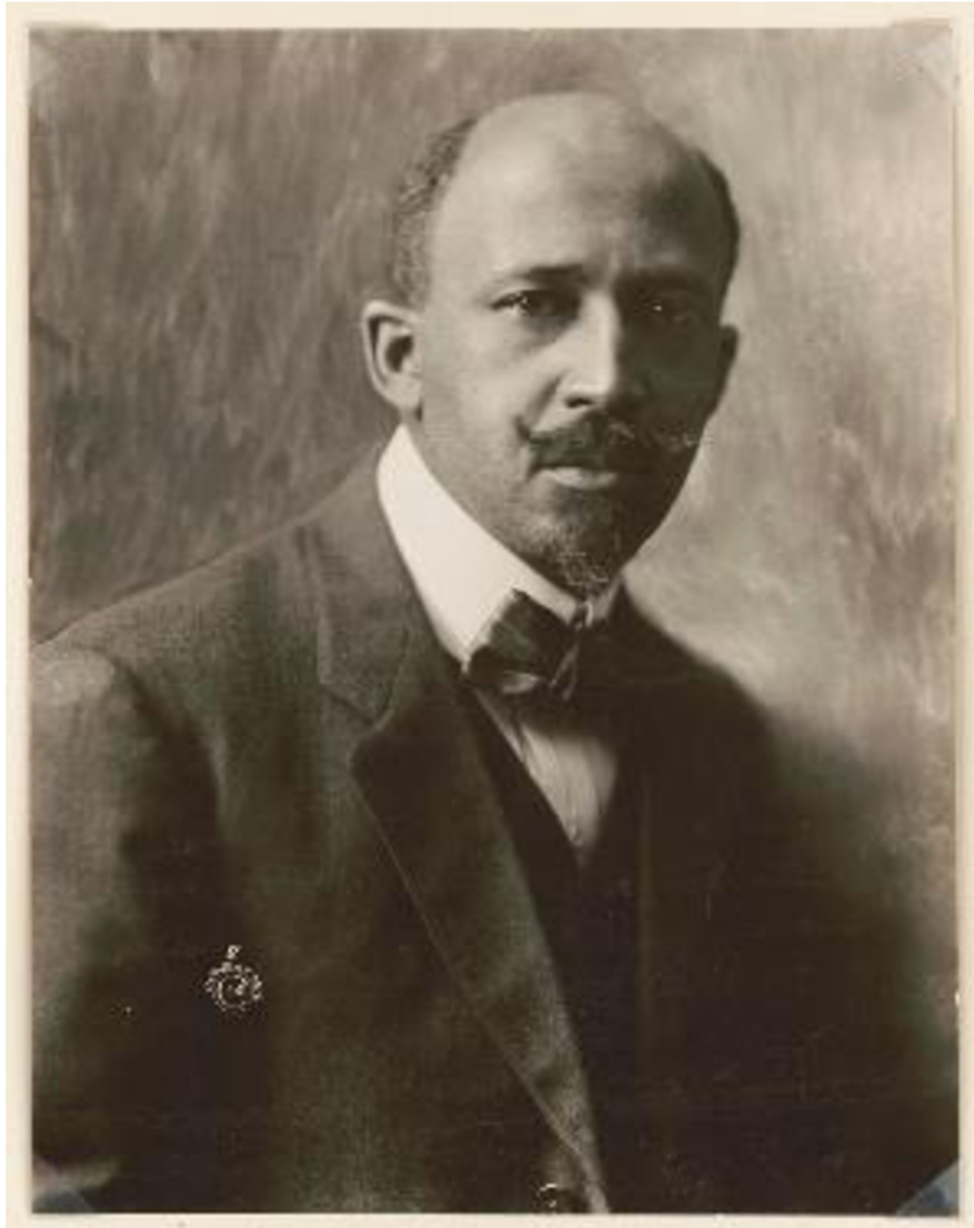
Obr. 9: W.E.B. Du Bois v roce 1919