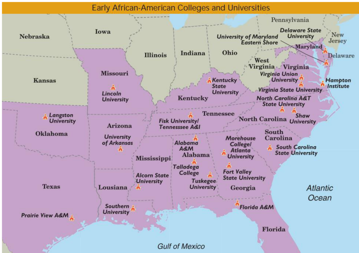
Obr. 5: Mapa vyobrazující Afroamerické univerzity