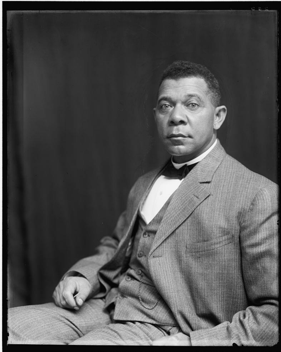
Obr. 6: Booker T. Washington okolo roku 1895