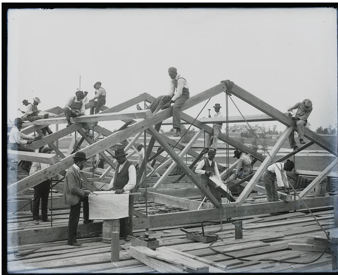
Obr. 8: Studenti Tuskegee institutu zachyceni při stavbě střechy, ca. 1902