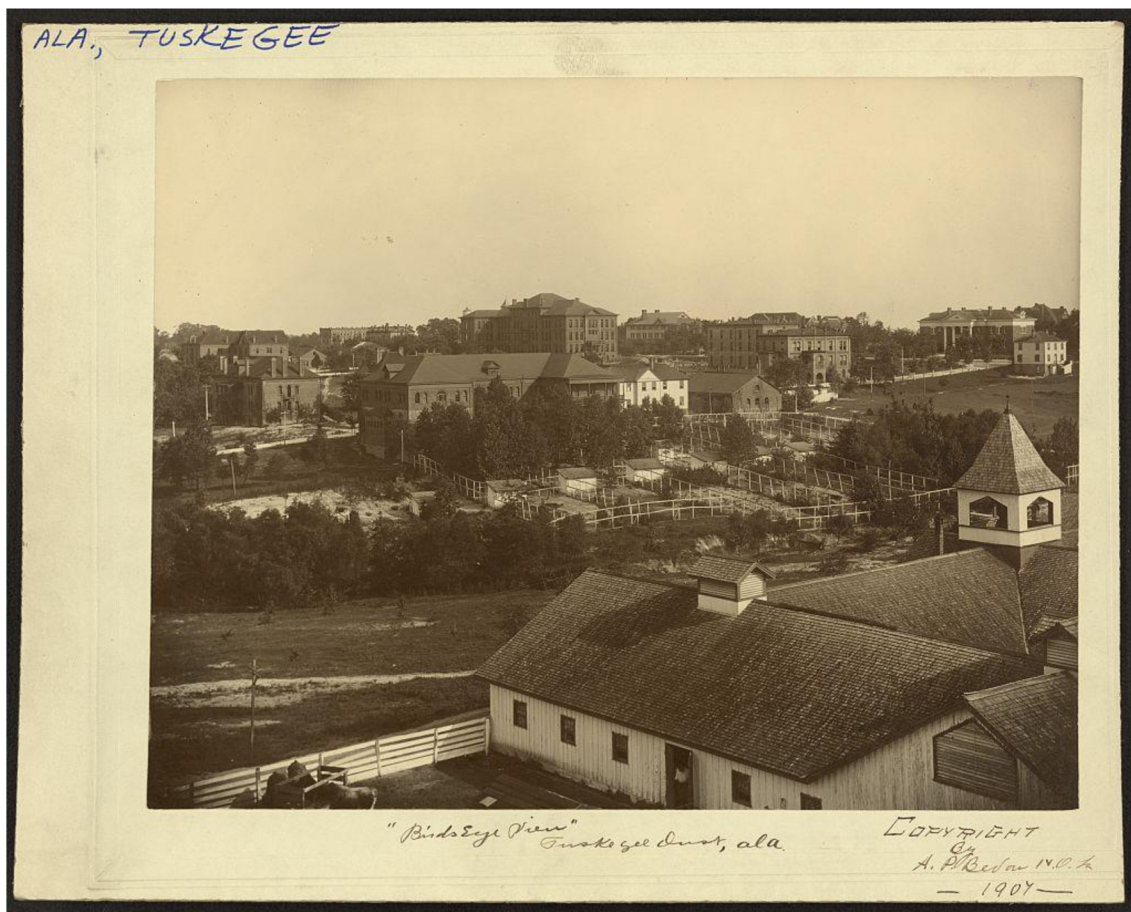
Obr. 7: „Ptačí pohled“ – Tuskegee institut v roce 1907