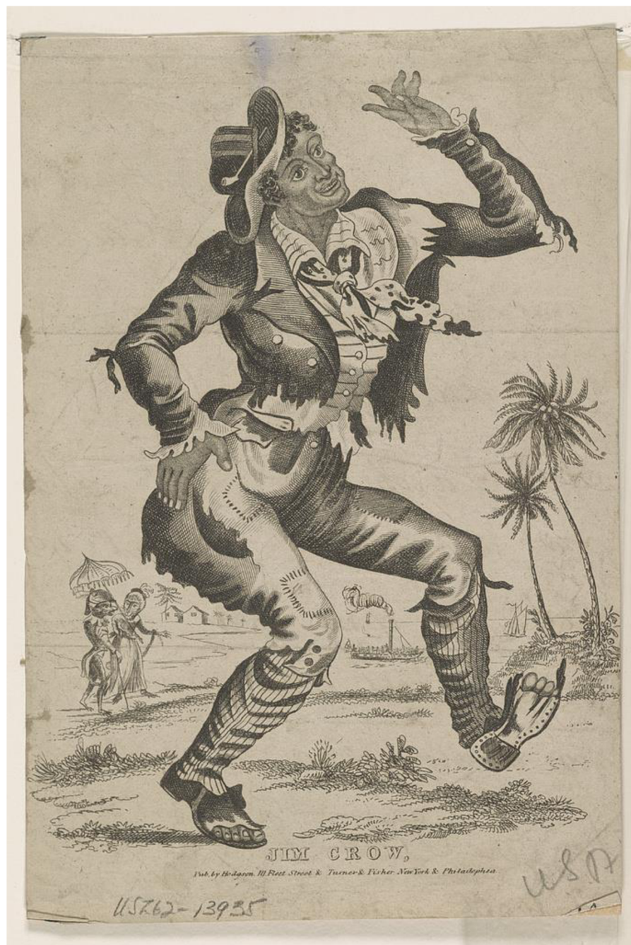
Obr. 3: Jim Crow – ilustrace vytvořena mezi roky 1835-1845