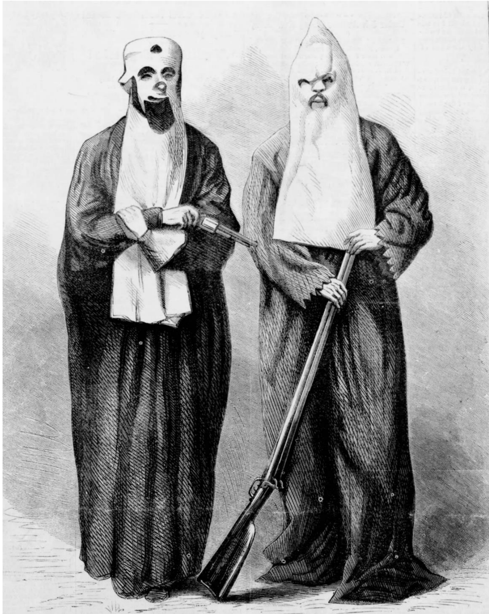
Obr. 2: Členové Ku-klux-klanu – vyobrazení z roku 1868