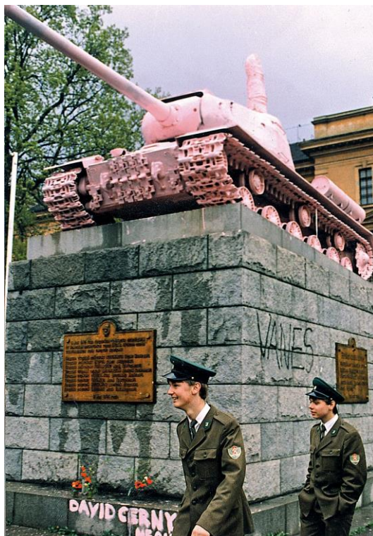
Obr. 17: David Černý – Růžový tank, 1991