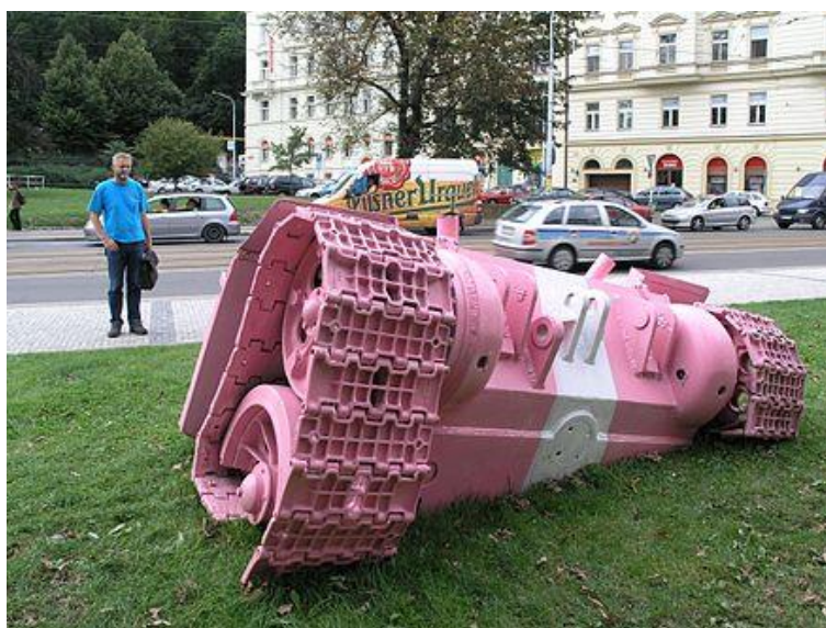
Obr. 18: Torzo tanku na Náměstí Kinských, 2008