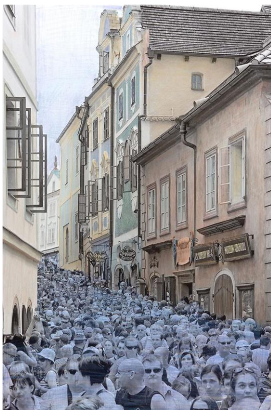
Obr. 15: Titulní strana z katalogu UNES-CO – A project by Kateřina Šedá