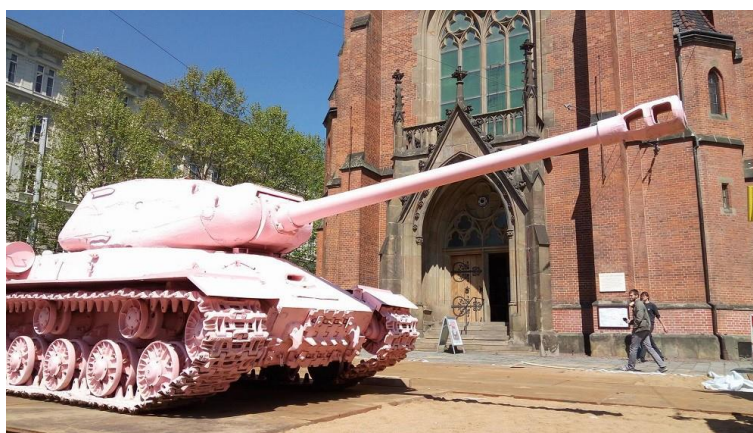
Obr. 20: Růžový tank před evangelickým kostelem v Brně, 2017