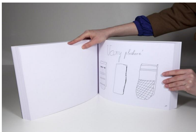
Obr. 13: Kateřina Šedá – Je mi to jedno, jedna z kreseb její babičky, 2005