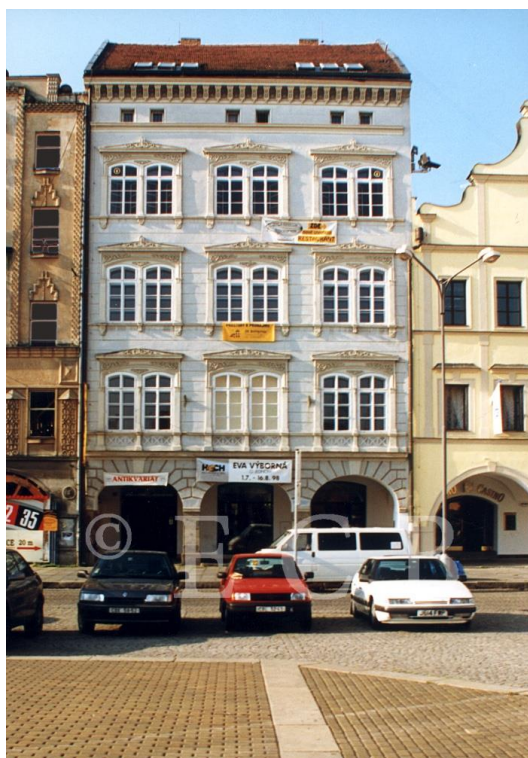
Obr. 9: Dům umění v Českých Budějovicích