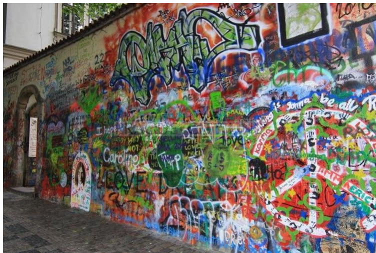
Obr. 1: Lennonova zeď, 2018