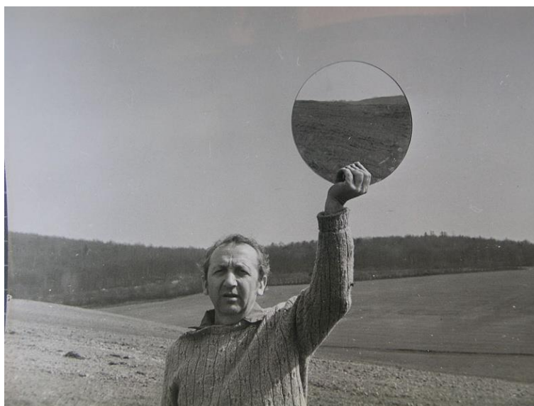
Obr. 7: Dalibor Chatrný – Souvislost protilehlých horizontů, 1973