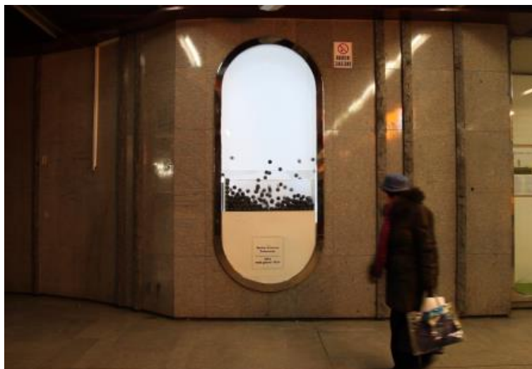
Obr. 3: Galerie Nika