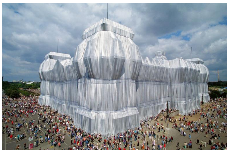
Obr.5: Christo – zakrytá budova Říšského sněmu v Berlíně, 1995