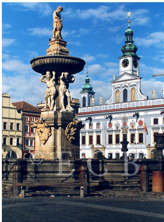
Obr. 8: Samsonova kašna v Českých Budějovicích