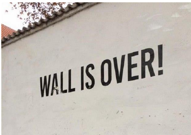
Obr. 2: Wall is over, Lennonova zeď, 2014