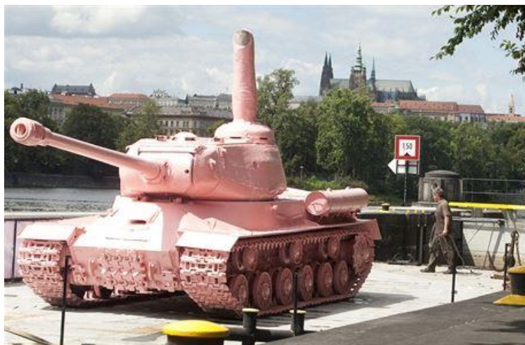
Obr. 19: Růžový tank se zdviženým prostředníkem, 2011