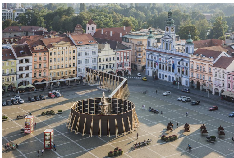
Obr. 11: Zvýrazněný vstup do Domu umění, 2016