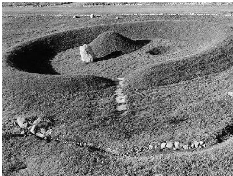
Obr. 6: Herbert Bayer – Earth Mound, 1955