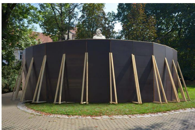
Obr. 12: Karel Řepa – Skrývání, 2016