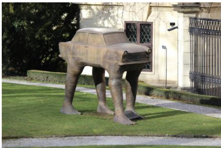
Obr. 16: David Černý – Quo Vadis, 1990