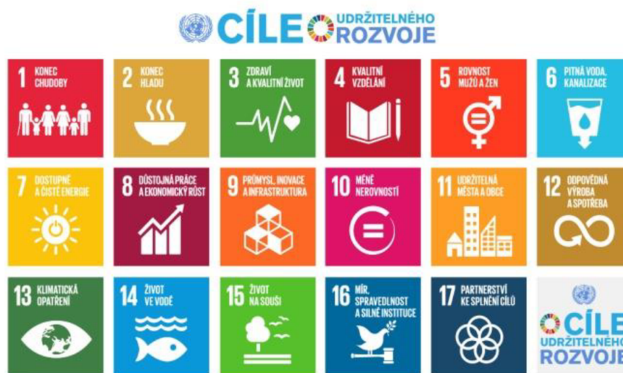
Obrázek 2 – Cíle udržitelného rozvoje, zdroj: OSN.

V práci budu pracovat se spojením environmentální udržitelnost místo komplexnějšího označení udržitelného rozvoje, abych zdůraznila soustředění především na otázky spojené s environmentalismem. Zároveň volím pojem environmentální místo ekologická udržitelnost, jelikož se zajímám o vztah mezi přírodou a společností. 45 Je důležité v této části také vysvětlit, že v práci se budu opravdu zabírat především pouze environmentální udržitelností. Práce se věnuje problematice velkých akcí a znečišťování životního prostředí přispívající ke klimatické změně. Ekonomické i sociální otázky jsou s tématem úzce spjaté a mé respondentky se jich také v některých částech svých výpovědí dotknou. Ať už se jedná o ekonomické aspekty některých udržitelných řešení či nedostatek pracovní síly věnující se tématu. Délka a potřeba užšího zaměření bakalářské práce mi neumožní tyto jejich postřehy více do hloubky analyzovat, ale budu se snažit je reflektovat a zdůraznit.