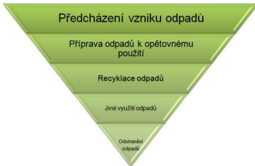
Obrázek 4 - Hierarchie odpadu