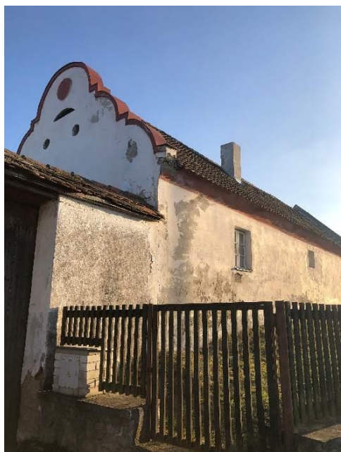
Obrázek č. 5: Rodný dům Blanky Kulínské