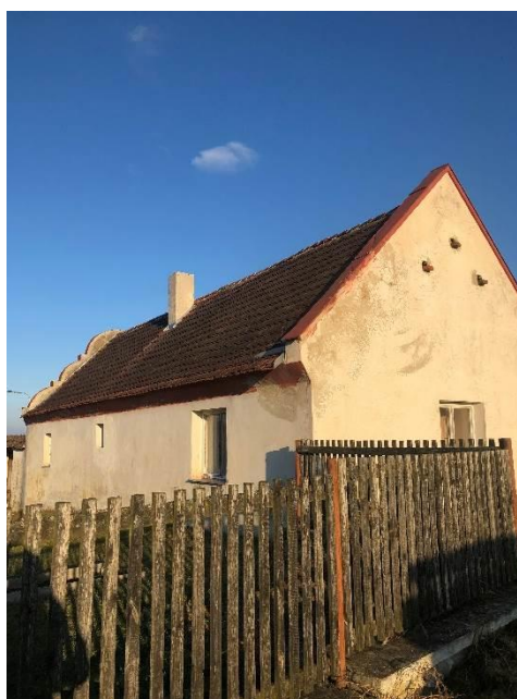
Obrázek č. 6: Rodný dům čp. 18 v Chlaponicích u Písku