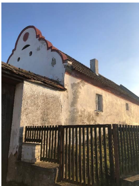
Obrázek č. 5: Rodný dům Blanky Kulínské