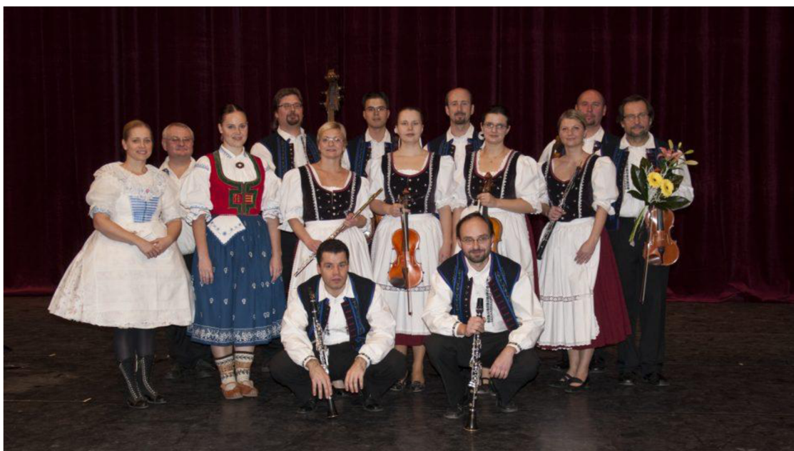
Obrázek č. 3: Brněnský orchestr lidových nástrojů