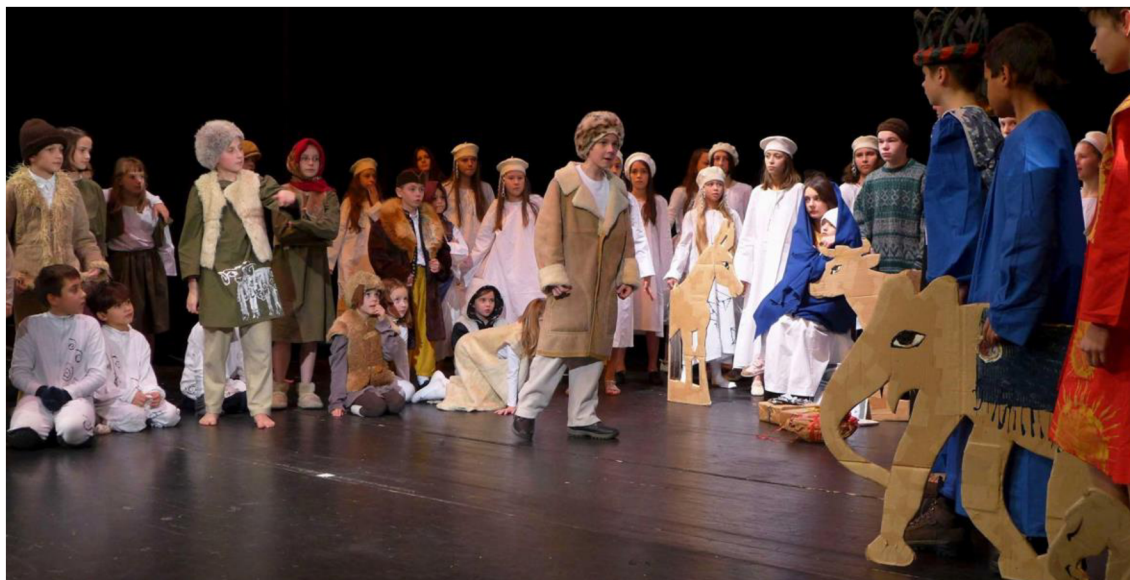
Obrázek č. 1: Dismanův rozhlasový dětský soubor