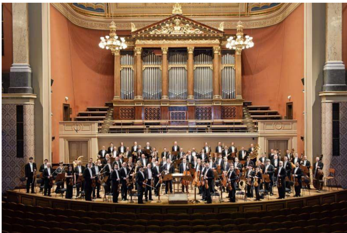
Obrázek č. 2: Symfonický orchestr Českého rozhlasu