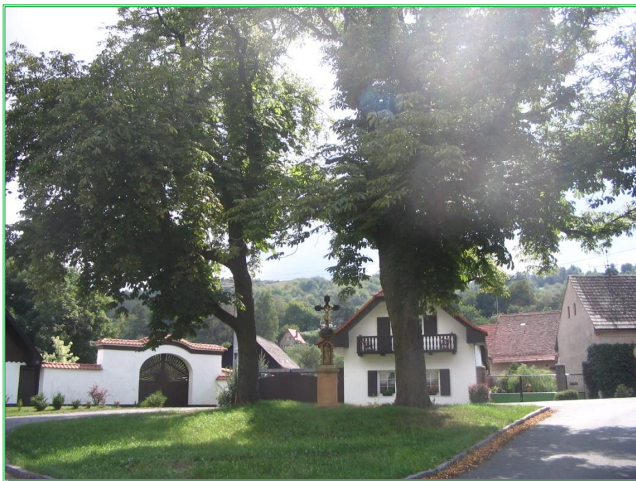
Obrázek č. 9 - Náves obce Račice