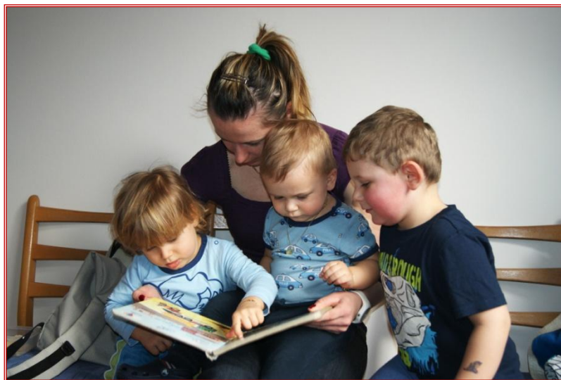
Obrázek č. 5 - Dětský koutek