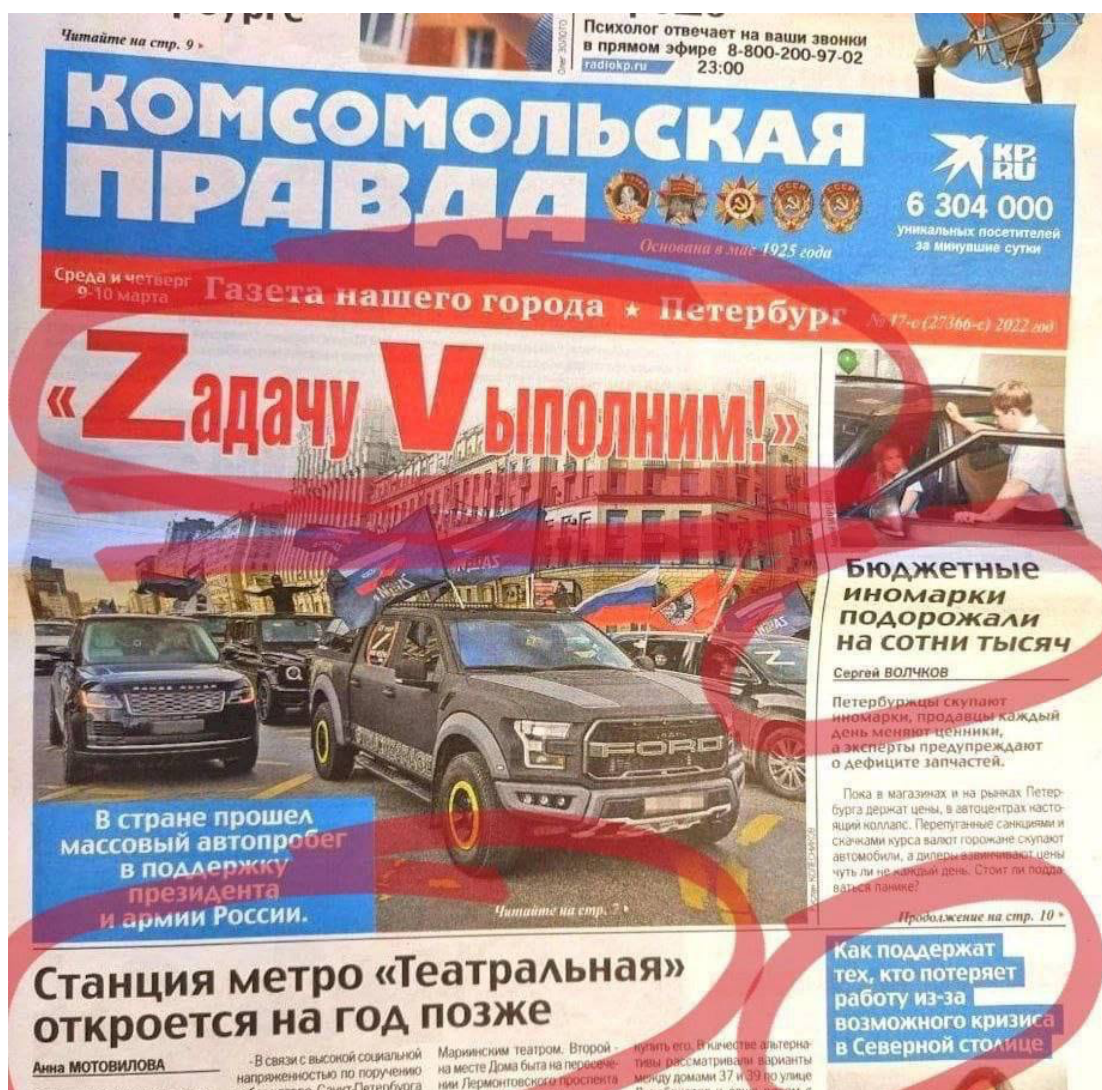
Рýже. 4: публикация кампане в новинах

Navzdory skutečnosti, že internetové zdroje jsou mnohem modernějšími zdroji informací a pravidelně je navštěvují miliony lidí, ruská vláda nezapomíná na lásku věkových skupin obyvatelstva k tisku, a proto se snaží vydávat i reklamní materiály. v novinách a časopisech: zejména na prvním Na stránkách jsou publikovány fotografie svědčící o masové podpoře ruské armády a současné vlády.