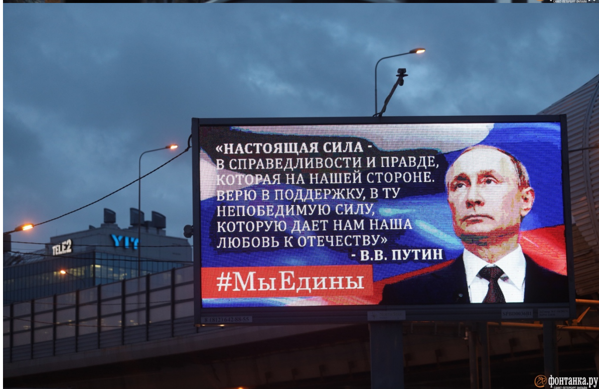
Rýže. 2: banner kampaně