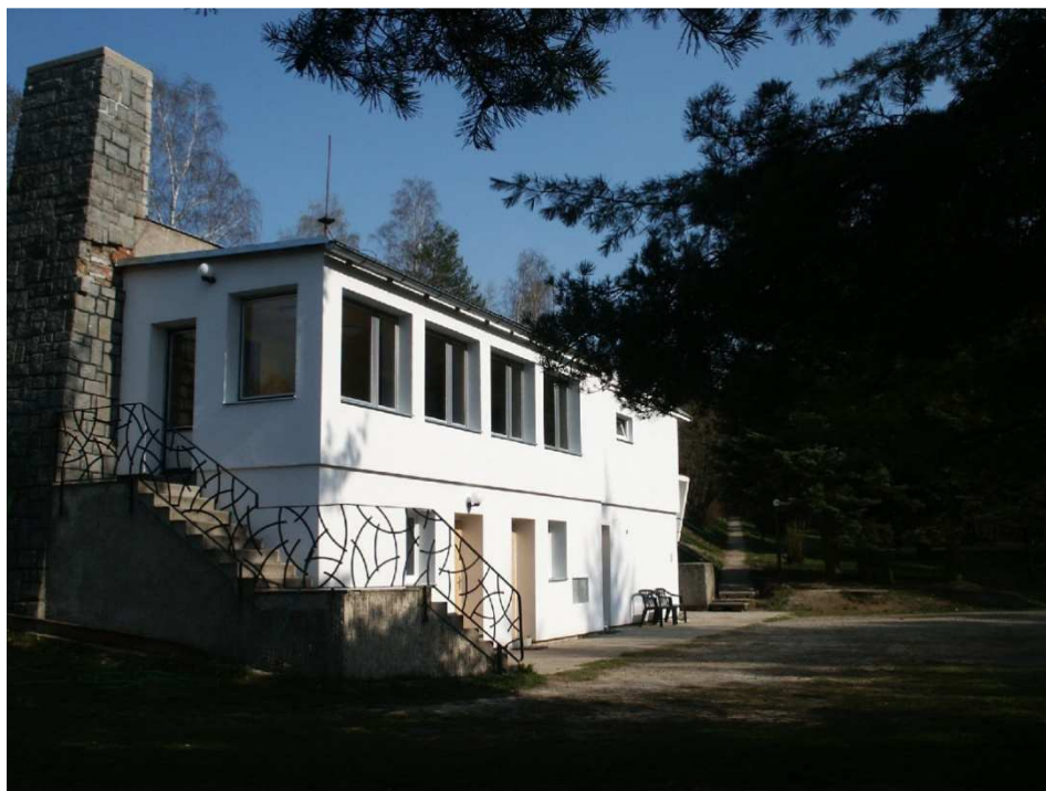
Foto hlavní budovy komunity